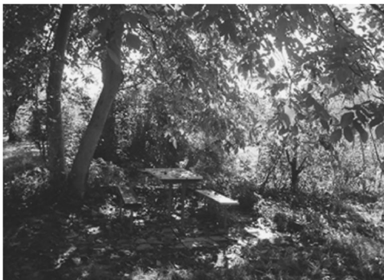
Slika 3. Korištenje prostora postojećeg parka od strane stanara