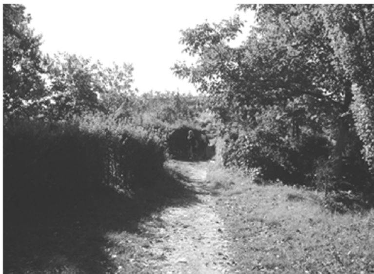
Slika 2. Pogled na postojeći neformalni puteljak koji se koristi za prelaz preko željezničke pruge