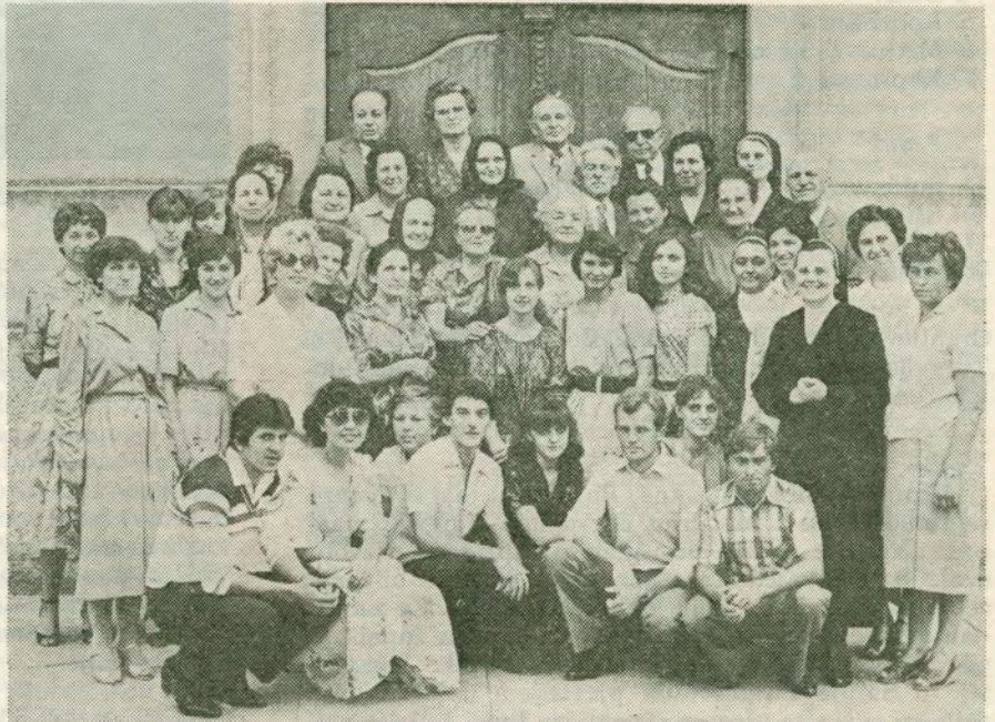
Katedralni zbor »Albe Vidaković« u Subotici