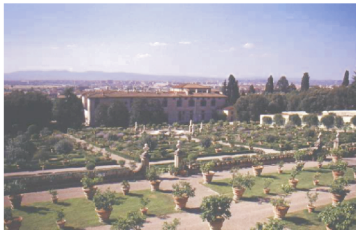
Slika 5. Parter oranževaca u parku vile Castello (Firenca, Italija)

Istovremeno pojavljivali su se i akcenti između svijetla i tame. Tako su bile travne plohe osnova za svijetlo a visoke vertikalne šišanog drveća osnova za tamne elemente.