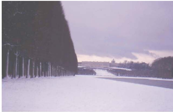
Slika 6. Parter Versailles (Versailles, Francuska)