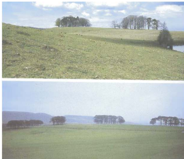
Slika 7. Upotreba drvenih grupa (Petworth i Temple Newsam) (Ogrin, 1993:156)

Za stvaranje tektonski akcenata na širokim tratinskim plohama odabirali su drvene vrste kao Fagus sylvatica , Quercus sp, Aesculus hippocastanum (Ogrin, 1993:132). Uspravne i vertikalne krune drveća omogućavale su drvenim grupama kompaktnost. U čistom engleskom slogu boja morfološka osobina nije bila važna. Akcente su stvarali između razlike tamno - svjetlo. Nešto kasnije, kad je počeo pitoreskni slog, važne su postale tekstura i boja bilja.