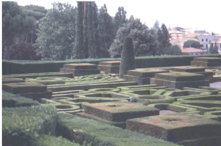
Slika 3. Villa Lante (Bagnaia kod Viterba, Italija)

S propasti antike došla su za umjetnost jednolika i neplodna vremena. Vrtna djelatnost bila je ometena vanjskim neprijateljima, pa se zato razvila samo u unutrašnjosti dvorišta samostana i dvoraca. Srednjovjekovno dvorište bilo je podijeljeno putevima na četiri plohe zasađene bršljanom ili je na njima bila trava. U središtu bio je bunar, ponekad je ulogu centralnog motiva preuzela i biljka sa simboličnim osobinama. Kao primjer poznata je upotreba junipera ( Juniperus sabina ) koji je istjerivao zle duhove. Ispred crkve, koja je bila često uz samostan, nalazio se veći otvoreni prostor. Označavalo ga je nešto krupnije drvo (najčešće lipa), koje je imalo ulogu orijentira i mjesto druženja vjernika. Obavezno je uz samostan bio i paradizo , koji je imao estetsko značenje. Zasađen je bio sa voćnim vrstama, a imao je i vodeni motiv sa simboličnim značenjem očistiti dušu pred ulazom u sveti prostor. Kod samostanske varijante srednjovjekovnog perivoja prostorni koncept bio je determiniran zgradama, biljni materijal samo je pratilac i nema toliko prostornoznačajnih karakteristika. Biljke su samo popunile unutrašnjost dijelova vrta odijeljenja (povrtni, voćni biljni dio). Mjere za izbor biljnih vrsta odnosile su se na upotrebu biljaka, manje na morfološke karakteristike. Društvene okolnosti nisu podržavale estetske funkcije perivoja, bitnije su bile utilitarne funkcije (Dobrilović, 2002).