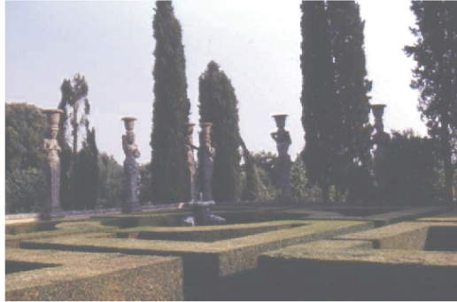
Slika 4. Vrt uz vilu Farnese u Capraroli (Caprarola, Viterbo, Italija)

Zatvorena srednjovjekovna dvorišta, koja su čuvala čovjeka od vanjskog svijeta u renesansi nisu više odgovarala novim društvenim idejama. Čovjek kao središte univerzuma tražio je u mislima kao i u kompozicijskom načinu kompleksniju okolinu. U to doba nastali su svi krajobrazni oblici, koji su u sljedećim umjetničko-povijesnim razdobljima doživljavali male razlike. Najbitnije pri upotrebi ukrasnog bilja u renesansi bila je izgradnja perivoja na osnovi ostvarivanja tektonskih naglasaka. Osnovni naglasak bio je između ravnih horizontalnih tratinskih ploha i vertikalnih volumena drveća ili vodoskoka.