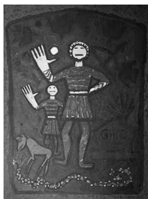
sl.8. Naslovnica knjige „Art since 1945”, Harry N. Abrams, Inc. Publishers, New York, 1962.