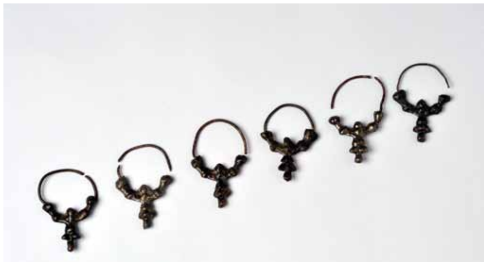
Sl. 6. Grobna cjelina 40. Srebrne lijevane rustikalne grozdaste naušnice s četirima koljencima. Stanje nakon konzerviranja.