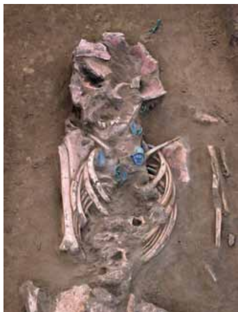
Sl. 3. Zvonimirovo – Veliko polje. Nalazi dvodijelnih srcolikih privjesaka. Stanje tijekom istraživanja.

Lijevo od kostiju glave pronađena je lijevana grozdasta naušnica s četiri koljenca tipa G.17b (1). 2 Ispod glave, s desne strane, pronađeno je još pet lijevanih grozdastih naušnica s četiri koljenca tipa G.17b (2-6). S lijeve strane glave, ispod glave te na prsima pokojnice pronađeni su ostaci ogrlice od dvodijelnih srcolikih privjesaka tipa G.9a, odnosno tipa T.42a, brončanih praporaca tipa G.10 te perli od puhanog stakla nanizanih na tkaninu tipa G.39-40 (7). Lijevo od glave pronađena su dva srcolika privjeska tipa G.9a, odnosno tipa T.42a (7a, b). Na prsima pokojnice pronađena su još tri dvodijelna srcolika privjeska od srebra i brončanog gornjeg dijela tipa G.9a, odnosno tipa T.42a (7c-e). Oko prsa je pronađeno nekoliko sitnih perlica (7k) te dva dvodijelna srcolika privjeska tipa G.9a, odnosno T.42a (7g, h) kao i niz perli nanizanih na tkaninu (7k) s kojima su bili povezani praporac tipa G.10 (7j) te srcoliki dvodijelni privjesak tipa G.9a, odnosno tipa T.42a (7f). Pokretni su nalazi nakon prepariranja i konzerviranja u Hrvatskom restauratorskom zavodu pohranjeni u Gradskom muzeju u Virovitici.