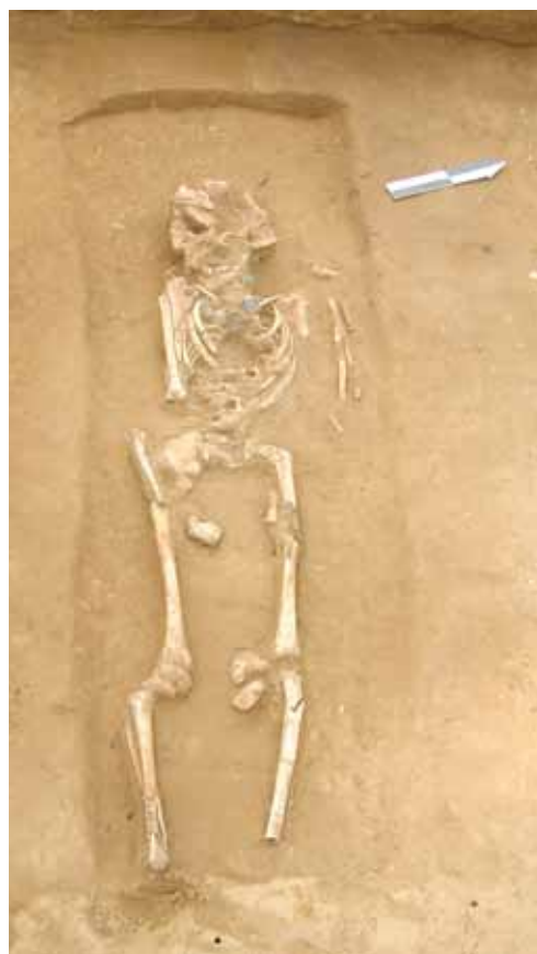
Sl. 1. Zvonimirovo – Veliko polje. Grobna cjelina 40.

Loše uščuvan kostur, položen u raku pravokutna oblika zaobljenih uglova u kvadrantu B-8. Vrh rake nalazio se na dubini od 113,58 m, dok je dno bilo na 113,51 m. Duljina rake iznosila je 1,24 m, dok je najveća širina rake bila 0,45 m. Kostur je bio položen u ispruženom položaju na leđima. Usljed oranja dosta je oštećena glava, kosti lijeve podlaktice te kosti šaka, stopala i zdjelice. Uščuvana desna ruka blago je savijena u laktu i položena u zdjelicu. Duljina kostura iznosila je 1,00 m. Kostur je bio položen u smjeru Z-I s otklonom od 106° od sjevera. Spol: žena; dob: ?. Vrlo vjerojatno djevojčica. Pokretni nalazi pohranjeni su u Gradskom muzeju u Virovitici.