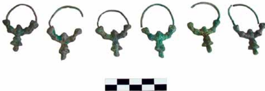
Sl. 5. Grobna cjelina 40. Srebrne lijevane rustikalne grozdaste naušnice s četirima koljencima. Stanje prije konzerviranja.