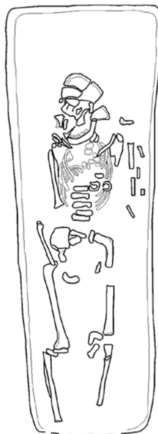
Sl. 2. Zvonimirovo – Veliko polje. Grobna cjelina 40. (crtež Daria Ložnjak Dizdar, digitalizacija Kristina Jelinčić Vučković)