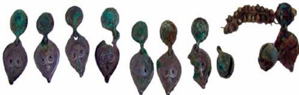
Sl. 4. Zvonimirovo – Veliko polje. Ogrlica od dvodijelnih scolikih privjesaka, praporaca, perli od puhanog stakla i tkanine. Stanje tijekom istraživanja.