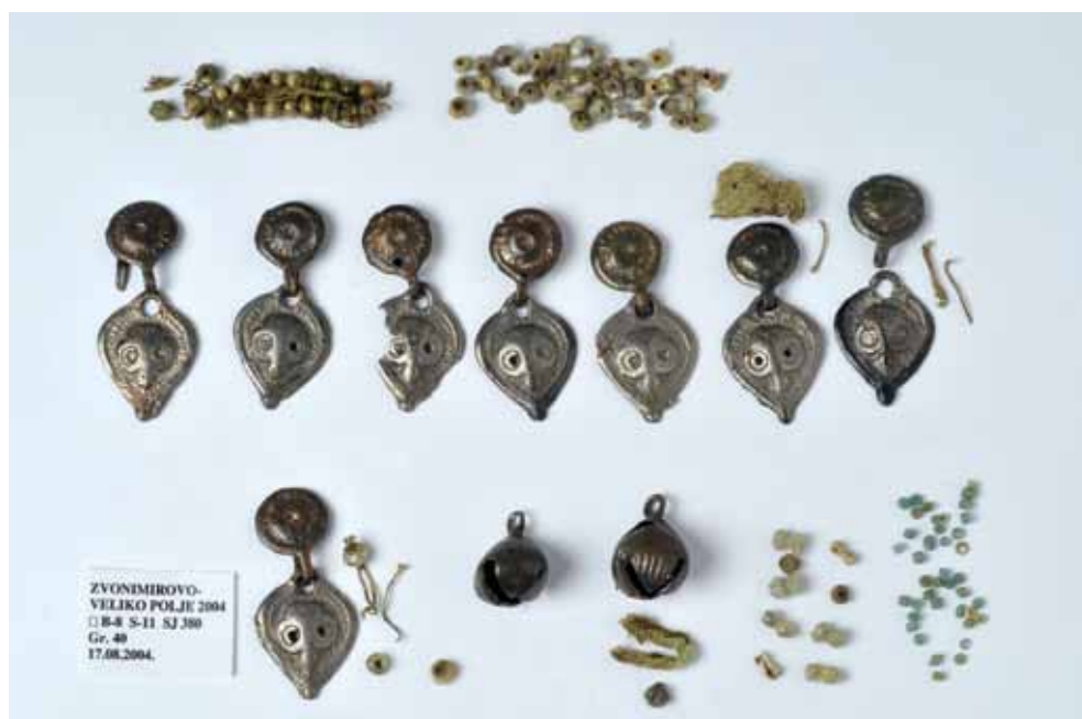
Sl. 7. Grobna cjelina 40. Ogrlica od dvodijelnih srcolikih privjesaka, praporaca i staklenih perli nanizanih na tkaninu. (snimio Jurica Škudar)