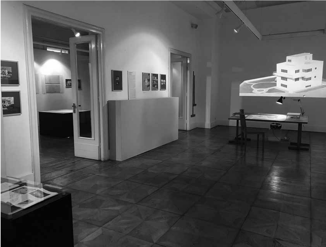
sl.3. U Hrvatskome muzeju arhitekture HAZU u Zagrebu je od 19. prosinca do 27. veljače bila postavljena izložba „Budimir Pervan – iz arhiva arhitekta”, na kojoj je predstavljeno stvaralaštvo arhitekta i urbanista Budimira Pervana (1910. – 1982.).

bio izgrađen u 16. st. Naime, tada je, za vrijeme mletačke uprave, izgrađen obrambeni zid s kulama okrenutima prema kopnu, za zaštitu stanovništva od Osmanlija i razbojnika. Budući da je bedem bio dijelom porušen, a dijelom dograđen potkraj 19. i početkom 20. st., počela se planirati njegova rekonstrukcija. Stoga je Pervan napravio rekonstrukciju bedema prema starim fotografijama. Projekt revitalizacije stare jezgre Primoštena predviđao je moguću dogradnju starih kamenih kuća i izgradnju novih u dotad neurbaniziranim predjelima, uz uvjet da budu izgrađene po uzoru na stare kamene kuće s krovom od kamenih ploča. Izgradnja mosta, kao ni većina projekta revitalizacije i rekonstrukcije stare jezgre Primoštena, nikad nije realizirana.