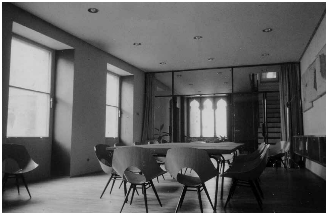
sl.2. Uredski prostor Urbanističkog zavoda Dalmacije nakon adaptacije, Vestibul 4 u Splitu, 1958.

Intimniji kutak izložbe činile su videoprojkcije obiteljskih fotografija, a u prvoj dvorani bio je izložen i Pervanov drveni radni stol s ravnalima, trokutima i ostalim priborom, zajedno s njegovom fotografijom i potpisom na projektu iz studentskih dana te fotografijom kuće obitelji Pervan, projektirane i izgrađene u Splitu 1936., u kubističkom stilu.