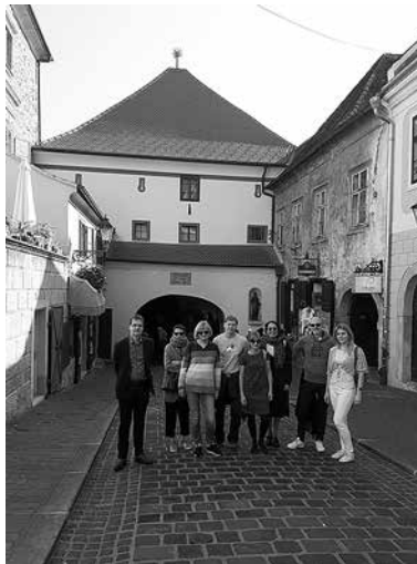
sl.3. Sudionici EGMUS grupe tijekom posjeta Ateljeru Meštrović u Zagrebu