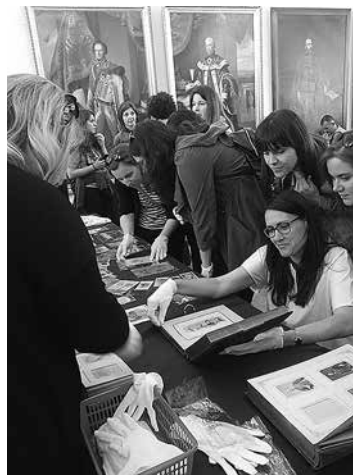
sl.5. Detalj s izlaganja

sl.6. Hrvatski povijesni muzej – organizirani obilazak muzeja, i uvid u dio fotografske zbirke, interaktivna radionica