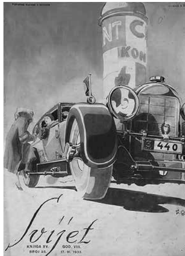
sl.4. Sergej Glumac, „Kosor Rotonde”, oko 1925.-26., privatno vlasništvo