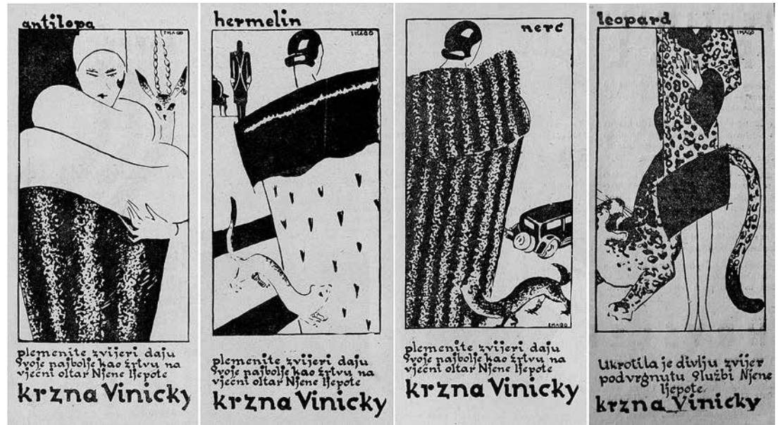
sl.7. Sergije Glumac, Serija oglasa za krzna Vinicky, „Novosti” i „Kulisa”, rujan - listopad 1929.

Među mnogobrojnim konkretnim doprinosima te monografije dovoljno je istaknuti doprinos pronalasku velikog broja dosad nikad obrađenih djela, obradu novopronađene dokumentacije, utvrđivanje najstarijeg primjera nadrealizma u Hrvatskoj, ispravljanje netočnih biografskih podataka, nove atribucije plakata te obradu Glumčeva scenografskog opusa. Osim grafičkog opusa, grafičkog dizajna te plakata i scenografija, obrađen je i Glumčev slikarski opus, uređenje interijera te arhitektonski projekti za izložbene prostore ili paviljone, kao i njegov angažman u strukovnim udru-gama poput ULUH-a i Likuma. Novopronađene idejne skice, predlošci za plakate ili reklame dio su velikog doprinos-a monografije. Takvim iznimno temeljitim istraživanjem i dugotrajnom detaljnom obradom opusa, Sergije Glumac nesumnjivo je dobio novo, mnogo značajnije mjesto, mjesto kakvo zaslužuje, i to u različitim područjima likovnog stvaralaštva u Hrvatskoj.