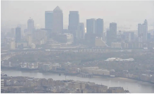
Slika 3 – Zagađenje zraka nad Londonom. Podatci znanstvenika pokazuju da toksični zrak uzrokuje raniju smrt nego pušenje.

života. To se, napominju autori, svodi na niz čimbenika, uključujući afričko zagađenje zraka pod utjecajem prašine koju raznosi vjetar.