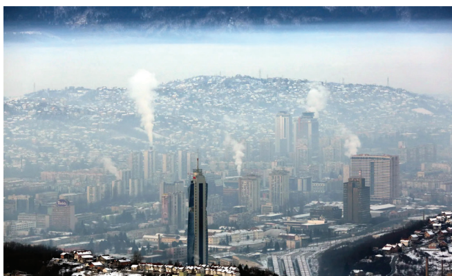
Slika 1 – Studija je utvrdila da je na svjetskoj razini život ljudi zbog zagađenog zraka u prosjeku skraćen za 2,9 godina. Iznad Sarajeva, BIH.

Globalno istraživanje pokazuje da je prosječna smrtnost od zagađenja zraka viša od one koju izaziva pušenje