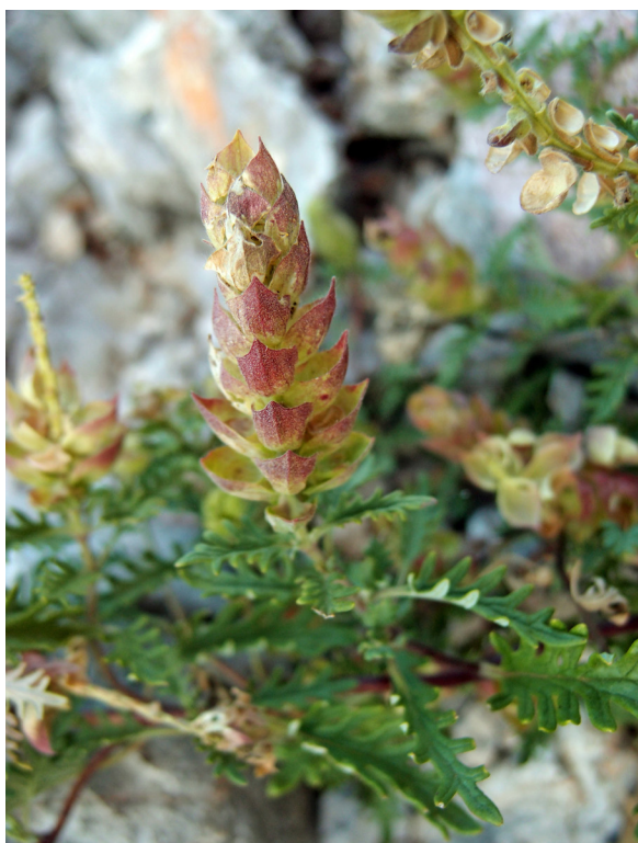
Slika 2. Habitus s detaljima ploda Scutellaria orientalis subsp. pinnatifida iznad Tomišine drage (26. lipnja 2018.).

vilina kosa ( Cuscuta monogyna Vahl), što je tek treći nalaz te vrste u Hrvatskoj. Naime, jedan je podatak iz Slavonije, bez preciznog toponima (Hirc 1906), a drugi s Kamešnice (Plazibat 2002).