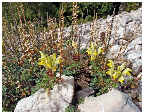
Slika 3. Habitus Scutellaria orientalis subsp. pinnatifida na otoku Krku (Foto: Lj. Borovečki-Voska, 7. listopada 2018.).

Procijenjeno je da populacija na otoku Krku nije ničim značajno ugrožena jer je na relativno nepristupačnom terenu podalje od naselja, a pastirskom