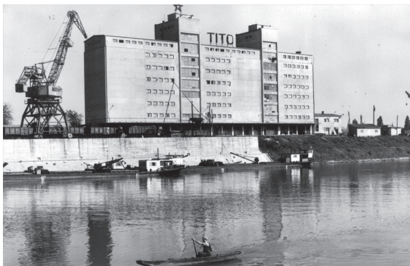
Gradski silos, neonski natpis "Tito", datirana u šezdesete godine prema godini putovanja

ovakav grad koji svojom 'mekoćom' odražava stanje uma svojih građana, prema urbanoj antropologiji, odraz konceptualiziranja urbanih prostora putem zadovoljenja potreba i imaginarija svojih korisnika (Raban nav. pr. Gulin Zrnić 2006:162). U velikoj mjeri, socijalistički grad u trenutku svog začeća ima dvojan zadatak. Odraziti adekvatno zahtjeve socijalizma i vidljivosti, ali i pobijediti velik dio tereta sjećanja grada na predsocijalizam i njegove urbane pertinencije. Uporište je ideja horizontalne temporalnosti koja osigurava nesmetan semiotički protok ideje socijalizma. Sve izvan tog horizonta izvor je remećenja ideje o uspostavi čvrste strukture simboličkog reda. Dramatična obuhvatnost novog poretka izmiče svoj fokus od "čovjeka novog tipa" na "grad novog tipa".