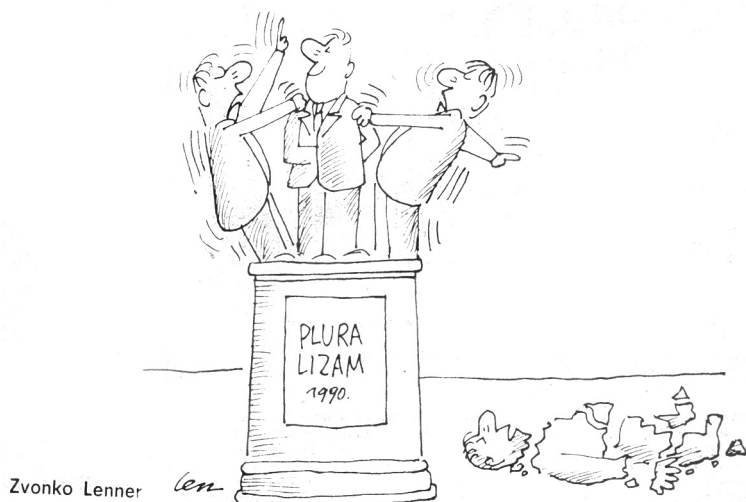
Pluralizam, karikatura, Sisački tjednik, 23. kolovoza 1990.

Mišljenja smo da postoji nekoliko stupnjeva kojima ideologija djeluje na mogućnosti sjećanja na ljude, događaje i prošlost u najširem smislu. U tom smislu sjećanje nam se pokazalo važnim za naše istraživanje jer se njime operacionalizirala funkcionalnost simboličke naracije za vrijeme i nakon socijalizma. Tako se istraživanje simbolizma prometnulo u razmišljanja o sjećanju.