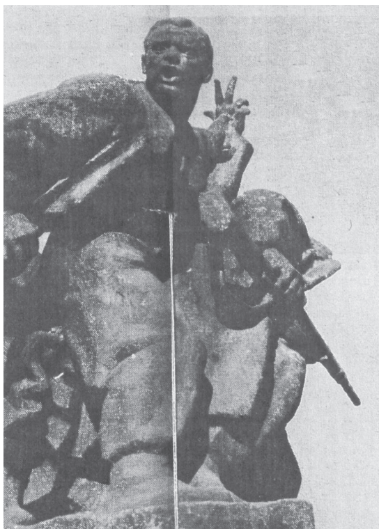
Ilustracija novinskog članka "Pozdrav Sišćanima – s tri prsta", Sisački tjednik, 9. siječnja 1992:7

su likovni prikaz doživjele karikaturom objavljenom u Sisačkom tjedniku pod nazivom Pluralizam 1990. (slika 3) 8 . Tri muškarca koja raspravljaju na postolju kakva obično nalazimo kao podloge spomenicima kao da pokušavaju zadobiti "monumentalnu prezentnost" u galeriji nacionalnih heroja. Četvrta figura odbačena je i "slomljena" leži na podnožju "spomenika" političkoj kulturi nedijaloga. Jedna je od mogućih interpretacija ta da je politička tranzicija ocrtana kao ovladavanje simboličkim poljem i adekvatnom javnom reprezentacijom. I dok se memorijalni kompleksi i prakse socijalističkog intenzivno dovode u pitanje javnim praksama rušenja, premještanja i političkim naracijama, nove političke figure zauzimaju ispražnjena simbolička