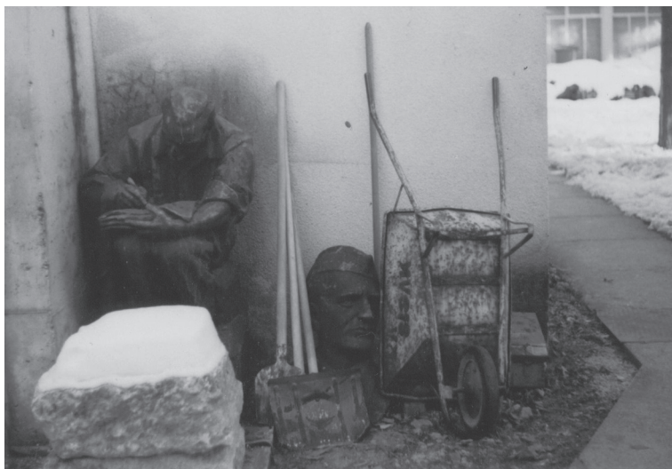
Fotografija spomenika Moše Pijade u dvorištu Gradskog muzeja Sisak, sredina devedesetih

"umjetničkim" skulpturama i praznim prostorima koje smo zatekli u Capragu tijekom istraživanja, lako ćemo ukazati da je simbolički kapital sisačkih socijalističkih spomenika postao mjesto "uznemiravanja" zahvaljujući govoru mržnje. Disfunkcija spomenika ne počiva na činjenici da je predložak spomenika socijalistička slika, ideja ili događaj, naime u najvećem broju oni su apstraktni, već je pročišćavanje simboličke naracije i vizualnih identifikatora socijalizma posljedica ideološko-diskurzivne formacije (Fairclough: 1995) koja djeluje tako da naturalizira ideologije i omogućava da se iste prihvate kao ne-ideološki common sense (ibid. 27). Članak o "umjetničkim" skulpturama je eho postsocijalističke retribucije i tretira spomenike kao simptome socijalizma u neprihvatljivu vremenskom trajanju. Protest protiv spomenika mimikriran je brigom o okolišu, a koncesija nije učinjena niti s obzirom na činjenicu da niti jedna skulptura u parku nije realistična. Poimanje da je nedvojbeno ideološko začeo spomenika dovoljan razlog njihova definiranja kao simboličkog otpada u suprotnosti je sa stvarnom simboličkom neutralnosti spomenika. Javno neprijateljstvo prema spomenicima u tom smislu transcendiraju apstraktnu materijalnost spomenika i napada bit političkog i ideološkog čina rađanja. U tom smislu, parodiji slična naracija koja se pretvara u govor o simboličkom