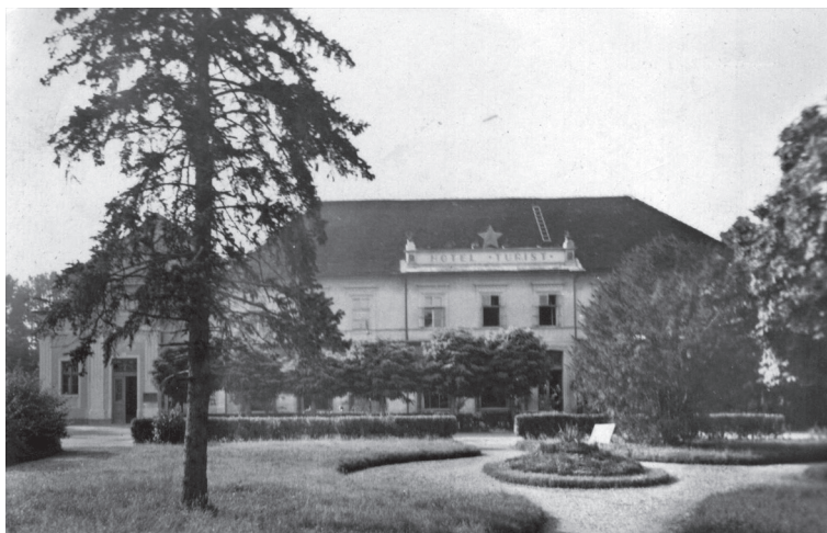
Hotel "Turist", razglednica, datirana približno u pedeset šestu godinu prema godini putovanja

odredio niz globalnih i lokalnih temporalnih označitelja, konteksta koji su uzrokovali temporalne sive zone u kojima se sjećanje intenzivno prefigurira: poput raskola sa staljinizmom i emancipacije Jugoslavije, nacionalnih pokreta sedamdesetih, ekonomske krize osamdesetih i Titove smrti; sve su potencijalne ključne točke za razumijevanje simboličkog "govora" socijalizma koje su se mogle pratiti u društvenom prostoru kakav je grad i njegov simbolički spomenički kapital. S druge strane bilo je teško zahvatiti pravi trenutak simboličke tranzicije koji bi opravdao postsocijalističko određenje ovoga rada iako se činilo da je lokalno ponovo ključan baš rat koji čini jasnu razdjelnicu, tj. prekretnicu ne samo u političkom i pravno pozitivnom smislu sa socijalizmom, već i u emocionalnom smislu kao samonametnuta opća simbolička točka s koje nema povratka. I dok je s jedne strane našim interlokutorima rat bio glavni razlog resimbolizacije socijalističkih vrijednosti prostora/mjesta, drugima je socijalizam metonimija antifašizma, a rat devedesetih nije predstavljao valjan motiv za simboličku anatemu socijalizma.