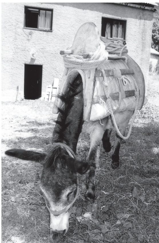
Sl. 2. Magarac sa samarom, vlasnik Milan Tomljanović Kanada, Žuljevići, snimio Augustin Perić 2003. godine.

a koje bi turisti mogli razgledavati. Spominje se u predaji i grčki bunar (kod Klaričevca), za koji se tvrdi da je i za vrijeme najveće suše u njemu bilo vode, te Alijin bunar na mjestu kojega je Alija, turski vojskovođa, po predaji, slomio nogu. Putove do tih bunara trebalo bi prokrčiti i osposobiti za turističke obilaske, a predaje vezane uz njih turistima bi sigurno bile zanimljive. U ranijim su razdobljima ovi izvori bili jedina vodoopskrbna mjesta od kojih se voda vozila i na udaljenosti veće od 20 km. Kako je velika udaljenost od izvora otežavala život i rad, Bunjevci su kroz povijest koristili prirodne osobitosti terena i izrađivali različite