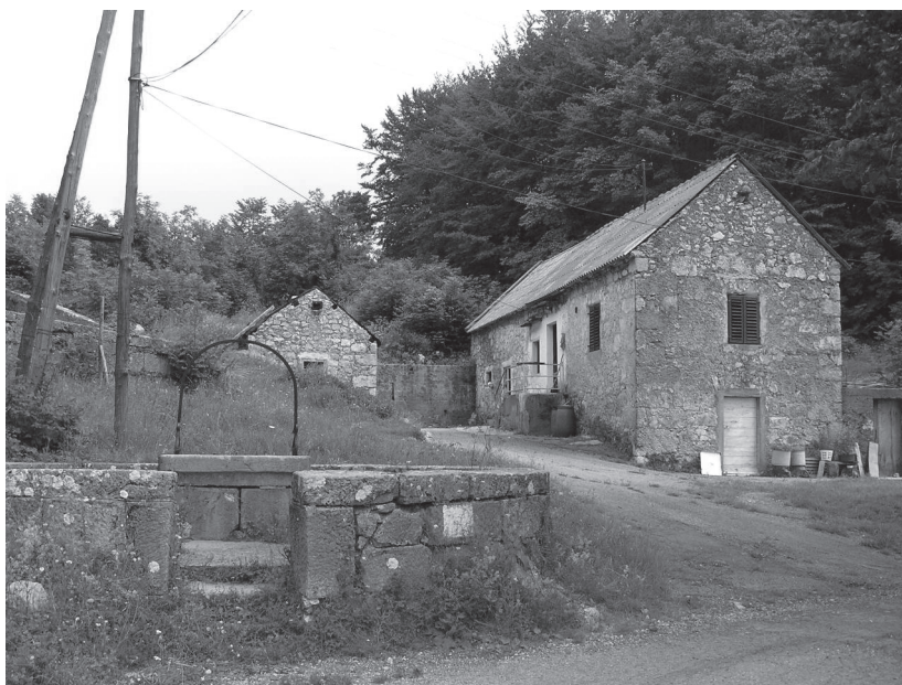
Sl. 1. Kuća sa šternom, Veljun, snimila Marijeta Rajković 2006. godine.

Autorica članka uočila je očuvanost tradicijskog graditeljstva koje se, u pozitivnom smislu, značajno razlikuje u odnosu na priobalni prostor. Budući da je po struci etnologinja zaposlena pri Konzervatorskom odjelu u Rijeci, u njezinu su radu dane smjernice i modaliteti zaštite te upozorenje na moguće posljedice nekontroliranih sanacija i rekonstrukcija: