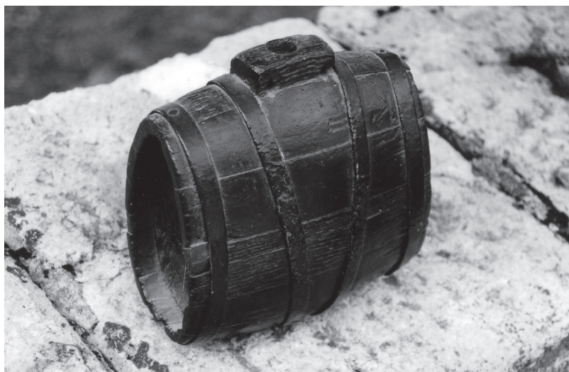
Sl. 3. Barilac, vlasnik Milan Tomljanović Ivić, Cupiči, snimio Augustin Perić 2003. godine.

Za transport vode i pri obavljanju poslova u polju i šumi koristile su se drvene posude – bačve , barilci , burila (burla) i žbanjice – koje bi se u manjim dimenzijama mogle izraditi kao suveniri s praktičnom primjenom, na primjer za čuvanje hrane u kućanstvu (tekućina, začina). Ujedno bi se na taj način pridonijelo revitalizaciji obrtništva. Također, moglo bi se upriličiti demonstriranje obrade drveta da bi se turisti upoznali s načinom izrade tih predmeta, ali i u obliku radionica u kojima bi mogli aktivno sudjelovati. 12