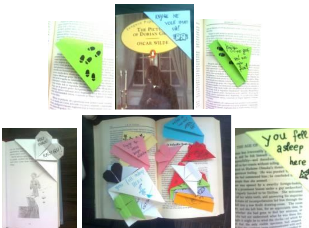
Slika 2. Primjeri straničnika prilagođenih mladenačkoj dobi 7