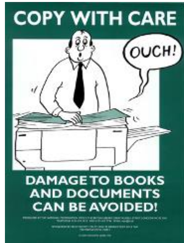
Slika 6. Primjer promidžbenog letka s informacijama o štetnosti nepravilnog fotokopiranja 11