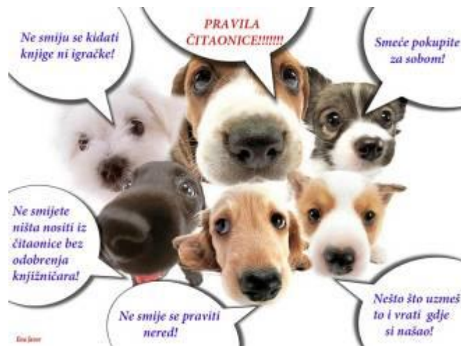
Slika 5. Primjer uputa za čitaonicu prilagođenih dječjoj dobi 10