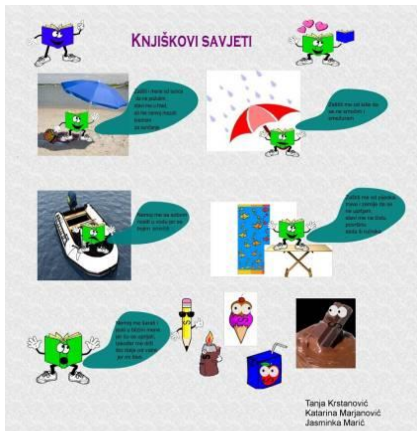
Slika 7. Primjer promidžbenog postera ili letka prilagođenog edukaciji pred ljetni godišnji odmor 14

dosega vode i direktnog sunčevog svjetla te da je ne drže na tlu i drugim mjestima gdje se može mehanički oštetiti (npr. slika 7).