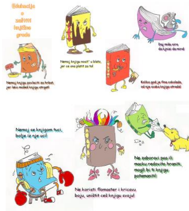
Slika 4. Primjer promidžbenog letka prilagođenog dječjoj dobi 9