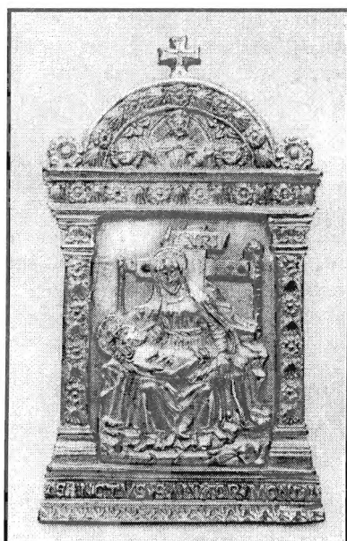
Slika 7. Pax iz zbirke samostana Male braće u Dubrovniku, XV. st.