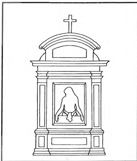
Slika 1. Pax u obliku pločice složena oplošja - tip B