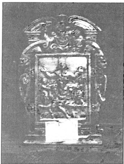
Slika 5. Pax iz župne zbirke Lopud, venecijanski broncista s kraja XVI. st.