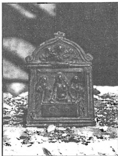
Slika 4. Pax iz crkve Gospe od Brda u Koritima na otoku Mljetu, XVI. st. domaći kipar