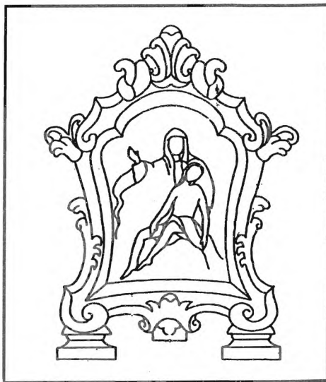
Slika 2. Pax u obliku arhitektonski uobličene pločice - tip A