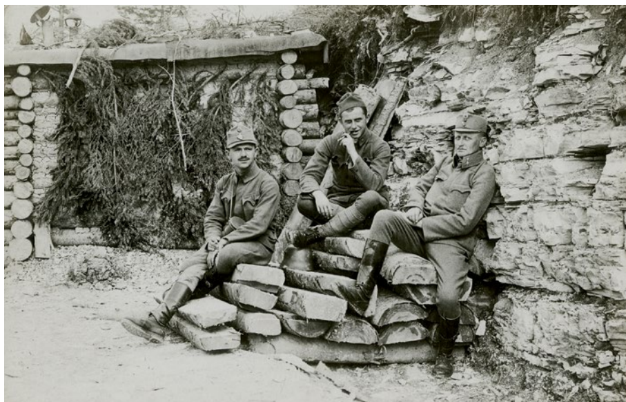
SI. 7. U trenucima odmora. Klučka (prvi s desna) sa »sudrugovima«. Istočno bojište (s.a.) [HR-HDA-1426. ZF PSR, inv. br. 2436]

toga ratovala između Dnjestra i Pruta, gdje je u listopadu uspjela zaustaviti ruski prodor između sela Toporivci i Onut. 54