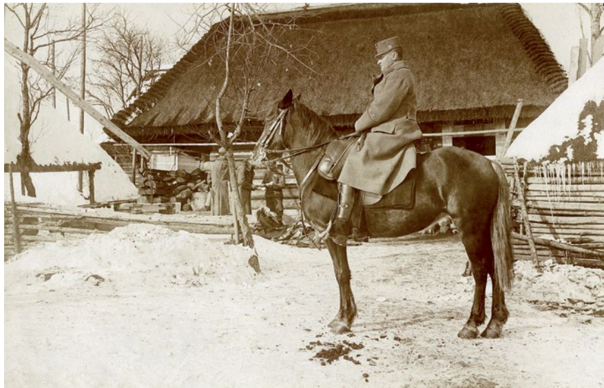
Sl. 3. Konjanik Klučka. Istočno bojište, vjerojatno početak 1917. [HR-HDA-1426. ZF PSR, inv. br. 3294]