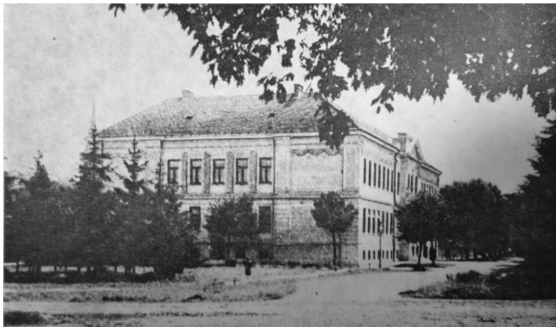
Sl. 9. Koprivnička gimnazija u međuratnom razdoblju. [FELETAR, Dragutin, »Prilozi za povijest koprivničke gimnazije od 1906. do 1945. godine.« Podravski zbornik 5 (1979), str. 84]

za Koprivnicu. 79 Udruženim se intelektualnim i građanskim snagama pridružilo i gradsko zastupstvo koje je na izvanrednoj skupštini jednoglasno zaključilo da se predsjedniku vlade Velji Vukićeviću i ministru prosvjete Kostu Kumanudiju uputi poslanstvo sa zadatkom promjene odluke o ukidanju viših gimnazijskih razreda, a vijećnici su se protestnim brzojavom obratili izravno i kralju, prosvjedujući protiv odluke koja je u pitanje dovela značajan dio srednjoškolskoga obrazovanja u Podravini uopće. 80 Deputacija na čelu s vladinim povjerenikom za Koprivnicu uspjela je u naumu. Razredna odjeljenja nisu dokinuta, a gimnazija je nastavila s radom u dotadašnjem okviru.