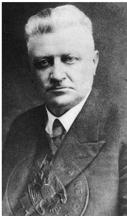
Sl. 14. Klučka u vrijeme upravljanja Koprivnicom. [KRUŠELJ, Željko, U žrvnju državnog terora i ustaškog terorizma . Koprivnica: Naklada dr. Feletar, 2001., str. 179]

Na sljedećoj sjednici gradskoga zastupstva održanoj početkom studenoga 1938., dakle punu godinu nakon što je to gradonačelnik bio obećao, nakon burne je rasprava ipak izglasan gradski proračun. Pritom su dva zastupnika napustila vijećnicu ne slažući se s gradonačelnikom i načinom vođenja grada, a pritom se dogodio pobježe nepoznati »sabljažnjivi incidens« među zastupnicima, nezapamćen u prošlosti koprivničkih gradskih vijeća. Ono što je u konačnici bilo najvažnije jest to da su vlasti manjak u blagajni planirale namaknuti »gradskim nametom od sto posto na izravni državni porez« te prodajom