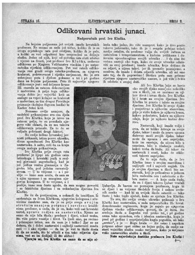
Sl. 8. Odlikovani hrvatski junak. [Ilustrovani list (Zagreb), 1918., br. 2, 12. siječnja 1918., str. 18.]