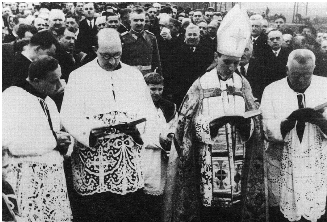
Sl. 15. Blagoslov dionice željezničke pruge Varaždin – Koprivnica, prosinac 1937. Gradonačelnik Klučka u pozadini, desno od vrha Stepinčeve mitre. [KRUŠELJ, Željko, U žrvnju državnog terora i ustaškog terorizma . Koprivnica: Naklada dr. Feletar, 2001., str. 181]

gradske zgrade u kojoj se nalazilo sresko načelništvo procijenjene na 1, 2 milijuna dinara, a koju je obećala kupiti Kr. banska uprava. 127