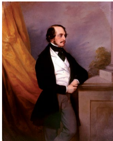
Sl. 2 Josef Kriehuber, Juraj VI. Drašković, oko 1850. (1851.) godine, ulje na dasci, 49 x 38 cm, Muzej za umjetnost i obrt, sig. 1.d. »Kriehuber«