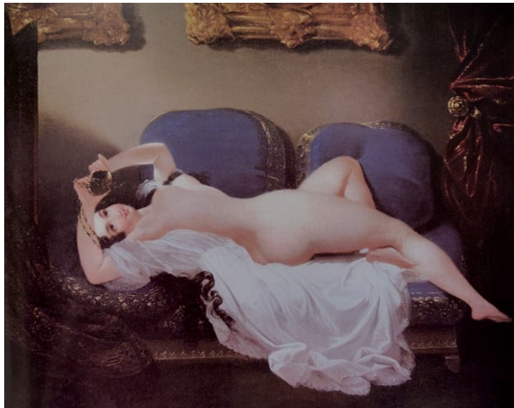
SI 3. Mihael Stroy, Europa, 1836. godine, ulje na platnu, 79 x 116 cm, Dvor Trakošćan, inv. br. DT 1016

Trakošćanski je dvorac, baš kao i Franzensburg, stilskim restauriranjem integrirao antikvitete, inventar i umjetnička djela, preuzeta iz Klenovnika. Oslikane tapete s motivom smotre postrojbe , naslikane za Klenovnik između 1775. i 1760. godine i Tapete s prizorima života običnih građana , nastale u drugoj polovini 18. stoljeća prekrejone su, preslikane te preselejene u Trakošćan. Translatirane su i slike, poput Malog rodoslovlja iz 1775. godine te Četrdesetak portreta časnika (portreti nastali između 1755. i 1760. godine). Unatoč činjenici što su spomenute umjetnine premještene prije promjene vlasništva nad Klenovnikom, inicijativu je moguće sagledati kao translaciju