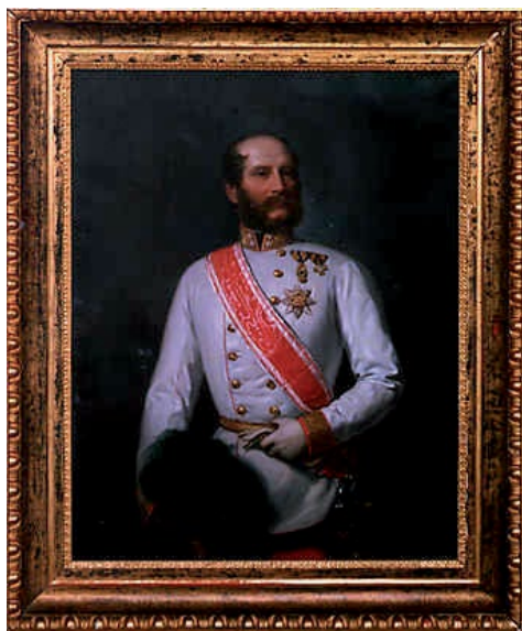
Sl. 1 August Prinzhofer, Juraj VI. Drašković, Graz, 1864. godine, ulje na platnu, 135,5 x 96, 5 cm, Muzej Dvor Trakošćan, inv. br. DT 77

Franje Josipa I. (1830. - 1916.) u samodopadnoj pozi poluprofila i časničkoj odori (sl. br. 1). Kao carev sljedbenik nosi, tada popularne, zaliske. Carev su stil, među ostalima, oponašali i njegov tast, maršal Theodor Baillet-Latour (1780. - 1848), kao i nasljednik, Ivan IX Drašković (1844. - 1910.). Osim konzervativnih portreta, postoje djela koja svjedoče o Jurjevom poznavanju građanskih strujanja. Bidermajersko djelo vrhunskog bečkog portretiste Josefa Kriehubera (sl. br. 2), u srazu je s kičenom odjećom carskog oficira. Slika predstavlja Jurja u mondenoj, jednostavnoj odijevnoj kombinaciji. Bidermajerski način odjevanja, bez pretjeranih ukrasa, slijedila je i njegova žena, Sofija. Sofijin portret, bečkog slikara Johanna Hermanna iz 1844. godine prikazuje damu odjevenu u pojednostavljenu ugarsku velikašku haljinu zagašitih boja.