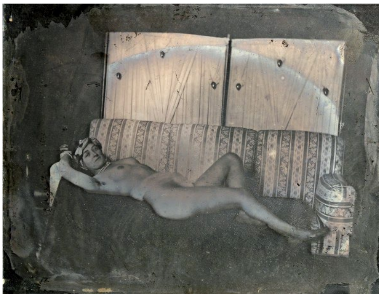
SI. 4 Juraj VI. Drašković, Jurimirska frajla, 1865. godine, ambrotipija, 13.3 x 17 cm, Muzej za umjetnost i obrt, Zagreb, inv. br. MUO - 014258

godine, Pongratz napominje kako bi grof tijekom svog boravka u Gasteinu, obzirom da poznaje inspektora iz Laxenburga, mogao njega zamoliti za projekt te prema tome organizirati gradnju dvorca u Trakošćanu. Misli li se u pismu na laxenburškog dvorskog kapetana, arhitekta Michaela Riedla, ne može se točno ustvrditi. Kako su grof i njegov upravitelj znali o kome je riječ, u pismima Reddi(?) nije posebno tituliran. Poznanstvo Jurja VI. Draškovića i inspektora iz Laxenburga moguće je. Moglo bi se temeljiti na Riedlovoj dužnosti dvorskog kapetana, vezano uz pravilo stare heraldičke prakse. Naime, dužnost dvorskog kapetana, između ostalog, bila je kontrola