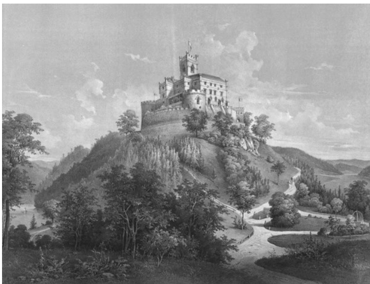
Sl. 5 Ludwig Czerny, pogled na dvor Trakošćan; tisak: Rieffenstein & Rösh, u Albertini datirana oko 1850. godine (zbog prikaza terase treba je datirati u 1862. godinu), 48 x 62,4 cm, Wien: Albertina, Kartensammlung und Goblönmuseum, inv. br. KAR0511887

Kukuljević se u brojnim publikacijama pohvalno osvrće na trakošćansku obnovu. Unatoč sentimentalnoj vezi s Trakošćanom, pohvale prvog hrvatskog konzervatora potvrđuju da je obnova poštivala suvremena konzervatorsko-restauratorska načela. Povezivanje stilske restauracije s konzervatorski osvještenim konceptom, upućuje na činjenicu kako ovdje nije riječ o prepisivanju novonastalih trendova, već o ideji koja sudjeluje u njihovom formiranju.