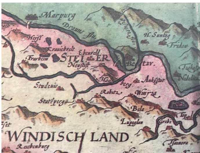
Sl. 1. Maribor i Ptuj na karti Cornelis de Jode 1593.

Maribor se kao gradsko naselje djelomično formirao i iz potrebe zemaljskih knezova za uspostavljanje konkurentskog grada u odnosu na Ptuj pa ne treba čuditi što su Habsburgovci Maribor obdaru nizom privilegija, među koje su spadali monopol vinskom trgovine s Koruškom ili obveza pristajanja splavara u Mariboru gdje se nalazila mitnica. Maribor je sredinom 15. stoljeća po stupnju razvoja dostigao Ptuj, a nakon toga slijedilo razdoblje gospodarske krize, a tijekom cijelog 16. stoljeća je bio gospodarski slabiji od obližnjeg Ptuja. U smislu broja stanovnika zaostatak je bio gotovo neznan jer je Maribor s predgrađima sredinom 16. stoljeća imao oko 1000 stanovnika. 4