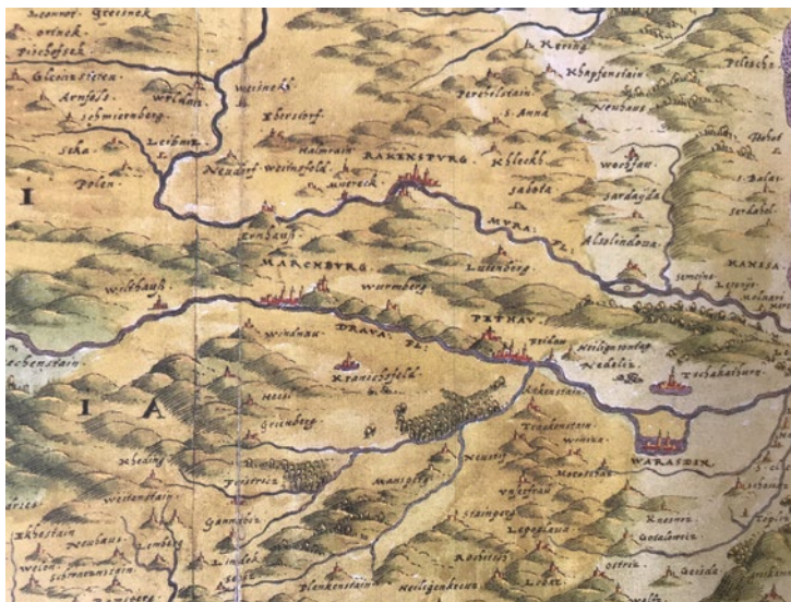
Sl. 3. Maribor, Ptuj i Ormož na karti Nicole Angelinija oko 1566.

Ptuj (Pettav) i Maribor (Marburg) 9 su ucrtani na karti »Ptolemaios geographia« Marcusa Beneventane iz 1507. odnosno 1508., tiskanoj u Rimu, ucrtan točno, na lijevoj obali Drave (Drava fl.), što pokazuje na točnije odnose u prostoru za razliku od prethodnih karata. Na toj se karti Zagreb spominje pod hrvatskim imenom Zagabria. Između Ptuj i ušća Drave je pri samom Dunavu ucrtano samo jedno naselje. Na istoj karti je Maribor upisan također na ispravnoj strani Drave, ali pod krivim imenom Naspurg. Uzvodno uz Muru (Mora fl.) je upisano naselje Leibnitz/Lipnica (Leibnicz). 10