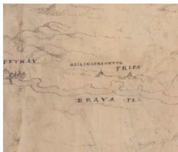
Sl. 7. Ptuj i Ormož na karti Natale Angelinija iz oko 1566.