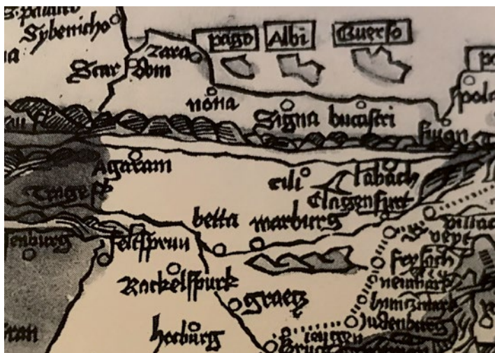
Sl. 5. Ptuj i Maribor na karti hodočasničkih putova za Rim, oko 1500.

Ptuj (Pettouia) i Maribor (Martenburg) na lijevoj obali Drave upisani su i na zemljovidu »Novo dissegno della Dalmatia et Croatia« koji je 1563. odnosno 1566. u Veneciji objavio Francesco Camo-