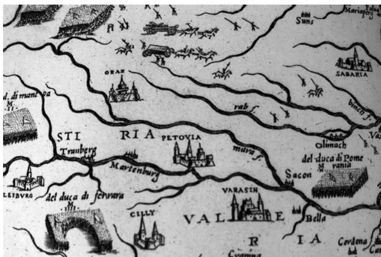
Sl. 4. Ptuj i Maribor na karti nepoznatog autora iz 1566.

Drave ucrtan je Borl (Anckesta-in). Koliko mi je poznato, na ovoj je karti zabilježen trenutno najstariji kartografski spomen Ormoža koji je upisan slovenskim i njemačkim imenima – Ormos i Fridaw. 18 Inačicu ove karte je načinio Andrea Vavassore, a ona je otisnuta u Veneciji 1553. 19 Na karti Johannes Hontera 20 od svih slovenskih gradova jedino je označen Ptuj (Peta), doduše na netočnoj lokaciji južno od Drave. 21 Postoji još jedna njegova inačica te karte tiskana u Zürichu 1546. na kojoj je Ptuj označen na isti način. 22 Vavassore je na ucrtao Ptuj (Petouia) i na prvoj tiska-