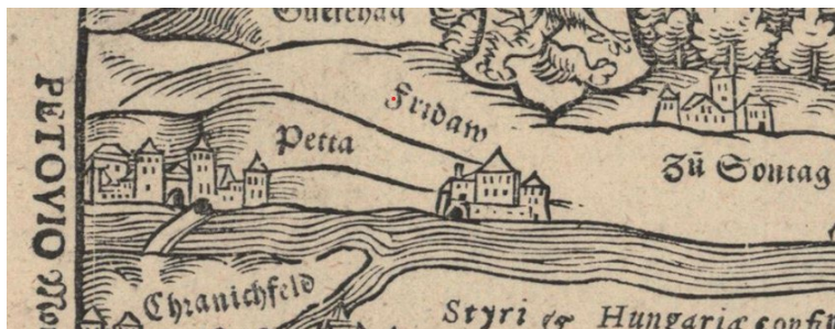
Sl. 8. Ptuj i Ormož na karti Wolfganga Laziusa iz 1556,

jatnije mogu i različito datirati. Na zemljovidu iz Dresdena stanje je više-manje identično kao i na bečkom primjerku 57 , a na karti koja se čuva u Karlsruheu nema ucrtanog Borla. 58