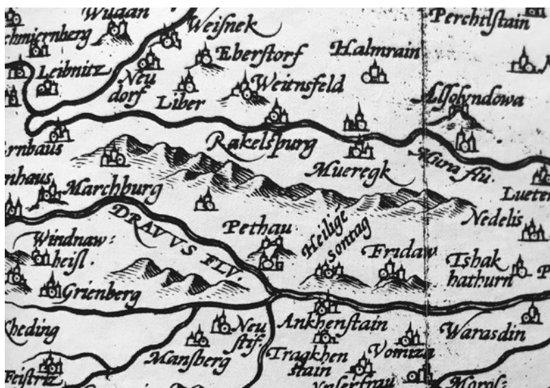
SI. 2. Maribor, Ptuj i Ormož na karti Ilirika Johannes Sambucus (iz Ortelijeva atlasa 1573.)

Ormož je sredinom 16. stoljeća imao manje od 200 stanovnika te je bio najmanji štajerski grad na rijeci Dravi. Tijekom 16. stoljeća zemaljski gospodari su bili pripadnici obitelji Sekelj (Szekely, Zekel) s kojom su stanovnici Ormoža vodili uspješnu borbu za očuvanje gradske samouprave. 5