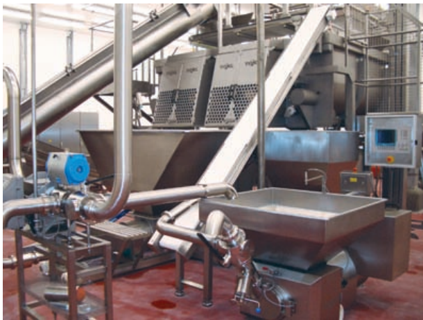
▲ INOTEC proizvodna linija s postupkom vraćanja u mješalicu zbog dodavanja začina

INOTEC je pravi partner kada je u pitanju proizvodnja proizvoda od fine mesne smjese (miješanje, fino usitnjavanje, emulgiranje). Također i u području pakovanja Inotec je zastupljen strojevima za razdvajanje lančanih kobasičarskih proizvoda, skidanje klipsi i individualnim rješenjima za dopremu proizvoda do stroja za pakovanje.