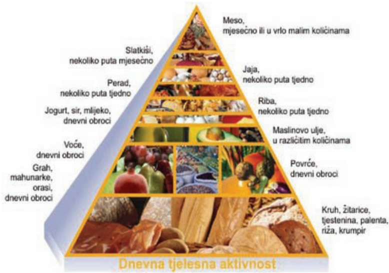
▼ Slika 1. Piramida namirnica mediteranske prehrane

of Tourist Destinations and Services, 2003; Maver i sur., 2001).