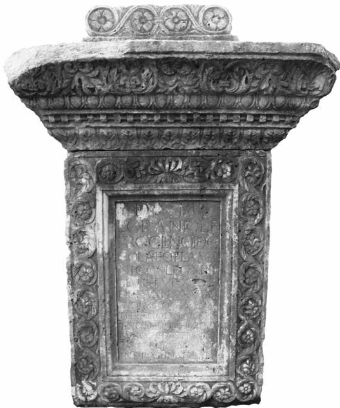
Nadgrobní žrtveník konzularskog beneficijarija Lucija Granija Proklina

Njihov broj nije bio fiksiran i vjerojatno nisu činili kolegij, a nakon službe mogli su postati provincijski flameni. 41 Predvodili su žrtve u čast diviniziranog cara i vjerojatno su bili odgovorni za provođenje žrtvenih prinosa i sponzoriranje društvenih događaja poput gozbi ( epulones ) kao sastavnog dijela takvih religijskih svečanosti. 42