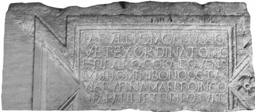
Sarkofag veterana Lucija Apuleja Montana

Aktivna služba pretorijanaca trajala je 16 godina 66 te su nakon časnog otpusta mogli postići prestižne municipalne službe u svojim rodnim gradovima. Veteran Pete kohorte Gaj Kom[---] Sekundo bio je dekurion i edil Minturne odakle je vjerojatno bio rodom, a Gaj Arije Klement je nakon sjajne karijere u pretorijancima postao duumvir i patron Matilike u Umbriji. 67 Ovi primjeri mogu poslužiti kao dodatan argument za pretpostavku o Severovoj službi u pretorijanskoj kohorti.