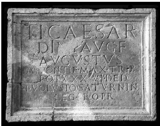
Natpis CIL III, 14322 (Arheološki muzej u Zadru)

Konstataciju da je epigrafska građa vrlo prvoga reda u rekonstrukciji povijesti nekoga naselja potvrđuju tri dokumentirana natpisa (dva sačuvana u cijelosti i jedan u pouzdanoj rekonstrukciji), koji svjedoče da je tijekom vladavine cara Tiberija, u doba namjesništva Lucija Voluzija Saturnina, Argyrumtum posjedovao glavne atribute grada. Prvi natpis, koji je pronađen godine 1895. na posjedu Ante Katalinića na Puntii, u restituciji glasi: