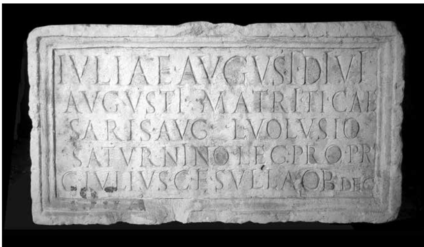
Natpis CIL III, 9972 (Arheološki muzej u Splitu)

ona također je i svojevrsna potvrda municipaliteta Argirunta postignutog tijekom vladavine Tiberija. I na ovom su natpisu imena i titula provincijskog namjesnika navedeni u ablativu, što znači da je Lucije Voluzije Saturnin ovdje također naveden kao eponimni magistrat za čijeg je namjesništva lokalni uglednik iskazao počast carici Liviji, 21 odnosno pogrešan je zaključak da je natpis »posvećen i legatu propretoru Volusiju Saturninu«. 22