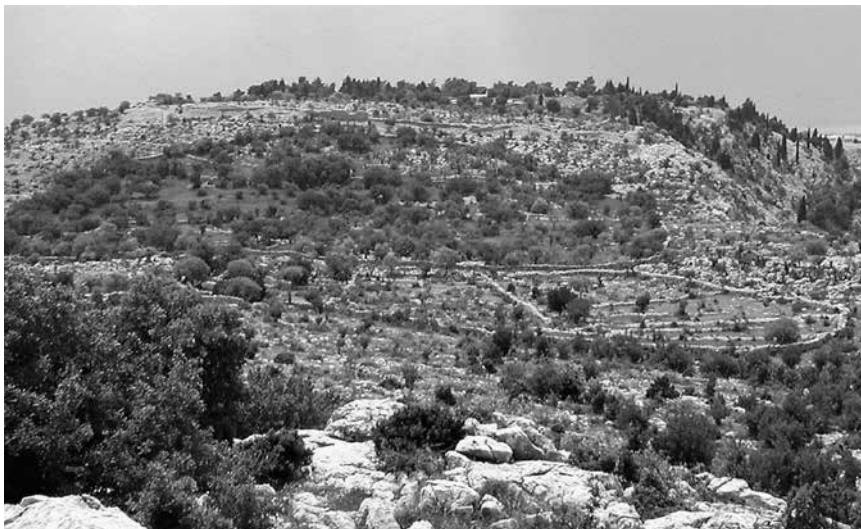
Pogled s Gradine na lokalitet Sv. Trojica i na sjeveroistočni potez bedema ranobizantske fortifikacije, 2002.

središte peregrinske civitas , tj. kod Plinija Starijeg navedeni oppidum Argyrun-tum . Obradom prikupljenih prostornih podataka određene su granice teritorija zajednice 3 čije stanovništvo tijekom antike gravitira novom urbanom središtu koje se početkom 1. st. po Kristu formira na položaju Punta u današnjem Starigradu Paklenici. Budući da rimskodobni grad nastaje na ravnom terenu uz obalu mora, njegova planska izgradnja obavljena je prema načelima rimskog urbanizma. Tijekom arheoloških istraživanja, koja je godine 1908. u Starigradu Paklenici proveo Austrijski arheološki institut pod vodstvom Mihovila Abramića i Antona Colnaga, određen je urbanistički izgled rimskodobnog Argirunta. Rezultati istraživanja objavljeni su 1909., 4 a na priloženom planu vidljiv je poluotočni smještaj grada i