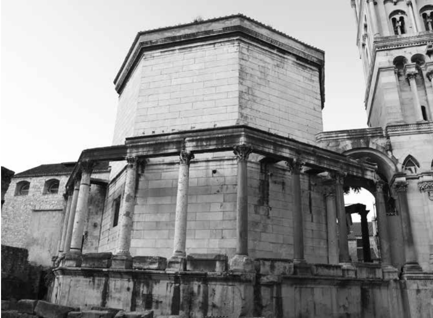
Mauzolej cara Dioklecijana u Splitu

maska božanstva – personifikacija vjetrova. 48 Također su na deset ploča izvedeni prikazi lova erota na divljač, te iznad zapadnih vrata prikazi erota u trkaćim dvokolicama. Riječ je o motivima koji su uobičajeni na nadgrobnim spomenicima pa, promatrajući friz u cjelini, možemo reći da su carski portreti imali također i sepulkralnu namjenu. U središnjem dijelu friza, koji danas nedostaje, 49 Duje Rendić-Miočević pretpostavio je prikaz apoteoze vladara. 50 N. Cambi smatra da je to i logično jer je pokojnik bio diviniziran, 51 te je reljef bio anticipacija prije stvarne careve smrti. Kako se palača nalazi na području Carstva kojim je upravljao njegov odani zet Galerije, i sam se car nadao svojoj božanskoj deifikaciji. Godine 316. 52 Dioklecijan je sahranjen u mauzoleju, vjerojatno u porfirnom sarkofagu 53