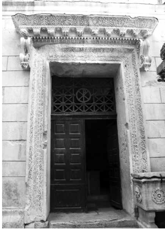
Mali prostilni hram Dioklecijanove palače

od konzola prepoznaje se i Heraklo, Jupiterov sin koji je bio božanski pokrovitelj tetrarhijskih vladara-cezara. Osim prikaza božanstva, hram je ukrašen i frizom s prikazima grifona sa strana kantara. Na podu su izvedeni jeleni koji love grifone. Motivi grifona upućuju na apolonsku i dionizijsku simboliku. 71 Kako se i na dovratnicima i nadvratnicima javlja dionizijska berba erota, te erot sa strane kantarosa, možemo reći da svi ovi motivi sepulkralna značenja imaju također jedan simbolični smisao. Time možemo zaključiti da svi izvedeni dekorativni motivi unutar i izvan hrama odražavaju religijski sadržaj tetrarhijske koncepcije koja se vratila štovanju starijih rimskih božanstva, te je hram vjerojatno imao panteistički karakter. Poznato je da je car Dioklecijan nastojao oživititi tradicionalnu rimsku religiju, u kojoj je najvažnije mjesto imao Jupiter kao vrhovno božanstvo tetrahije.