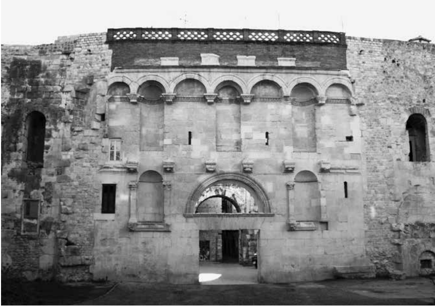
Sjeverna vrata Dioklecijanove palače u Splitu

luka sjevernih vrata prikazana su dva bića čovjekoliko-bikovskih karakteristika, koja su pripadala tradicionalnom elementu dekoracije gradskih vrata, foruma, a simbolizirala su sreću i blagostanje koje donosi sretno vladanje. 37