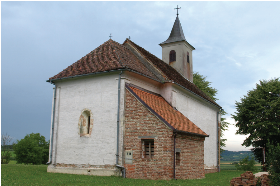
Sl. 2. Kapela sv. Petra, Novo Mesto Zelinsko, pogled sa sjeveroistoka