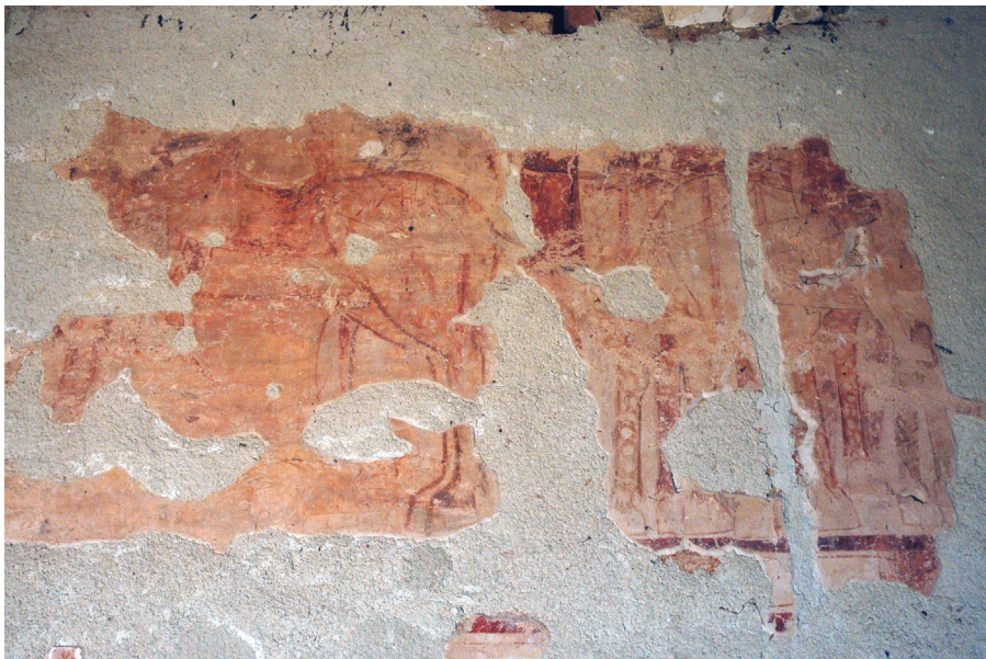
Sl. 3. Kapela sv. Petra, Novo Mesto Zelinsko, sjeverni zid broda, legenda o sv. Ladislavu, fragmenti Odlaska u bitku