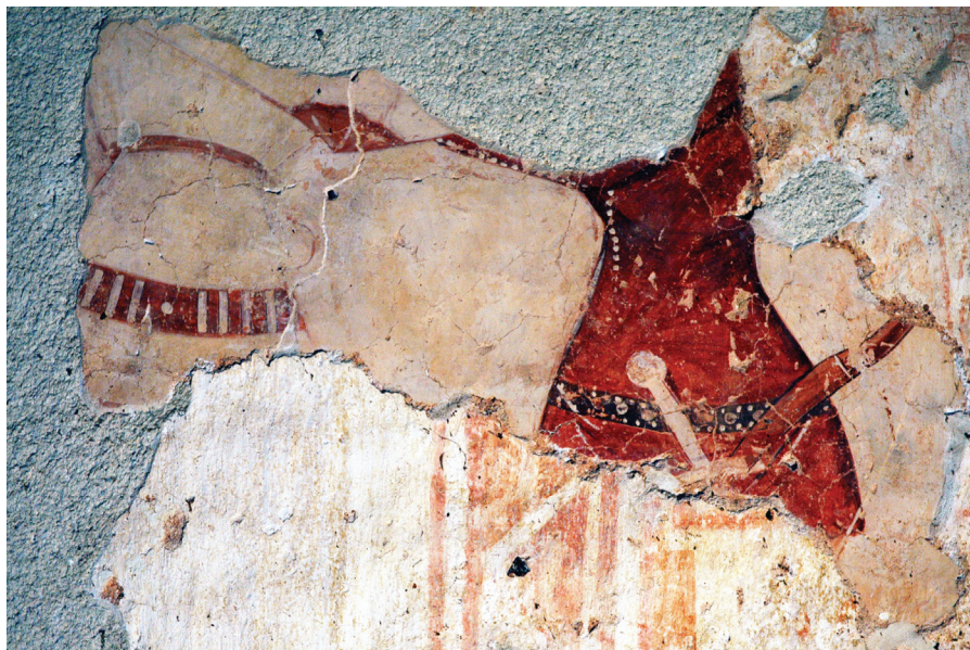
Sl. 6. Kapela sv. Petra, Novo Mesto Zelinsko, sjeverni zid broda, legenda o sv. Ladislavu, fragmenti Hrovanja