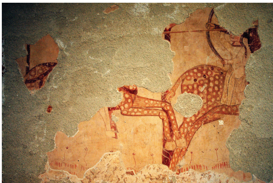
Sl. 5. Kapela sv. Petra, Novo Mesto Zelinsko, sjeverni zid broda, legenda o Sv. Ladislavu, fragmenti Potjere