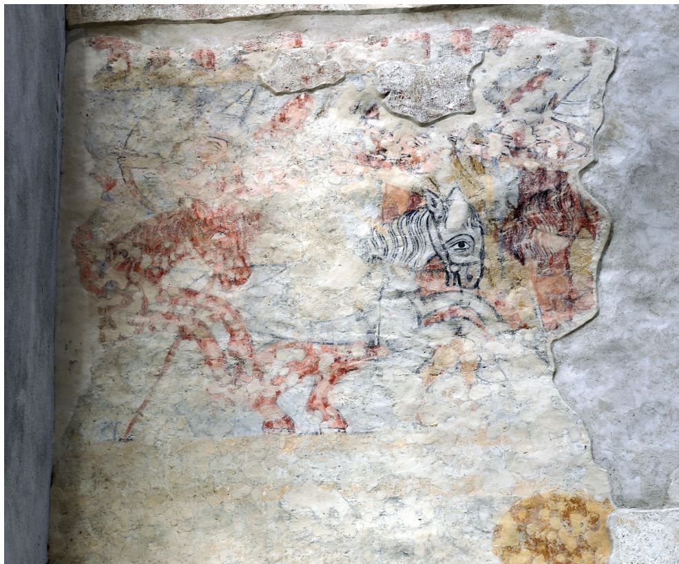
Sl. 10. Župna crkva sv. Augustina, Velika, južni zid izvornog broda gotičke kapele (današnje svetište), legenda o Sv. Ladislavu, fragmenti Bitke