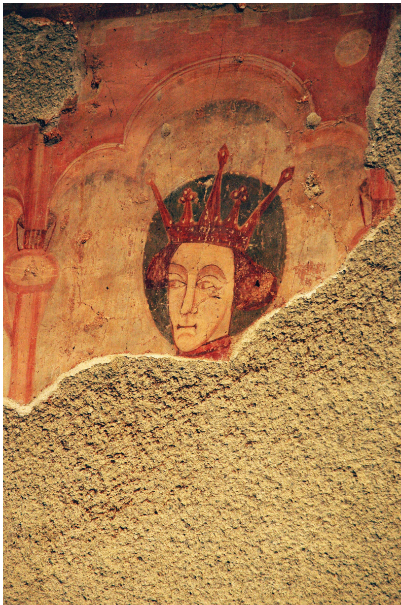
Sl. 7. Kapela sv. Petra, Novo Mesto Zelinsko, sjeverna strana trijumfalnog luka, fragmenti sv. Ladislava