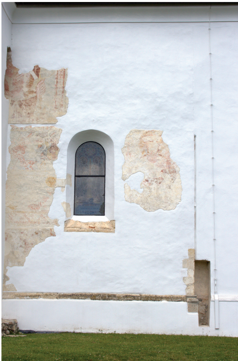
Sl. 9. Župna crkva sv. Augustina, Velika, južni zid izvornog broda gotičke kapele (današnje svetište), fragmenti zidnog oslika