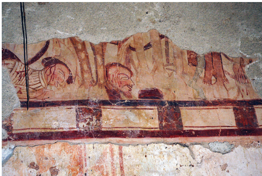
Sl. 4. Kapela sv. Petra, Novo Mesto Zelinsko, sjeverni zid broda, legenda o sv. Ladislavu, fragmenti Bitke