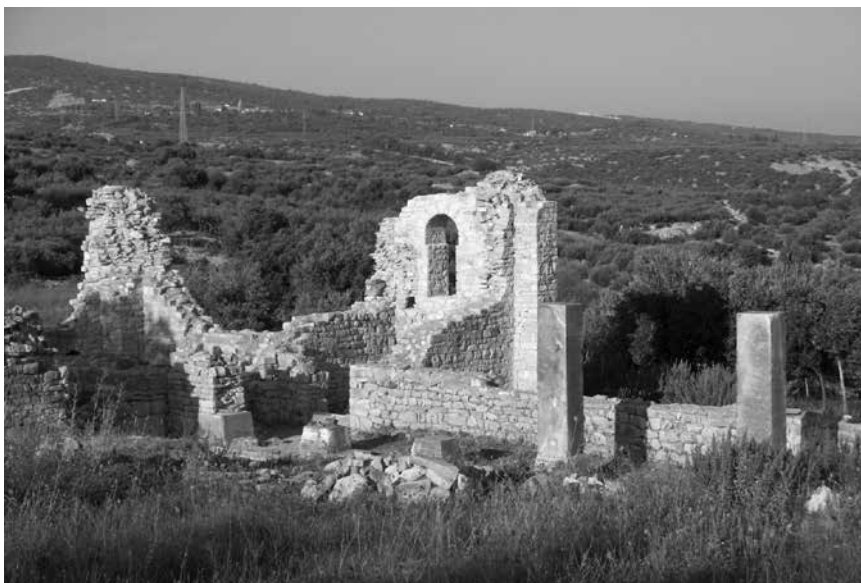
Pogled na jugozapadnu kulu s početkom trijema

vanjske isticale u rasteru kao ugaone kule. U unutrašnjosti širokih dvorana bio je malterni pod.