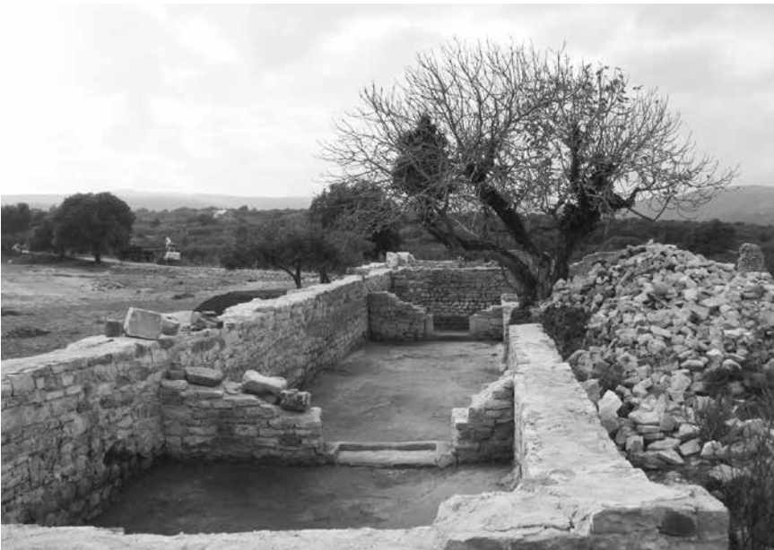
Dvorana flankirana manjim prostorijama na istočnom krilu sklopa