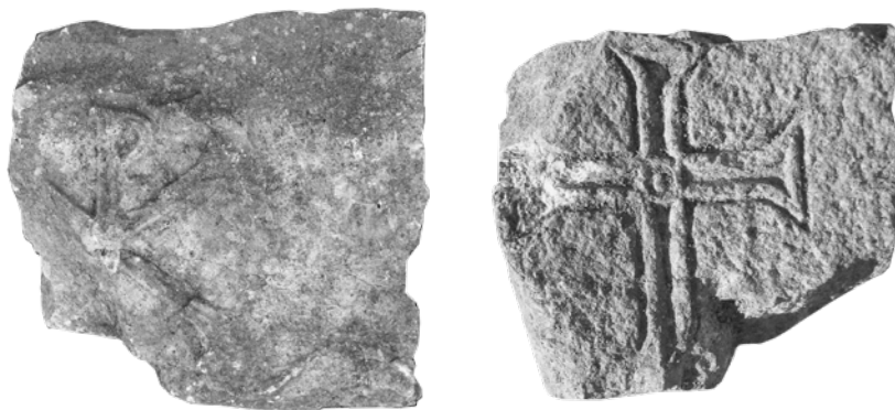
Nad vratnici s Kristovim monogramom i latinskim križem

Pluteji s Kristovim monogramom rasprostranjeni su od Konstantinopola do Ravenne i gornjeg Jadrana od druge pol. 5. do sredine 6. stoljeća, pretežno kao monogramatski križ sa šest ili osam krakova i srolikim poljima između krakova. 37 Na plutejima bračkih radionica 6. stoljeća umjesto lovorova vijenca-krune koristi se glatki medaljon u kojem je upisan križ, a na dnu se izdvajaju vrpce s hederom. Fragmenti pluteja s ostacima srolika lišća pronađeni su na Mirju, ali su cjeloviti primjerci uništeni prilikom sekundarnog priklesavanja ploča.