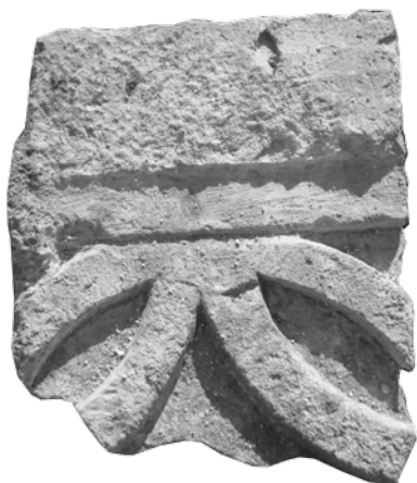
Dio pluteja s isprepletenim kružnicama