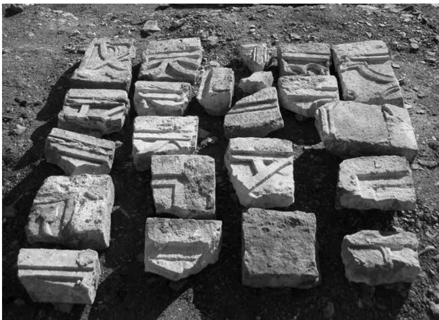
Mirje kod Postira, Priklesani ulomci pluteja

O dugom korištenju arhitekture na Mirju svjedoče manje pregradnje, posebno zid s ugrađenim dijelovima ranokršćanskih pluteja iznad malterne podnice veće građevine u središnjem dijelu. Križevi i dijelovi simboličkih prikaza nisu bili od značaja prigodom te rekonstrukcije već samo dimenzije kamenja i kvalitetna klesarska obrada njihovih rubova. Kada Mirje gubi samostanski karakter i zadržava samo povremenu gospodarsku ulogu, cisterne za vodu ostaju dragocjena sabirališta vode. U slojevima koji prate novovjeke pregradnje pronađeni su duboki tanjuri renesansne grafite iz prve pol. 16. st. iz Veneta ( graffita a fondo abassato ) te dijelovi vrčeva.