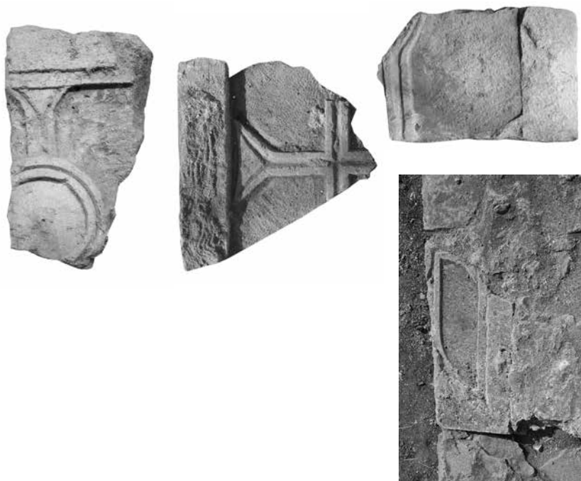
Ulomci pluteja s križevima

oblikovana je kao dvopruta traka, a simbolizira vijenac križa ( crux coronata ). Takvi pluteji bračke provenijencije pronađeni su u Srimi, a isti motiv krase čeonu stranu škripskih sarkofaga. 9