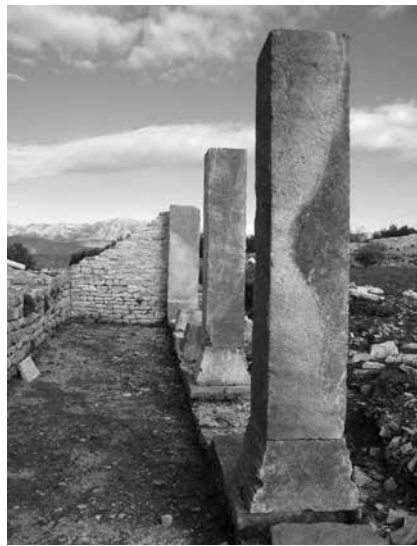
Dvorišni trijem uzduž zapadnog pročelja

se radilo o još jednoj cisterni jer je voda bila dragocjena za funkcioniranje ove male zajednice. Posljednja je u nizu veća prostorija koja je imala ulogu ugaone kule, a bila je povezana s dvoranom-hodnikom sličnog rastera kao na sjeveroistoku. Dva zida flankirala su središnji ulaz, a na njima su bili rasteretni lukovi kao i na zazidanom dijelu na uglu dvorišta i cisterne.