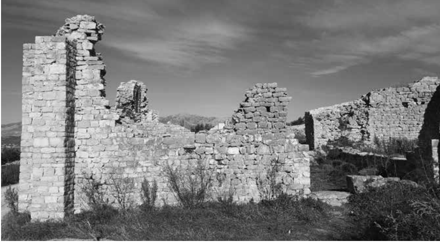
Glavni ulaz uz kulu na južnom pročelju