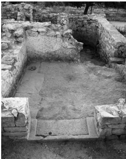
Pogled na termalni sklop na Mirju