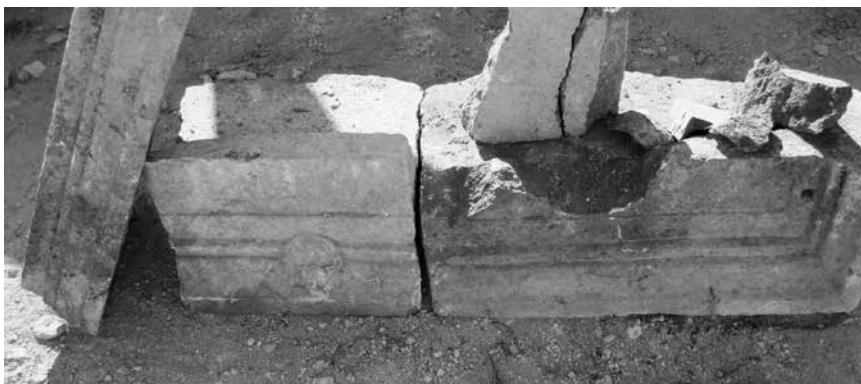
Profilirani nadvratnik s križem u medaljonu

Treći arhitrav pronađen na Mirju, s grčkim križem u medaljonu, obrušio se do vrata nad kojima je bio ugrađen. Križ je apliciran na profiliranoj simi nadvoja koji je bio razlomljen u više fragmenata i zajedno s elementima dovratnika pronađen pored ulaza u usku i široku prostoriju na sjeveroistoku Mirja koja je morala imati značajnu ulogu u okupljanju redovničke zajednice. Na vrhu haste je plitko povijena nožica slova P. Vrata su flankirana zidanim podestima s ulaznim trijemom i vodila su u prostoriju izduženu po poprečnoj osi, koja je vjerojatno bila u funkciji okupljanja zajednice za razmatranje i molitvu poput kapitularne dvorane u srednjovjekovnim samostanima. Sitni pokretni nalazi nisu doprinijeli razjašnjenju funkcije ove prostorije.