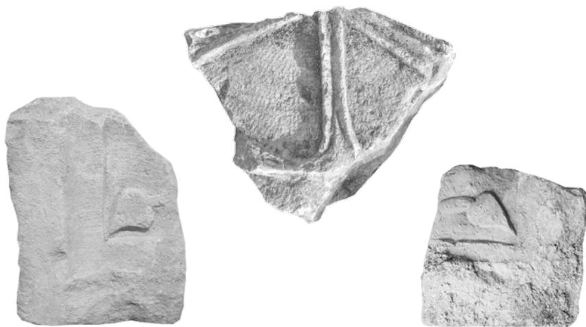
Fragmenti pluteja s Kristovim monogramom i hederom

Vrlo rijetki figuralni prikazi pripadaju isključivo ranijim nalazima što ih je objavio E. Marin. 11 Prikaz janjećih nogu s papcima fragmentarno je sačuvan, a vjerojatno se radi o dvije antitetične životinje pod križem što je kompozicija koja se javlja u zagorskom dijelu Dalmacije i na otocima. 12 Slične kompozicije na Braču ima zabat iz Splitske 13 i ranokršćanski sarkofag iz Škripa. 14