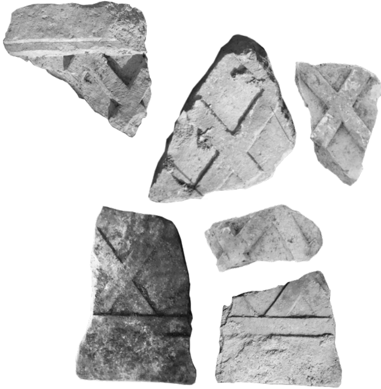
H. Plutej s motivom rešetke s rombičnim rasterom

Središnji dijelovi dvaju monumentalnih arhitrava s monogramom ⊗ i XP u reljefu otkriveni su na rubnom istočnom dijelu Mirja. Prvi fragment nadvratnika s Kristovim monogramom bio je neposredno uz vanjski zid cisterne na sredini istočnog perimetra sklopa. Iako oštećen, jasno je vidljivo da je Chrismon upisan u plitki medaljon, a krakovi križa prošireni na krajevima imaju račvasto urezanu prugu. Završetak slova P ima nožicu stiliziranog S-oblika. Na desnoj strani ispod medaljona sačuvana je valovita vrpca koja je vjerojatno završavala listićem hedere koja izlazi iz križa ili podanka medaljona. Slična je kompozicija na nadvratniku iz bazilike Urbane u Saloni, ali je umjesto Kristograma jaganjac okrunjen svetokrugom s križem što je simbolički prikaz Krista. 32