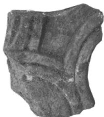
Pluteji s motivom ljuski