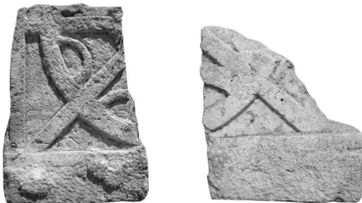
Fragmenti pluteja s motivom »dna košare«

plutejima ravenatskih radionica. 20 Na lokalitetima u ozračju Salone pojavljuje se u reljefu i kao prošupljena ploča (Kapljuč, Marusinac, Episkopalni centar, Povlja, Lovrečina, Stari Grad, Srima, Gata, Potravlje, Kijevo, Žažvić, Bilice, Galovac). Na Mirju je pronađen i ulomak središnjeg dijela pluteja sa složenijom mrežom isprepletenih traka.