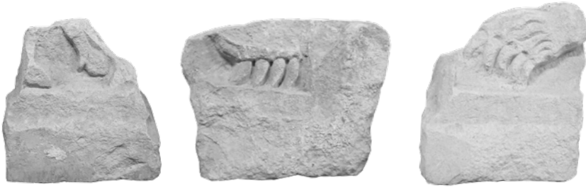
Ulomci pluteja sa životinjskim nogama i šapama