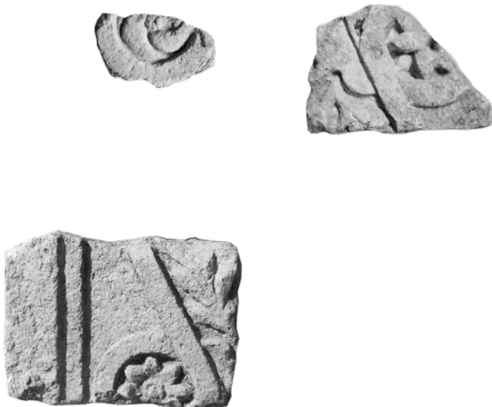
Plutej sa središnjim rombom i ugaonim kružnicama s rozetama

storu, na sarkofazima, zidnim mozaicima i posebno na novcu gdje se pojavljuje okrunjen vijencem lovora. 33