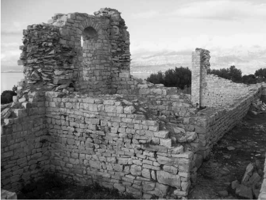
Zapadna strana s istaknutim ugaonim kulama