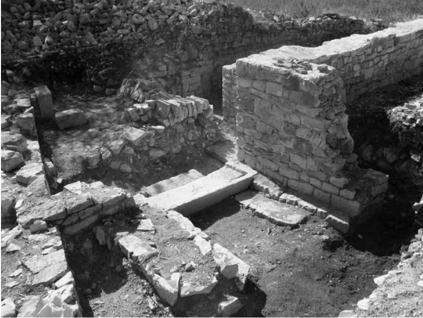
Sjeverni ulaz u samostanski sklop s urušenim lukovima