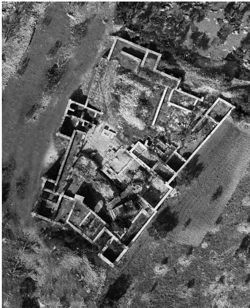
Fotogrametrijski 3D snimak lokaliteta na Mirju

najveći broj fragmenata pluteja i dijelova oltarne pregrade koja se datira u 6. st. Proporcije ove građevine (6:15,7 m) odgovaraju proporcijama jednobrodne crkve u Lovrečini kod Postira (6,7:17,6 m), koja je uz baziliku u Postirama, u susjedstvu kasnoantičkog sklopa podignutog na Mirju. Motivi i klesarska obrada pluteja pripadaju istom vremenu i kulturnom krugu, posebno križevi, motivi ljuski, kose rešetke i Korboden motiv. Iako dosadašnja istraživanja nisu potvrdila da se radi o crkvi, središnji položaj ove građevine i gustoća nalaza kamenog namještaja ukazuju upravo na njenu sakralnu namjenu.