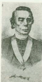
Ilija Okrugić-Srijemac (1827—1897)

Obitelj Ilije Okrugića potječe iz srijemskog sela Morovića. Ilija je rođen 12. svibnja 1827. u Srijemskim Karlovcima. Ime je dobio po ocu Iliji, gradskom činovniku i vijećniku. Osnovnu školu i gimnaziju završio je u rodnom mjestu, a zatim se upisuje u đakovačko biskupsko sjemenište, gdje 1850. završava bogosloviju kao prvi ređenik biskupa Josipa Jurja Strossmayera.