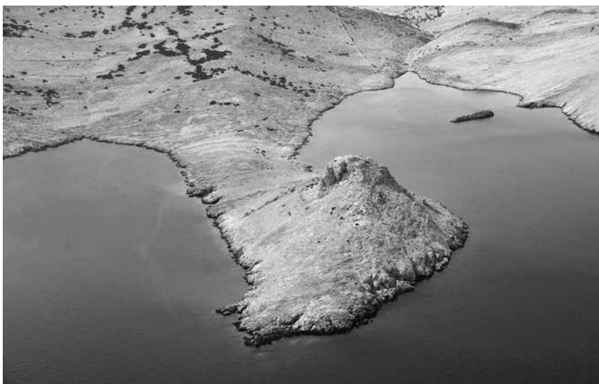
Zračni snimak utvrda Sutojanj na otoku Pagu. Pogled sa sjevera na položaj utvrde

visoko sofisticiranog sustava zaštite pomorskih interesa Bizanta tijekom prvog doba njegove talasokracije Jadranom.