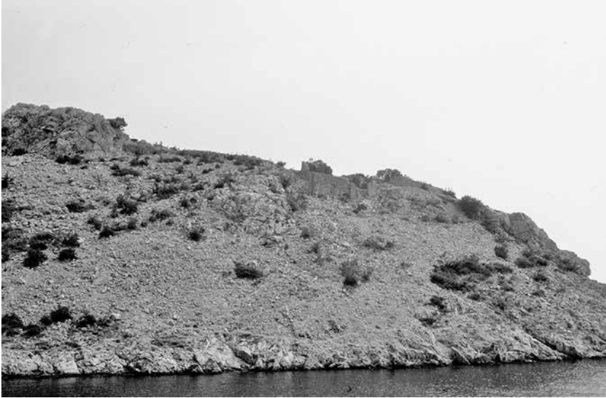
Pogled sa zapada na utvrdu Gradina na Donjoj Prizni, 1989.

Kamena litica na kojoj je smještena utvrda osobito se lijepo prepoznaje s morske strane prigodom plovidbe Velebitskim kanalom, kao i sa sjeverne obale otoka Paga, gdje se nasuprot Gradini kod Donje Prizne vidi također kasnoantička utvrda u uvali Sutojašnica. Utvrda iznad Donje Prizne u cijelosti je obuhvatila poluotočić, a njegove, uglavnom prepoznatljive ostatke zidina može se slijediti u čitavom perimetru koji obuhvaća najistaknutije točke poluotoka. Ponegdje, kao na zapadnoj strani, odakle je bio jedini mogući pristup iz zaštićene uvale pogodne i za sidrenje plovila, izdižu se iz krševita terena dijelovi jednog dobro očuvanog objekta, vrlo vjerojatno masivne udvojene kule ojačane snažnim kontraforima.