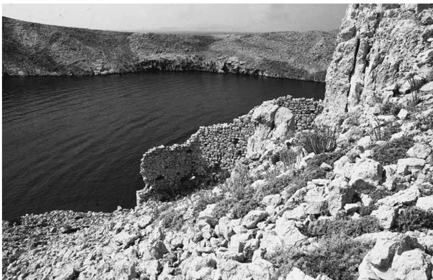
Pogled na zapadnu kulu utvrde Sutojanj , 1990.