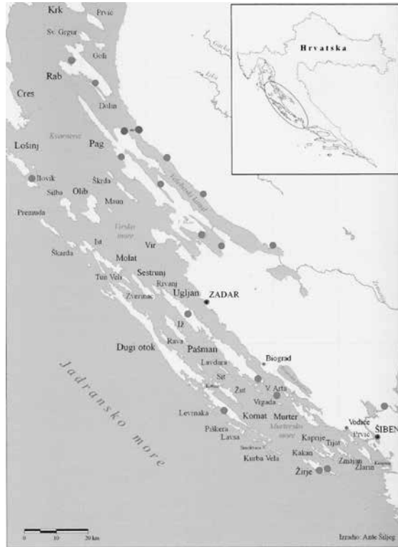
Karta zapadnog dijela Velebitskog kanala s položajem Gradine u Donjoj Prizni i Sutojanja na otoku Pagu (prema Faričić 2012).