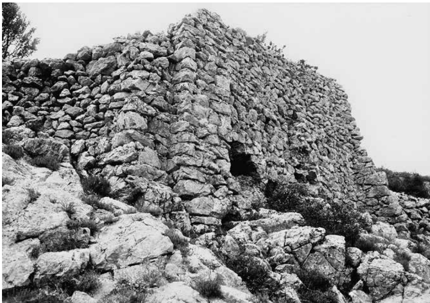
Pogled sa zapada na ostatke kule s kontraforima iznad Donje Prizme, 1989.