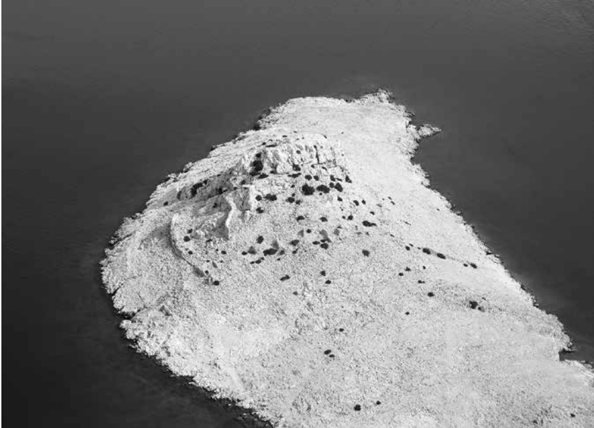
Zračni snimak rta Sutojanj na otoku Pagu. Pogled s juga na položaj utvrde, 2006.