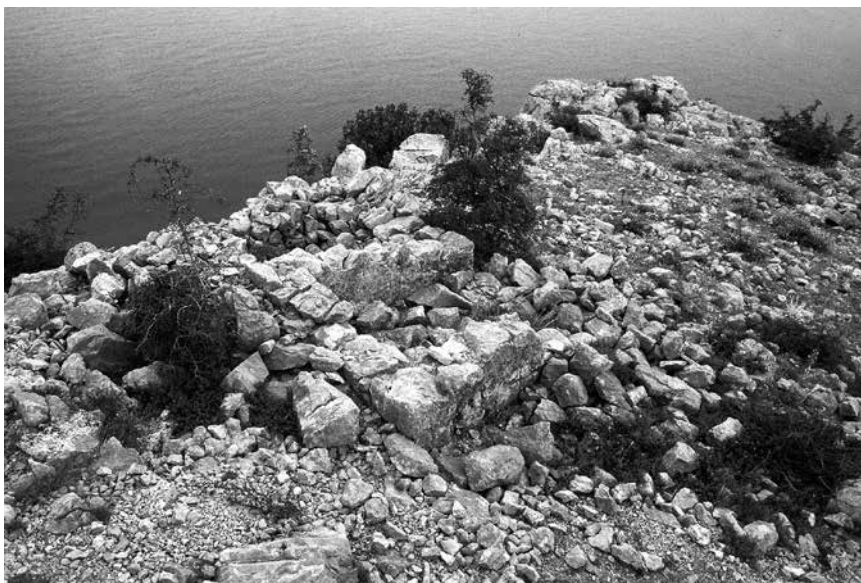
Mala zidana cisterna na Gradini Prizna, 1989.

nalazi se omanja zidana cisterna za vodu, kakve inače susrećemo na nizu primjera vojnog graditeljstva kasne antike duž Jadrana.