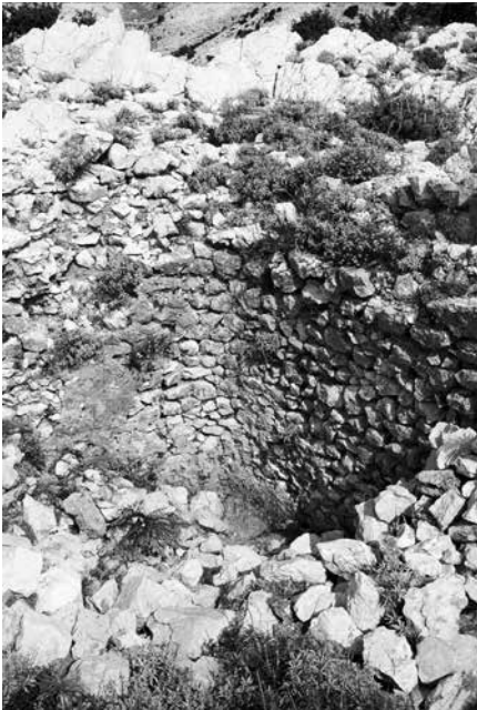
Pogled na veliku cisternu na južnoj padini Sutojanj , 1990.

Svi opisani detalji tvore vrlo kompaktan arhitektonski sklop iz kojeg s jugozapadne strane izbija uzani i vrlo strmi uklesani put do horizontalno otesane terase na vrhu litice. Tehnika zidanja, artikulacije tlocrta bedema, pa osobito kvadratnih kula i cisterne za vodu neposredno iza perimetra bedema, primjena obilate žbuke i upotreba masivnih kontrafora, uz odabir položaja utvrđenja, ali i sakralnog objekta, jasno upućuju na postojanje vrlo zanimljive kasnoantičke utvrde tj. kastrona iz doba rane vladavine Bizanta, sa relativno dostatnom stalnom vojnom posadom. Pretpostavljamo da je taj kastron mogao nastati samo nakon 537. godine, odnosno uspješnog okončanja Justinijanove rekonkviste tog dijela istočnog jadranskog priobalja, kao važan obrambeni element jednog