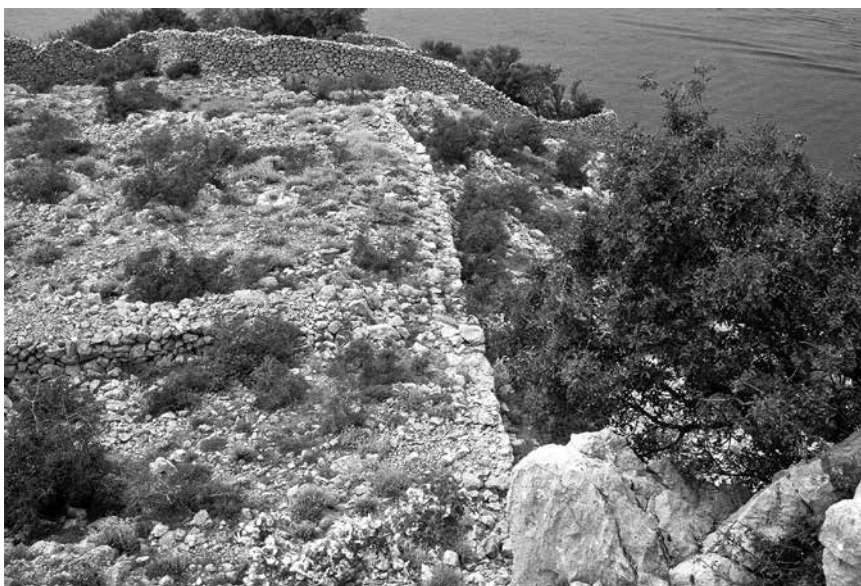
Pogled na ostatke većeg objekta unutar utvrde Prizna, 1989.