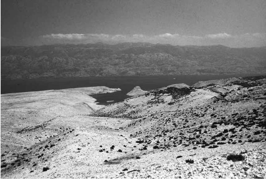
Pogled na kastron Sutojanj s juga, 1990.

Pagu s njegove sjeverne strane, odnosno u pravcu Paških vrata i kasnoantičkih naselja u toj zoni otoka Paga, kao što su to utvrda Sv. Juraj nad gradom Pagom, 34 Novalja 35 i Sv. Juraj u Caski. 36 Ujedno je utvrda na položaju Gradina kod Donje Prizne predstavljala i značajnu kariku u osiguranju talasokracije Bizanta u tom dijelu Tarsatičke Liburnije i plovidbe prema Senju. Sa te optimalne pozicije mogao se ujedno ostvariti i stalni nadzor pristupa otoku Rabu, odnosno i plovidba prema Novalji na Pagu.