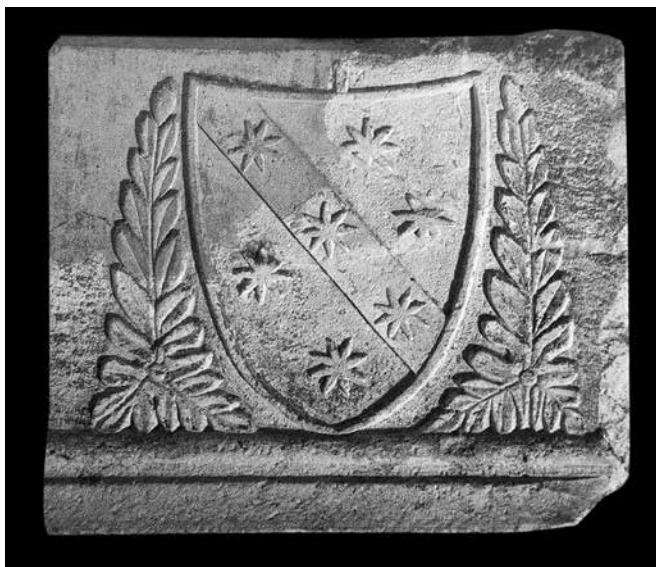
Grb splitskog nadbiskupa B. Zabarella sa stare Nadbiskupske palače (Muzej grada Splita)

o potrebama za liturgijskom opremom odnosno o građevinskim radovima koji su poduzeti u katedrali. Lako je moguće da je to bio zadarski nadbiskup Lorenzo Venier, koji je početkom 1427. godine bio kandidat mletačkoga Senata za splitskoga nadbiskupa. On je dobar dio 1436. godine proveo u Firenci i Bologni, o čemu svjedoče indulgencije koje je zatražio i dobio za sebe, svoju obitelj i prijatelje, te osobito dvije vezane za zadarsku katedralu čija je građevinska struktura zahtijevala znatne popravke, za koje, međutim, njena operarija nije mogla osigurati dovoljna sredstva. 127