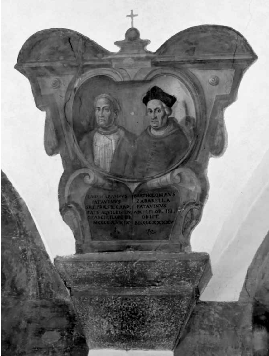
Zidni oslik s portretima nadbiskupa: Ludovico Trevisan Scarampi (1435. – 1439.) i Bartolomeo Zabarella (1439. – 1445.), Nadbiskupska palača u Firenci

arhiprezbiter crkve sv. Stjepana u Veroni i podđakon Apostolske Stolice. Svoje je obveze prema Komori počeo izvršavati istoga dana, 113 a novu je uplatu ostvario