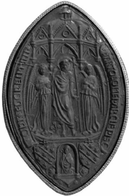
Pečat B. Zabarelle kao nadbiskupa Firence (od 18. prosinca 1439. do smrti 1445. g.), British Museum, London

i 30. siječnja sljedeće godine. 114 Poput svoga prethodnika, i on je obećao uplatu pristojbi u iznosu od 200 zlatnih florena u dva šestomjesečna obroka. 115