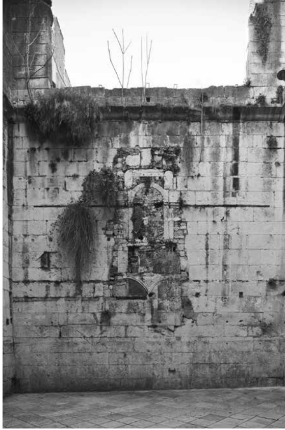
Sjeverni zid propugnakula zapadnih vrata Dioklecijanove palače, stanje prije radova 2014.

prostoru zapadnih vrata bila srednjovjekovna sudnica, točnije da su s kamenih tribina vođeni sporovi, izricane presude, sklapani ugovori i izdavane isprave. Na unutrašnjim zidovima propugnakula još uvijek su vidljivi tragovi kamenih stepenica koje su najvjerojatnije srušena u 17. stoljeću. 2 Nakon uklanjanja stepenica, u istom prostoru grade se prvi dućani koji su purificirani sredinom 20. stoljeća. Tragovi gradnje danas se vide na južnom i sjevernom zidu propugnakula, a postoji pozamašna arhivska i fotodokumentacija koja prikazuje izgled tadašnjih dućana. 3