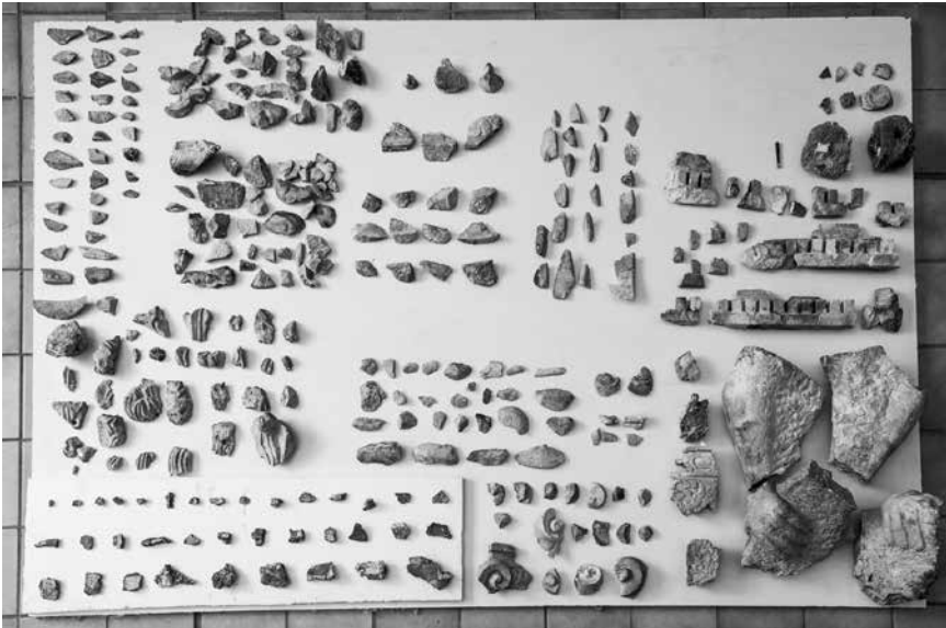
Arheološki ulomci pronađeni u zapuni niše

Ulomci kamena sačuvani su u dosta različitih veličina te ih je bilo moguće grupirati po oblicima i motivima. Na prilično velikom broju ulomaka evidentirani su ostaci polikromije (crvena i crna) i pozlate. Najveći i najbolje sačuvani su ulomci skulpture s prikazom ruku i podlaktica koje drže nekakav predmet, a riječ je o ukupno 7 ulomaka. Zatim slijede dva kamena fragmenta s prikazom jednostavno modeliranih očiju – dimenzije oba ulomka su cca 6 x 6 cm. Više od 23 ulomka pripada arhitektonskoj profilaciji s motivom denta. Nadalje, tu su dva ulomka kapitela, te nekoliko ulomaka različitih voluta. Evidentiran je iznimno velik broj ulomaka s motivom raznih vitica, zavijutaka i lišća. Više ulomaka moglo je pripadati polukružnom okviru niše, a tu je i niz različito profiliranih i fino obrađenih i djelomično polikromiranih ulomaka čiji izvorni izgled zbog fragmentiranosti nije moguće definirati.