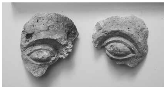
Kameni ulomci s prikazom očiju

Nakon čišćenja, konzervacije i sistematizacije ulomaka, pristupilo se njihovom spajanju i lijepljenju. Svi ulomci skulpture s prikazom podlaktica i šaka zalijepljeni su u jednu integralnu cjelinu. Kada su spojeni, postalo je jasno da je riječ o dijelu samostalne skulpture dimenzija 43 x 46 x 43 cm. Također, utvrđeno je da se arhitektonski ulomci s motivom denta spajaju u veću cjelinu, te je pojedine ulomke bilo moguće međusobno zalijepiti. Ostale ulomke ni nakon višemjesečnog rada nije bilo moguće spojiti u veću logičnu cjelinu.