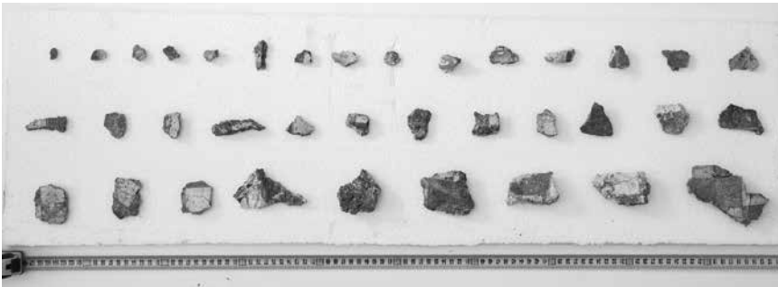
Ulomci fresko slikarstva

O izvornom izgledu, funkciji i dataciji niše na sjevernom zidu propugnakula