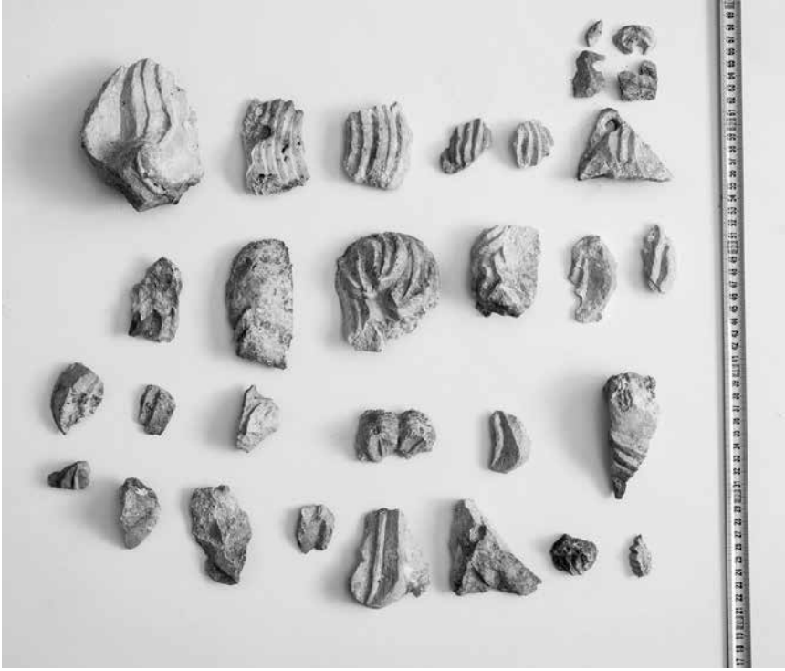
Kameni ulomci s motivom raznih vitica i listića