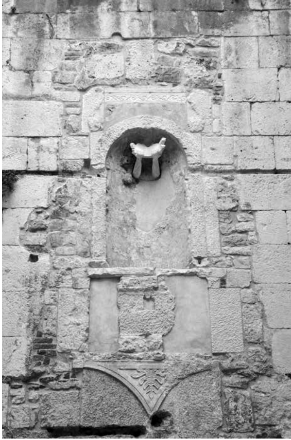
Skulptura s motivom ruku nakon montaže na izvornu poziciju 2018.

predmet u niši nije isključivo trebao biti kameni reljef ili skulptura. Moguće je da je na tom mjestu bio izložen drveni kip ili slika. Ulomci s prikazom očiju, u tom slučaju, mogu biti dekorativni dio okvira niše. 26