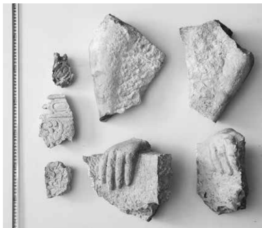
Ulomci kamene skulpture