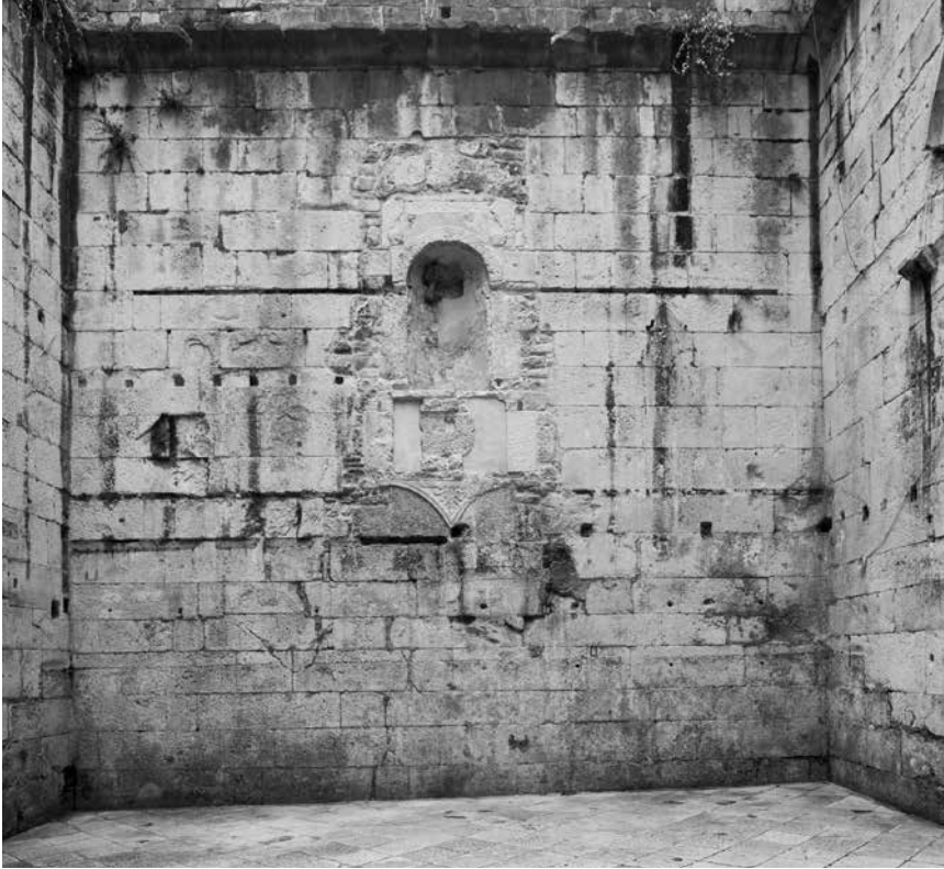
Sjeverni zid propugnakula zapadnih vrata Dioklecijanove palače, stanje nakon konzervatorsko-restauratorskih radova na niši 2017.

njovjekovne niše zapunjen je ciglama i klesancima nepravilnog oblika i veličine. Otvor niše zatečen je zapunjen mortom, ciglama i klesancima, a u takvom stanju niša je pronađena 1948. godine prilikom raščišćavanja zgrada u propugnakulu. 10 Svi elementi čeonih ploha okvira grubo su preklesani, a dekorativni reljefi tek se nagoviještaju pod bočnim svjetlom. 11 Izuzetak su tri sačuvana elementa na kojima se jasno vide motivi vijugave lozice, smokvinog lista i križa. 12 Većina korištenih elemenata u sekundarnoj je upotrebi (spoliji). Na temelju svih dekorativnih elemenata i njihovih vidljivih ostataka, Katja Marasović je 2014. godine predložila idealnu rekonstrukciju niše. 13