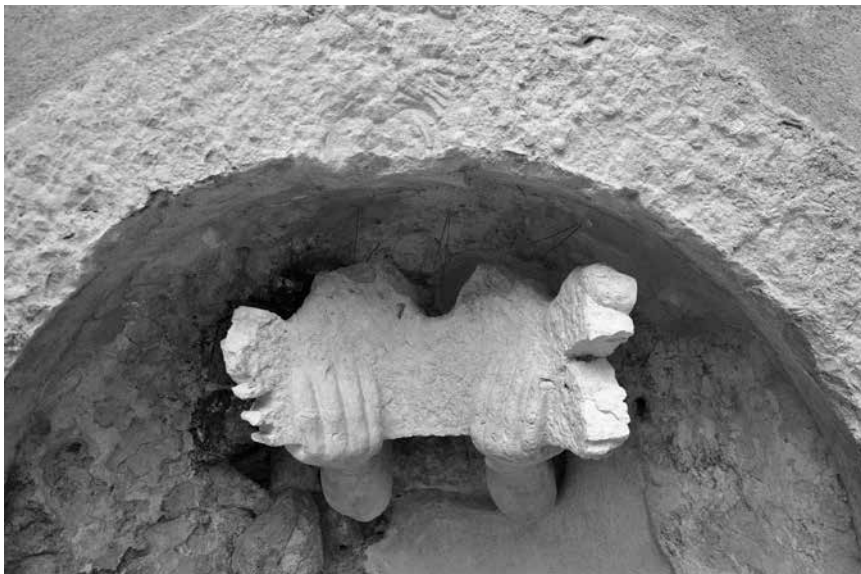
Skulptura s motivom ruku, detalj

Među mnogobrojnim kamenim fragmentima pronađenima u zapuni, samo dva ulomka upućuju na postojanje skulpture s figuralnim prikazom. Riječ je o ulomcima jednostavno oblikovanih očiju bez zjenica. Oči su naravne veličine, što ukazuje na postojanje skulpture ili dijela skulpture s ljudskim likom u prirodnoj veličini. Međutim, među ostalim ulomcima nisu pronađene ni najmanje naznake kamene plastike koja bi mogla pripadati ostatku pune skulpture (npr. uši, obrazi, usta, vrat, tijelo ili ekstremiteti). Točnije, preostali su ulomci isključivo geometrijskog oblika, te kao takvi mogu biti dio okvira, postamenta ili oltara, ali ne i skulpture s figuralnim prikazom.