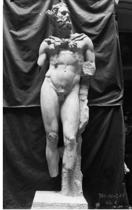
Kip Marsije, oko 1900.