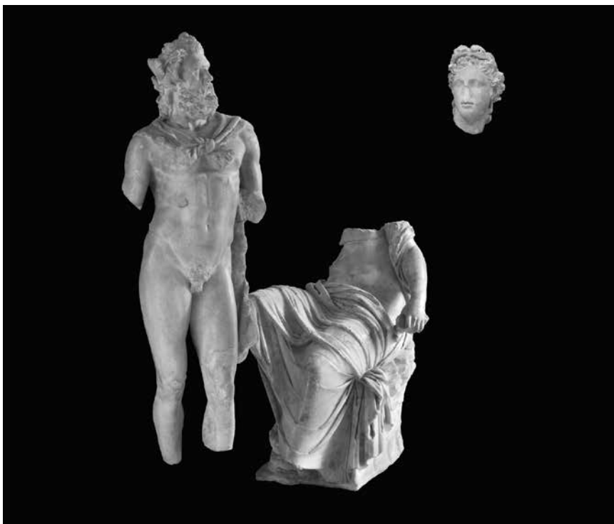
Rekonstrukcija Marsijine skupine kipova

armonioso e naturale movimento la Vittoria gli ponesse sul capo la corona ; ma di questa statua nulla ci è pervenuto. 21