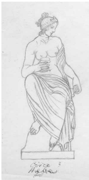
Kip Muze s dodacima G. Paronuzzija, crtež M. Sabljara (Arhiv AMZ)

der untere Theil des Tronks und die quadratförmige Basis. Das Glied ist gebrochen. Eine entfernte Aehnlichkeit dieser Statue mit der borghesischen Gruppe des Silenos, welcher den kleinen Dionysos in den Händen wiegt, hat den Ergänzter Paronucci veranlasst, das Kind, von dem trotz seiner Versicherung 10 keine Spuren erhalten sein konnten, in ihre Arme zu legen. Dieser Ergänzung widerspricht vor allem die Wendung des aufblickenden Hauptes nach rechts. Auch lehnt der Silen sich nur leise an den Baumstamm an seiner rechten Seite, steht fast völlig gerade auf dem r. Beine und stellt das vorgesetzte l. nicht wie die borghesische Figur auf den äusseren Fussrand, sondern tritt mit der ganzen Sohle auf. Von derselben unterscheidet er sich ferner durch den Fichtenkranz auf dem Haupte und durch das vorne auf der Brust geknüppte Thierfell, welches im Rücken herabhängt und unter der linken Achsel vorgezogen über den im rechten Winkel erhobenen linken Vorderarm herabfällt. In allen diesen Einzelheiten gleicht er indess völlig einer in der Campagna gefundenen, jetzt in Holkham Hall aufbewahrten Statue (Specimens of ant. sculpt. II 27 = Clarac 724, 1680 E), die sich ebenso sehr durch die