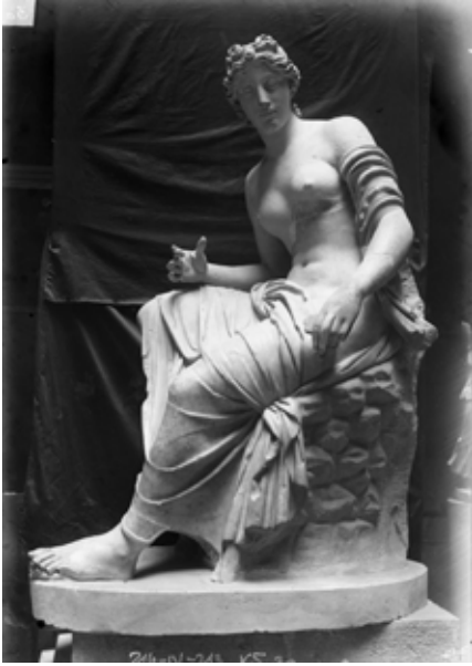
Kip Muze, oko 1900.