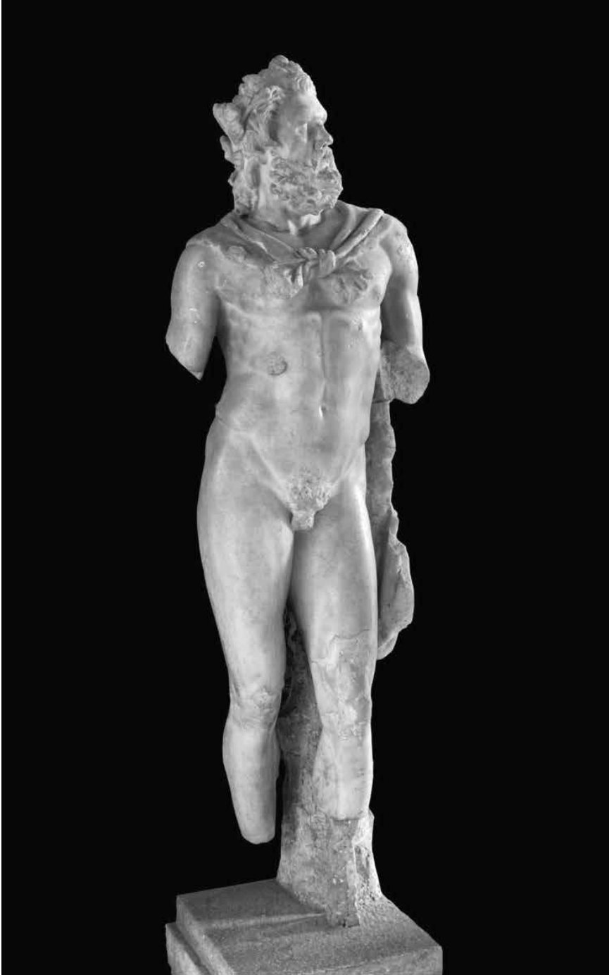
Marsijin kip, Arheološki muzej u Zagrebu