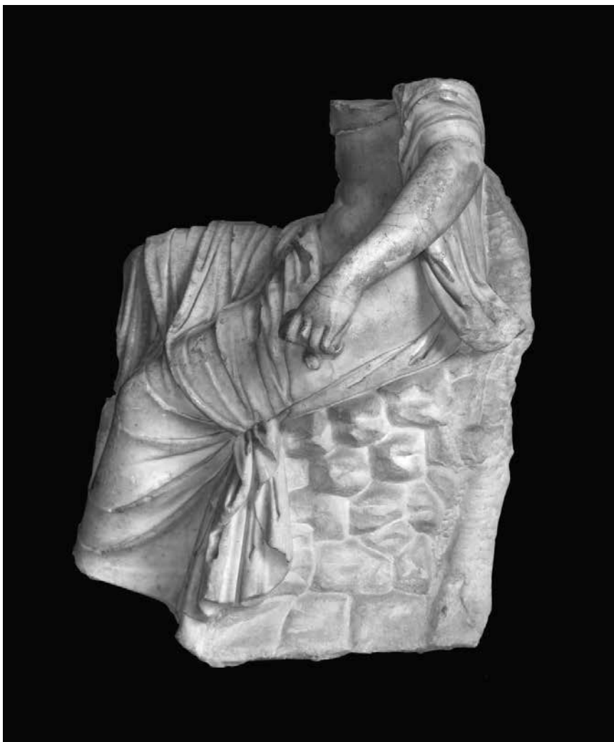
Kip muze Kaliope, desni bočni pogled, Arheološki muzej u Zagrebu

Na isti popis dodaje i sjedeći kip Muze: / I kolossale Statue einer Frau, welche auf einem Scheiterhaufen als Brombeerstrauch sitzt, von griechischem Marmor 3' 5" Soll die Circe (griechisch Kirke) als eine griechische Prinzessin herstellen (vorstellen?).