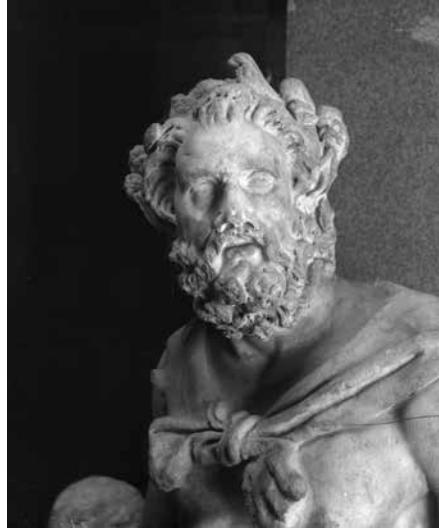
Glava Marsije, oko 1900.