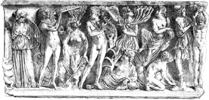
Sarkofag iz Dogana Pontificia del Chiarone (Toskana), danas u Louvreu (iz Daremberg-Saglio-Pottier IV, fig. 6138)

llona, ali je to ipak moguće. Kod jednoga kipa (br. 4) je mramor isti kao u Marsyje i Muze, dok se to za drugi (br. 5) ne može tako sigurno reći, ali je vjerojatno. 19