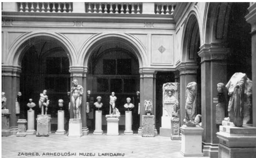
Unutrašnjost aule Akademičke palače s lapidarijem Arheološkog odjela Narodnog muzeja, snimili Griesbach i Knaus, oko 1925. (Fototeka AMZ)