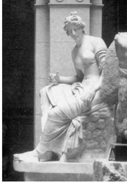
Kip Muze, snimio F. Mosinger 1. VI. 1900. (Fototeka AMZ)

dio stražnje sa pristajućim dijelovima pećine, na kojoj figura sjedi. Odomljeni su i opet prisastavljeni: donji komad lijeve sise; lijeva ruka počam od lakta na tri mjesta; puntello, na koji pristaje diptychon, na dva mjesta; komad baze lijevo sa dijelovima stopala lijeve noge. Otkrili se komadi plasta, prednji komad diptycha, gornji i donji dio stabla.