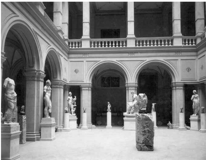
Unutrašnjost aule Akademičke palače s lapidarijem Arheološkog odjela Narodnog muzeja, oko 1900. (Fototeka AMZ)

Apollona i Marsyje, pa je pošlo K. Hadaczeu (Zu einer neuen Marsyasgruppe. Rom. Mitth. XVII, 1902, str. 173-178) za rukom ustanoviti, da sve te figure prikazuju jednu Muzu sudinju u tom natječaju i da je za neke reljefe na sarkofazima sa sličnim likovima izvjesno, da im je kao uzorak služila statuama grupa od više figura. Po diptychu, koji se je jedino kod zagrebačkoga kipa sačuvao, moglo se ustanoviti, da je ta Muza Kalliope, a i inače taj primjerak ima nešto, što se samo još na spomenutom sarkofagu opetuje, naime jedno stablo iza kamena, na kojem Muza sjedi. Nešto se čudno dojmlje, da je jedna od Muza prikazana sa nagim gornjim tijelom i odjevena samo himatijem, dok ih inače obično nalazimo sasma odjevene, ali takovih iznimaka imade (sr: Hadaczek n. m) i inače, a mislim, da će se dosele poznatim moći dodati i jedna druga figura iz palatinskoga stadija u Rimu (Gatti, n. d., str. 77—78), koja će prikazivati drugu sjedeću Muzu iz iste grupe.