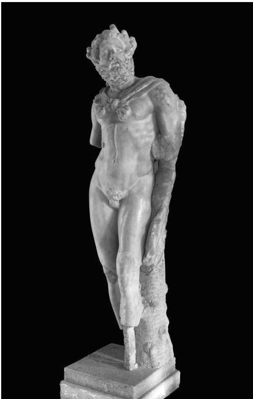
Marsijin kip, Arheološki muzej u Zagrebu