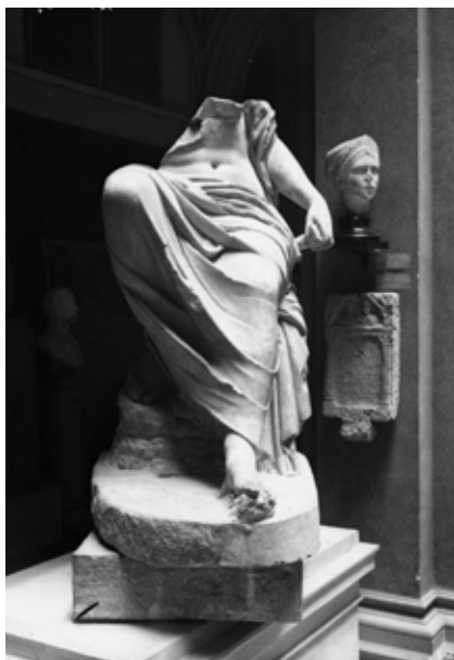
Kip Muze, s odstranjenim većim dijelom Paronuzzijevih dodataka, nakon 1900.

Sa Nugentovom zbirkom dospješe u narodni muzej osim većega broja manjih ulomaka od velikih kipova, još i dva velika ženska torza, za koje se doduše ne može sigurno ustvrditi, da pripadaju grupi sa natječajem između Marsyje i Apo-