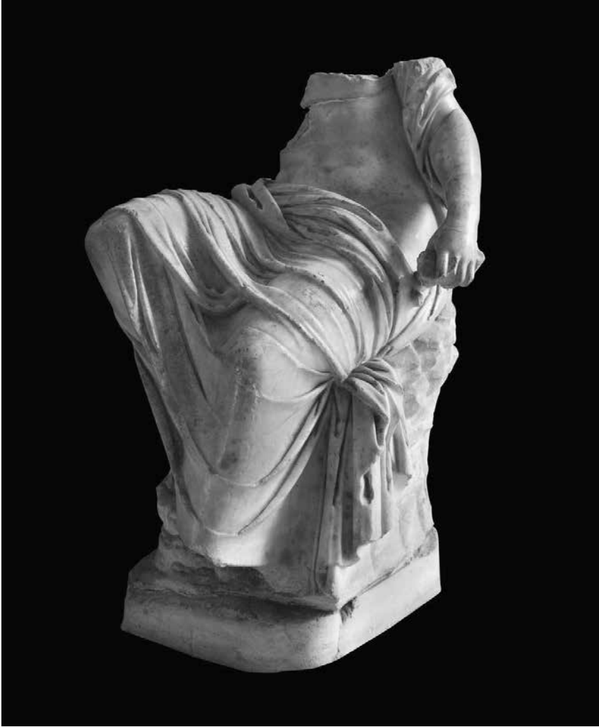
Kip muze Kaliope, sprijeda, Arheološki muzej u Zagrebu

haut über der Achsel, ungarischer Marmor 6' 1" (1 grčki kip Silena s djetetom Bakhom, s lavljom kožom preko ruke, ugarski mramor 6' 1"). 6