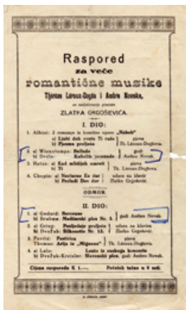
Program Večeri romantične muzike u Sisku (?), oko 1920.