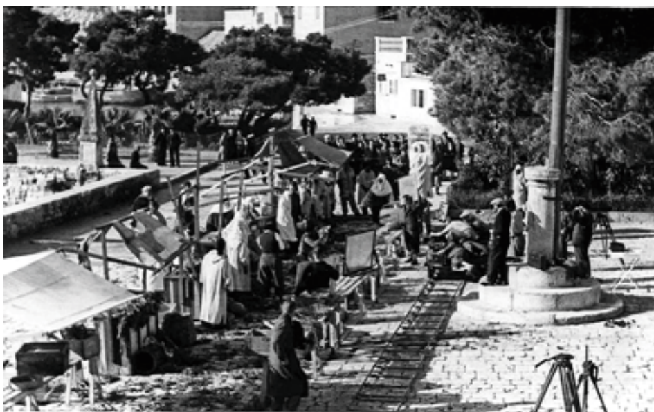
Snimanje igranog filma Nemogući gospodin Pitt, studeni / prosinac 1937.