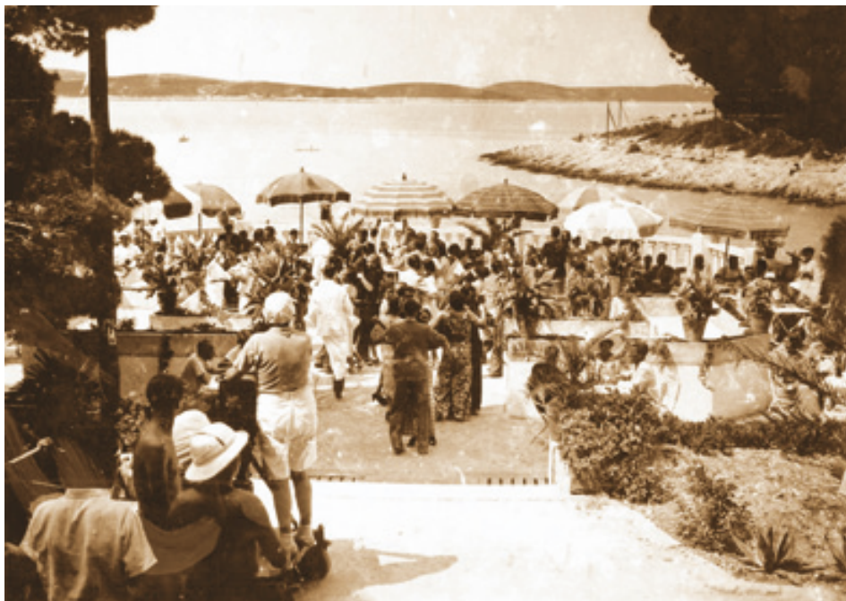
Snimanje igranog filma Princeza koralja na kupalištu Bonj, lipanj 1936.