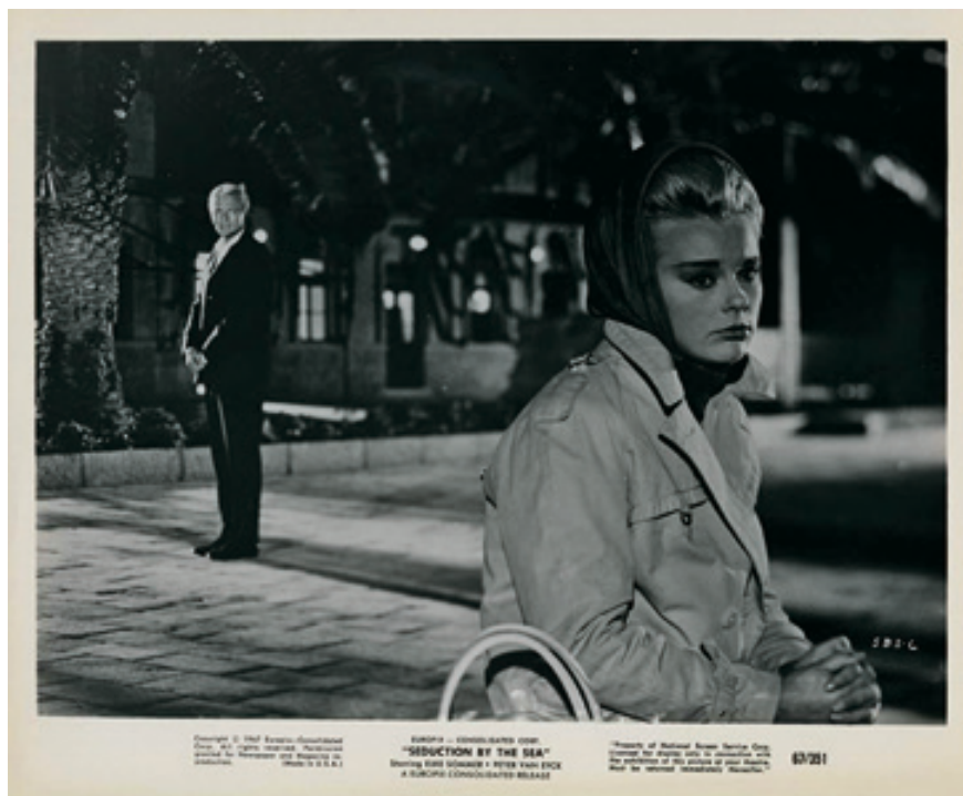
Prizor iz filma Verführung am Meer ( Seduction by the sea ), 1963. g.

sve strane. Na ovaj način Gluščević se poslužio motivima iz pučkog teatra. Sličnosti su vidljive i u jednom od najboljih televizijskih dramskih ostvarenja svih vremena, seriji Naše malo misto (1969.-1971.), koja odavno ima kulturni status. Snimana je, među ostalim, u Starom Gradu i Vrboskoj.