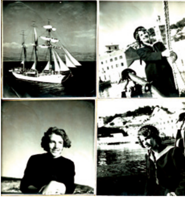
Snimanje igranog filma Mala Jole, 1955.