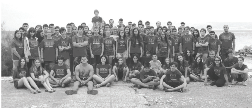
Slika 1. Sudionici Ljetnog kampa mladih matematičara 2016.

Ovogodišnji Ljetni kamp mladih matematičara, u organizaciji udruge Mladi nadareni matematičari "Marin Getaldić", održao se od 15. do 22. kolovoza u Novom Vinodolskom. U aktivnostima kampa sudjelovao je do sada rekordan broj učenika, njih čak 71, srednjoškolaca i osnovnoškolaca koji su završili 7. ili 8. razred. Raspored je i ove godine bio prepun aktivnosti: predavanja, rad na projektima i popularno-znanstvena predavanja, ali ostalo je i dovoljno vremena za zabavu.