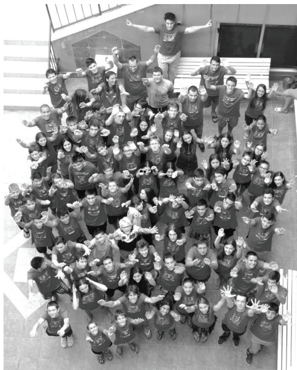
Slika 3. Pozdrav do sljedeće godine.