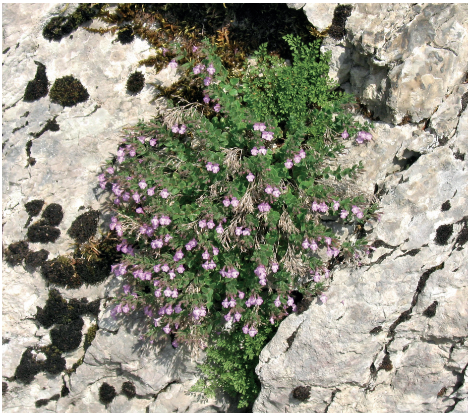
Slika 3. Micromeria croatica na prirodnom staništu; Kremer, 2015.