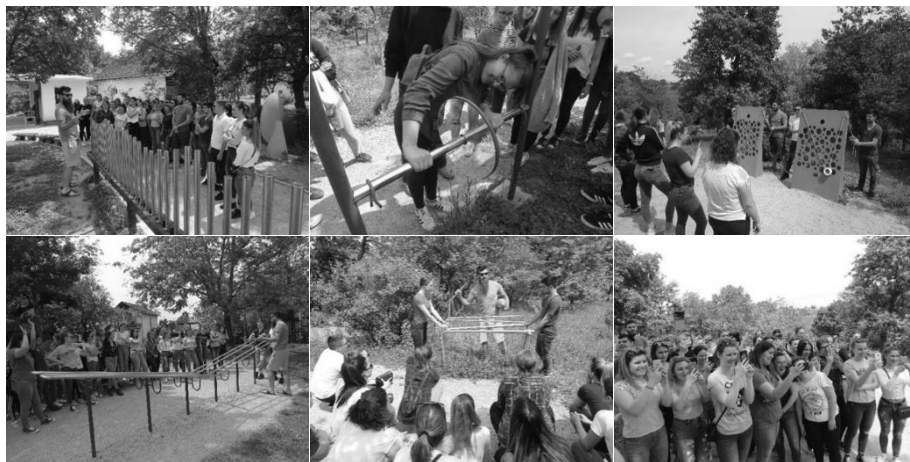
Slika 8. Studenti sudjeluju u istraživanju fizikalnih pojava i zakonitosti u Parku znanosti.

Samostalnim korištenjem atraktivnih izložaka studenti su na zabavan način s oduševljenjem ponovili ranije naučenu “teoriju” te su došli iskustvenim učenjem do odgovora na brojna pitanja iz prirodoslovnoga područja. Posjet ovome parku sigurno će im ostati u sjećanju kao prostor na koji mogu jednoga dana dovesti svoje učenike kako bi na zabavan način, kroz interaktivne znanstvene i edukativne sadržaje, došli do novih spoznaja.