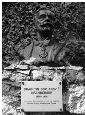
Slika 6. Dragutin Gorjanović Kramberger, hrvatski geolog, paleontolog i paleoantropolog.