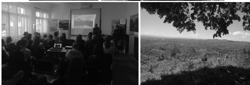
Slika 2. Park prirode Žumberak – Samoborsko gorje, predio Lović Prekriški kod Ozlja.