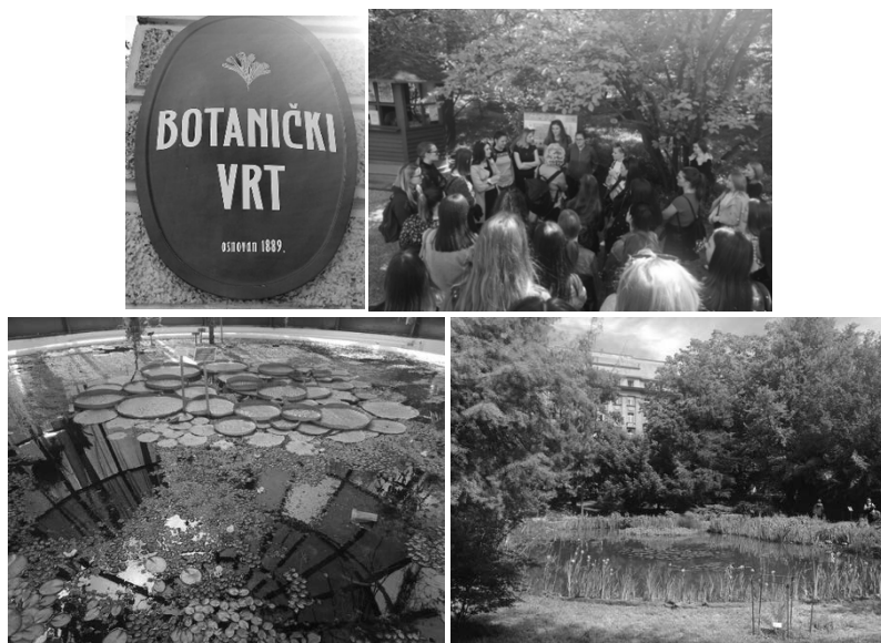
Slika 5. Botanički vrt u Zagrebu.

Nakon obilaska, upoznavanja biljnoga i životinjskoga svijeta Parka prirode Žumberak – Samoborsko gorje te uživanja u prirodi, studenti su posjetili Botanički vrt Prirodoslovno-matematičkoga fakulteta Sveučilišta u Zagrebu, osnovanoga 1889. godine (slika 5.). Od 1971. godine vrt i njegove građevine, biljke i životinje zaštićeni su kao spomenik prirode i kulture te kao dio kulturnoga dobra Republike Hrvatske