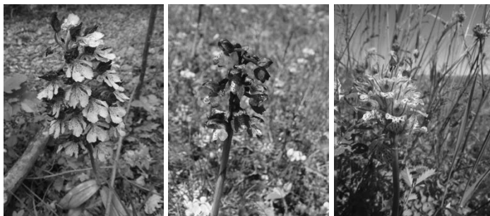
Slika 4. Divlje orhideje.

prilagođene uvjetima sjene kao što su neke globalno osjetljive vrste kaćuna (divljih orhideja; slika 4.) i ljiljana ( http://www.park-zumberak.hr/ ).