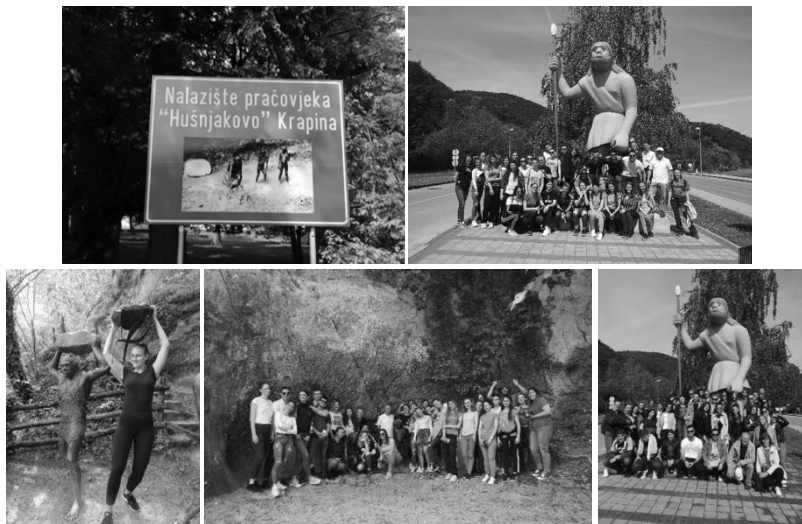
Slika 7. Studenti u posjetu Muzeju krapinskih neandertalaca u Krapini.

(Mali geološki laboratorij, Životinje u vremenu neandertalaca, Abeceda fosila, Neandertalci i umjetnost – ima li veze? ( http://www.mkn.mhz.hr/hr/edukacija/edukativni-program/interaktivne-radionice/ )).