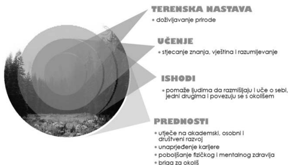
Slika 1. Terenska nastava

Za kvalitetno suvremeno obrazovanje o prirodoslovnoj i kulturnoj baštini, okolišu i održivom razvoju neophodno je interdisciplinarno planirati nastavne sadržaje vezane uz terensku nastavu. “Kulturna baština nasljeđe je svakoga naroda te je važno da učenici tijekom školovanja postupno upoznaju kulturnu baštinu svoga zavičaja, a kasnije i cijele domovine. Neupitna je pedagoška iskoristivost kulturne baštine zavičaja s pozicije metodičkog pristupa integracije i korelacije nastave kao i uključivanja učenika u aktivno učenje i istraživački rad” (Borić i Škugor 2015.). Dobiveno kulturno nasljeđe naših predaka sadašnje bi generacije trebale sačuvati. Podučavanje na terenskoj nastavi temelji se na učenju otkrivanjem u neposrednoj stvarnosti, realizaciji iskustvenoga učenja iz kojega nastaje trajno znanje, olakšavanju učenika i interdisciplinarnom pristupu nastavnim sadržajima (Borić i sur. 2017.). “Istraživački pristup poželjan je iskorak prema suvremenoj koncepciji obrazovanja. Nezaobilazan je oblik rada u usvajanju bioloških, geografskih, povijesnih, estetskih, kulturnih i svih drugih sadržaja u smislu neposrednosti i integriteta iskustva. Stječući iskustvo iz neposrednog okruženja, radimo na razvoju ljudske komunikacije i razvoju različitih poruka o okolišu” (Borić i sur. 2017.).