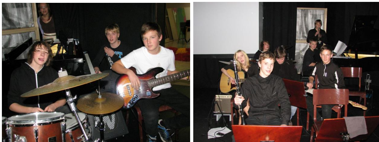
Slika 1: Dio orkestra

Mentorice smo se međusobno povezale. Učiteljica za likovnu umjetnost zajedno je s djecom napravila auto od kartona i sve što je bilo potrebno za pozornicu. Učiteljica za glazbenu umjetnost pripremila je zbor za pjevanje pjesama iz filma i školski orkestar koji je pratio pjevače. Dan predstave se približavao, bio je prosinac i učiteljicu i ja najviše smo se brinuli je li se netko razbolio. Kako je naša škola prilično velika, igrali smo čak dvaput u četvrtak ujutro, a popodne je kulturni centar bio rezerviran za roditelje i sve ostale mještane. Upravo nastup popodne koji je odigran besprijekorno je najviše značio djeci. Svi smo bili ponosni. Glasni pljesak i danas odjekuje u našim sjećanjima. Studenti su se zaista dokazali i pokazali svaki svoj talent. Snimili su i DVD, koji su roditelji vrlo rado kupili za simboličnu cijenu i pridonijeli školskom fondu.