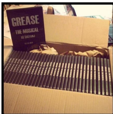
Slika 2: DVD-i