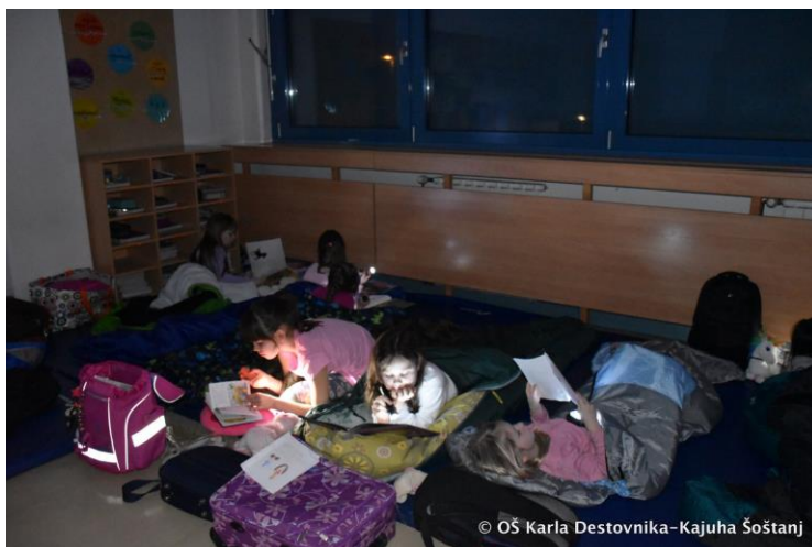
Slika 3: Čitanje prije spavanja

U petom razredu učiteljica engleskog i ja održali smo književnu večer kako bismo potaknuli učenike da čitaju i na engleskom jeziku. Čitali smo knjigu pod nazivom The Cat in the Hat . Bilo je vrlo zanimljivo za djecu. Čitanje je praćeno aktivnostima vezanim za razumijevanje teksta i ponovno stvaranje. Na kraju, uslijedio je omiljeni dječji dio: kino - gledanje istoimenog animiranog filma uz obavezne kokice.