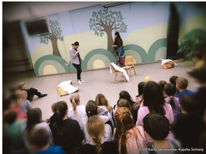
Slika 1: Nastup stomatologa

Već nekoliko godina suradnici provode noć čitanja s učenicima trećih razreda. Učenici stižu u školu kasno popodne. Svatko donosi i svoju najdražu knjigu, koju čitaju prije spavanja i predstavljaju razrednicima. Nakon večere posjećuju ih stomatolozi, koji igraju važnu ulogu u podizanju svijesti o važnosti dentalne higijene. Oni za njih igraju igru i čitaju knjigu. Održana je i predstava s psima u teretani. Prije odlaska u krevet, učiteljice su također pročitale zanimljivu knjigu i uspavanku.