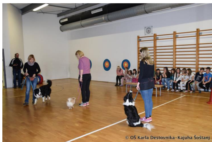
Slika 2: Točka sa psima