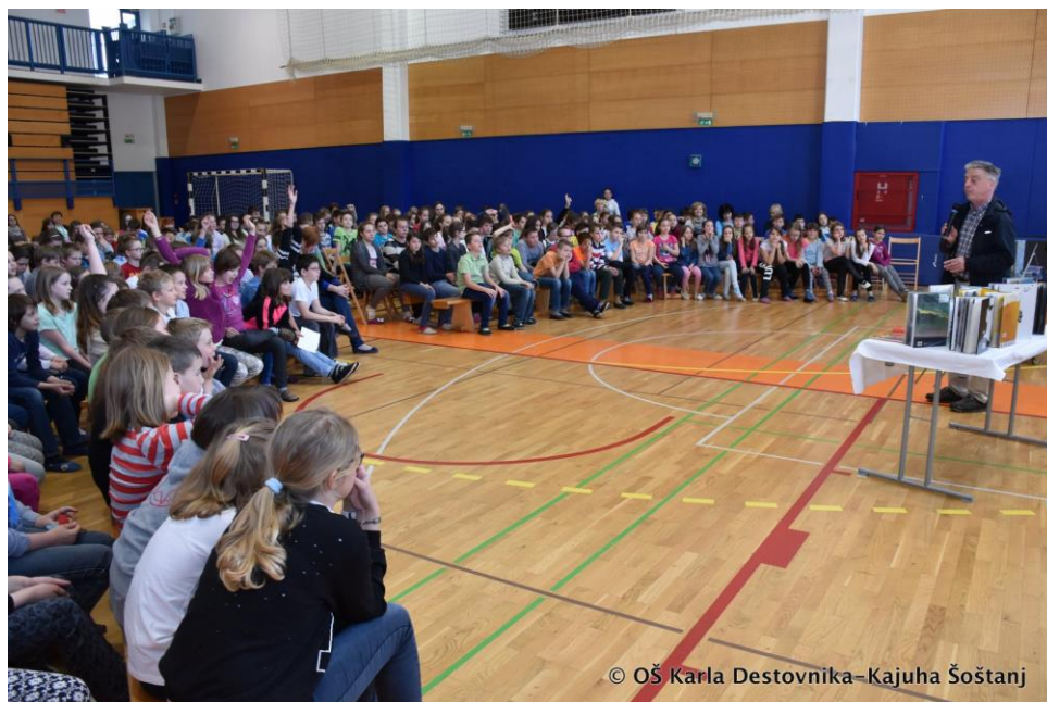
Slika 5: Posjet poznatog slovenskog kulturnjaka Andreja Rozmana Roze

Naša škola sudjeluje u projektu Odrastanje uz knjigu. Sedmoškolci svake godine posjete gradsku knjižnicu. Tamo razgledavaju studijski odjel, a posebno odjel za mlade, slušaju bajke i upoznavaju zanimljive radove za mlade. Oni mogu postati članovi omladinske knjižnice i posuđivati knjige. Na kraju, svaki učenik dobije jednu knjigu.