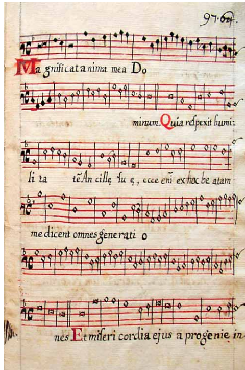
Slika 4: Magnificat , Kantual fra Pavla Vučkovića mladeg iz 1768. godine, 97. str., Arhiv Franjevačkog samostana Sinj (s dopuštenjem).

čuvaju u knjižnici San Bernardino, na čijim se naslovnim stranicama nerijetko nalazi upravo naziv Cantoria . 23