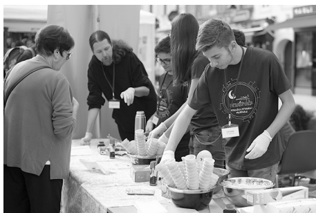
Slika 3. Nitroled – sladoled spravljen pomoću tekućeg dušika, Institut za fiziku (projekt KaCIF).

Ministarstvo znanosti i obrazovanja Republike Hrvatske i osamnaest eminentnih institucija iz akademskog, znanstvenog, javnog i privatnog područja djelovanja je u veljači 2018. godine prijavilo projektni prijedlog za održavanje Europske noći istraživača u Republici Hrvatskoj 2018. i 2019. godine. Naziv projektnog prijedloga je Techno-Past Techno-Future; European Researchers Night . Projektni prijedlog je pozitivno evaluiran od strane Europske komisije i prihvaćen je za financiranje. Početak projekta je 1. kolovoza 2018., a trajao je petnaest mjeseci.