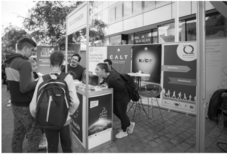
Slika 5. EU Kutak je davao informacije o velikim znanstvenim projektima Europske unije koji se sufinanciraju u Hrvatskoj.