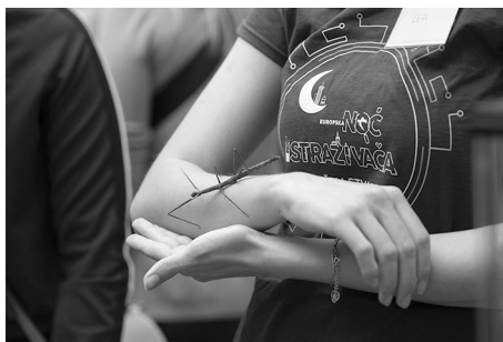
Slika 4. Paličnjak je jedan od izvanrednih primjera evolucije života koji su posjetitelji mogli upoznati uživo.

Europska noć istraživača u Republici Hrvatskoj se provodi prvi put u ovakvoj konzorcijskoj formi čime je omogućena disperzija događanja po čitavoj državi, a gradovi domaćini su bili Osijek, Rijeka, Split i Zagreb.