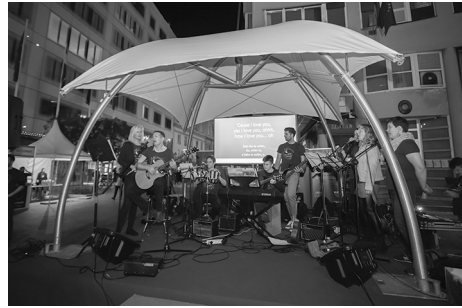
Slika 6. Glazbeni sastav Instituta Ruđera Boškovića donio je dodatnu zabavu u znanost.

Osamnaest hrvatskih institucija iz sustava znanosti, visokoga obrazovanja, javne uprave i privatnog sektora proveo je projekt ovogodišnje Europske noći istraživača 27. rujna 2019. godine od 17 do 22 sata na sljedećim lokacijama: Zagreb – Europski trg, Tunel Grič, Osijek – Dvorište Rektorata, Rijeka – Tower Center Rijeka, Split – Podrumi Dioklecijanove palače, Riva.