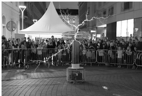
Slika 2. Teslina zavojnica Elektroničkog i računalnog kluba Ivanić-Grad.

Ministarstvo znanosti i obrazovanja Republike Hrvatske i osamnaest eminentnih institucija iz akademskog, znanstvenog, javnog i privatnog područja djelovanja je u veljači 2018. godine prijavilo projektni prijedlog za održavanje Europske noći istraživača u Republici Hrvatskoj 2018. i 2019. godine. Naziv projektnog prijedloga je Techno-Past Techno-Future; European Researchers Night . Projektni prijedlog je pozitivno evaluiran od strane Europske komisije i prihvaćen je za financiranje. Početak projekta je 1. kolovoza 2018., a trajao je petnaest mjeseci.