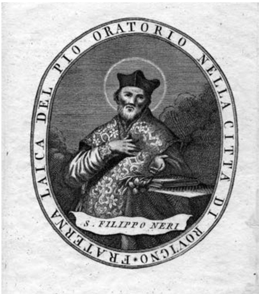
Fig. 1 – Immagine di San Filippo Neri in un'incisione dell'omonima "Fraterna laica del Pio Oratorio nella città di Rovigno (sec. XVIII)

società; epperò la storia deve tenerne conto, poiché altrimenti non ritrarrebbe intera la vita che fu” 36 .