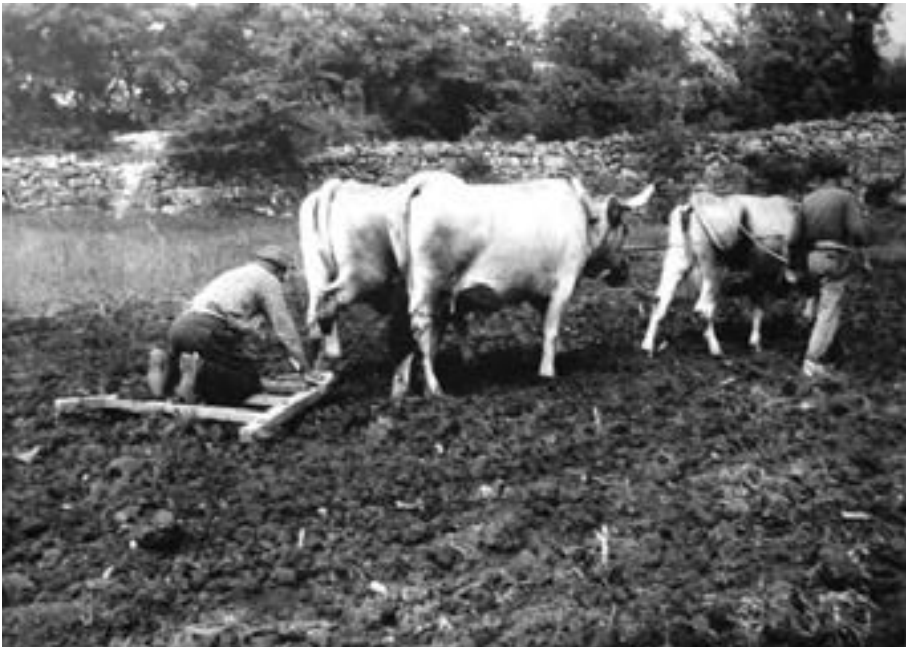
Fig. 5. – Lavorazione del terreno: un'epice all'opera

Draga Draga in Tichina Draguglina Dragulina Drasizamala Drasize Drasizeverti Drasizza Drenichij Drenovaz (Condolof) Drenovizza Drenoviza Cudicha Duboca Dubochi dolaz Dugagniva Dupla Dupli dolaz Duplidolcich Duplired Dvorina Dvorischie Erseni Ersischie