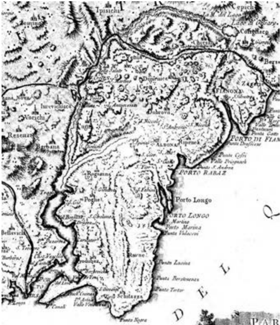
Fig. 6. – Il territorio albonese all'epoca veneta nella Mappa di Giovanni Valle del 1784 (dal vol. L. LAGO-C. ROSSIT, Descriptio Histriae , Collana degli Atti del CRS, Rovigno, n. 5)

Letaschiza Carpano 298 Lutina 279 Maial 298 Malibergod 122v Marzinizza, contrada A19v Mielova 299