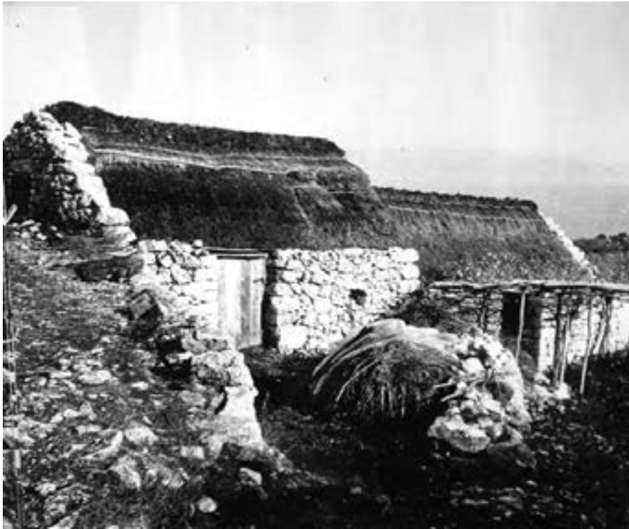
Fig. 9. – Le abitazioni dei contadini non differivano molto da queste stalle