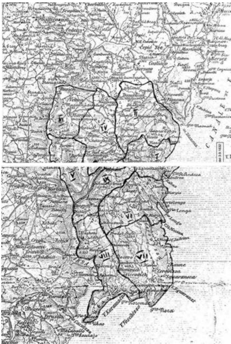
Fig. 7. – Divisione del Territorio albonese in dodici capocontrade