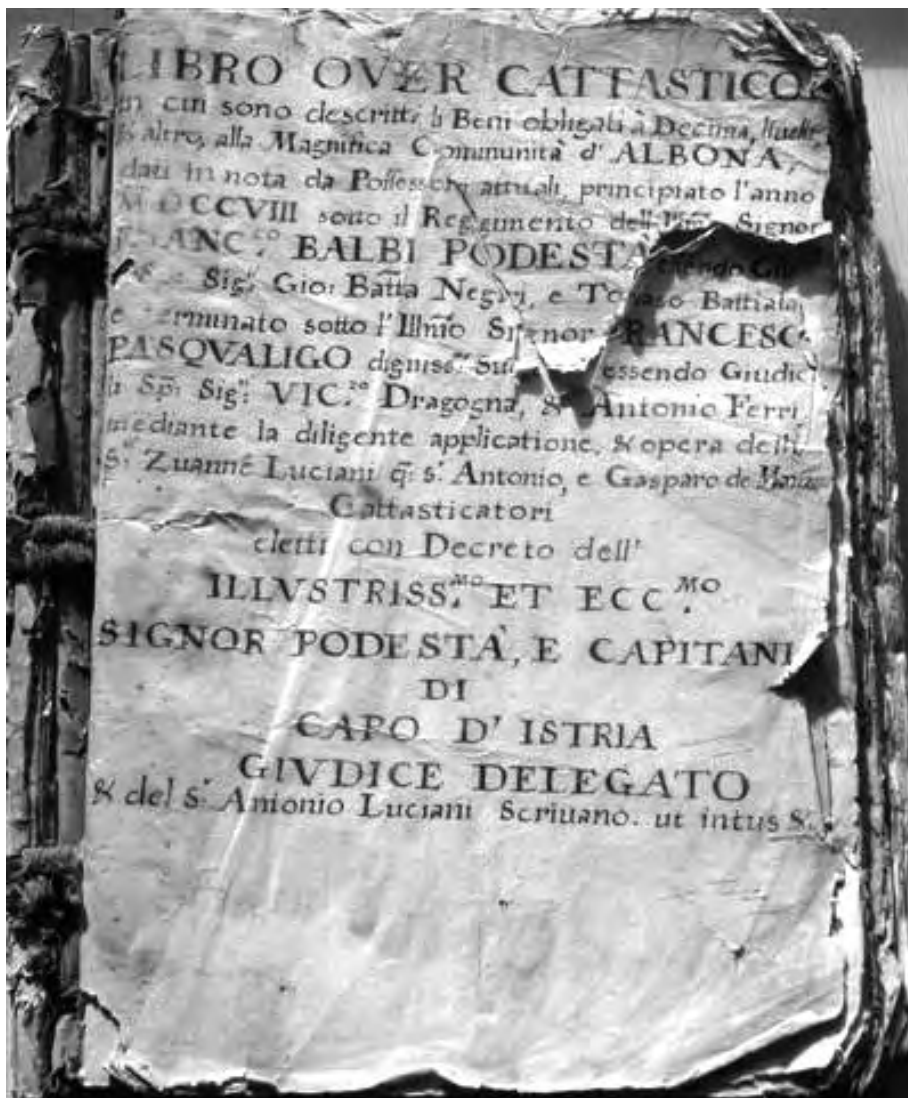
Fig. 1. – Frontespizio del Libro over Cattastico albonese del 1708

Per facilitare la lettura e la comprensione, negli indici abbiamo usato