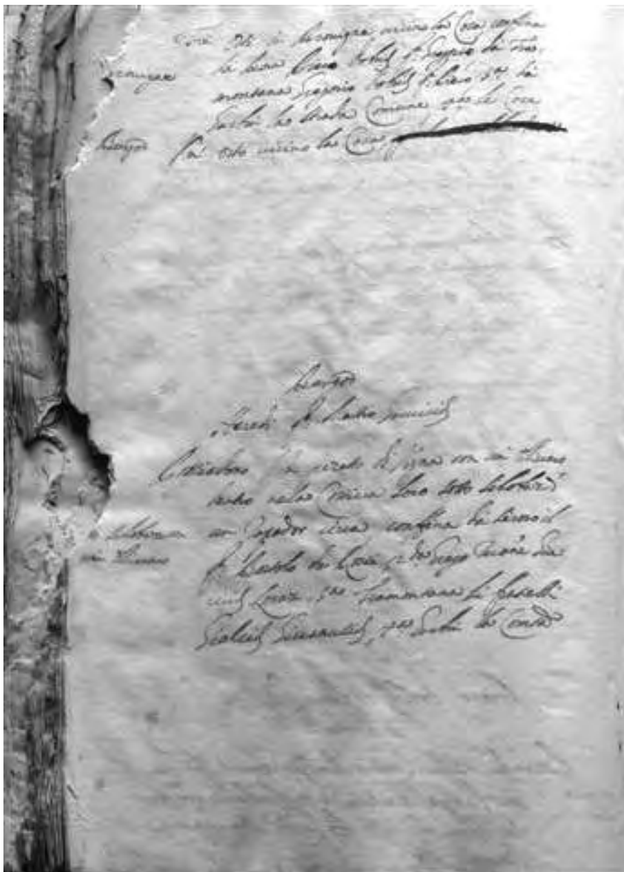
Fig. 3. – Pagina interna del Libro over Cattastico