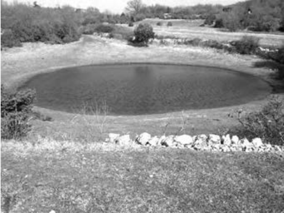
Fig. 4. – I laghi rappresentavano le principali risorse idriche del territorio