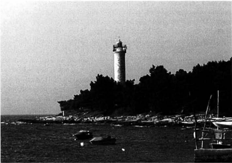
Fig. 1 – Faro di Salvore, visto da sud

Il punto 40 delle anzidette istruzioni prevede la costruzione di un faro nel porto di Trieste e suggerisce anche i provvedimenti da adottare per garantirne il finanziamento. Nei decenni successivi vennero via via elaborati alcuni progetti dell'opera ma, per ragioni probabilmente finanziarie, nel 1778 il governo di Vienna ne sospese la realizzazione. Della questione non si parlò più fino al 1815. A partire dal 1805 il movimento commerciale del porto si ridusse fino praticamente ad azzerarsi tra il 1809 e il 1813, anni