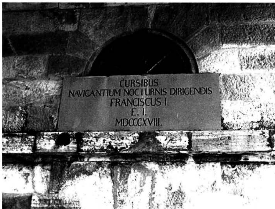
Fig. 3 – Epigrafe commemorativa dell'inaugurazione del faro nel 1818 (sulla base del faro sopra l'entrata lato mare)

Il 24 marzo 1821 la Deputazione di Borsa deliberò di completare il faro e le sue pertinenze con un edificio da adibire ad alloggio per gli assistenti nonché a magazzino. Il 30 aprile successivo, venne stipulato un contratto d'appalto con l'architetto Matteo Pertsch. Il faro venne così dotato di una dignitosa casa d'abitazione, di una spaziosa tettoia e di un comodo cortile, come ancora oggi si può constatare. Spesa preventivata F.