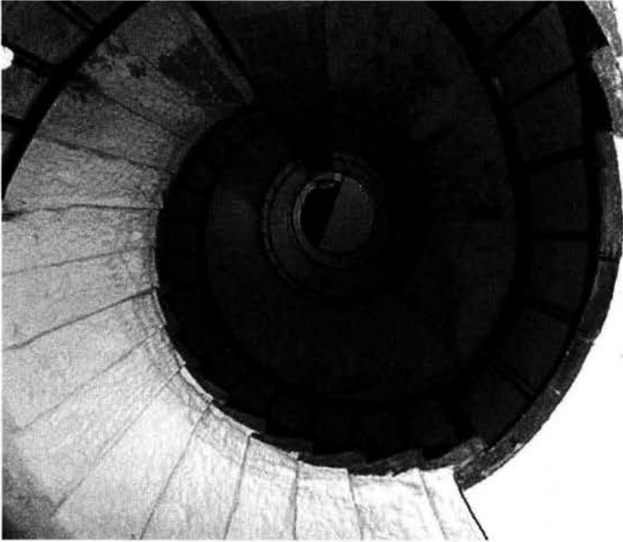
Fig. 2 – Scala a chiocciola all'interno della torre

tenore di zolfo e di ben altra qualità rispetto al carbone dell'Arsa. Il carbone utilizzato a Salvore provocava, con l'emissione di \text{SO}_2 durante la distillazione, la formazione di acido solforoso a seguito della combinazione dell'anidride con l'acqua di condensa che si formava sulla superficie di ferro dopo il raffreddamento del distillatore. Le riparazioni dovevano quindi essere continue. Inoltre, le fiamme, specialmente durante le lunghe e fredde notti invernali, si affievolivano col diminuire della pressione del gas accumulato in precedenza nel deposito: da qui le frequenti lamentele dei capitani alla Deputazione per l'insufficiente luce erogata dal faro. Infine, la gabbia non era a perfetta tenuta d'aria e quindi l'assistente doveva costantemente esser pronto a riaccendere questa o quella fiamma spenta da infiltrazioni d'aria, ovviamente inevitabili in presenza della bora.