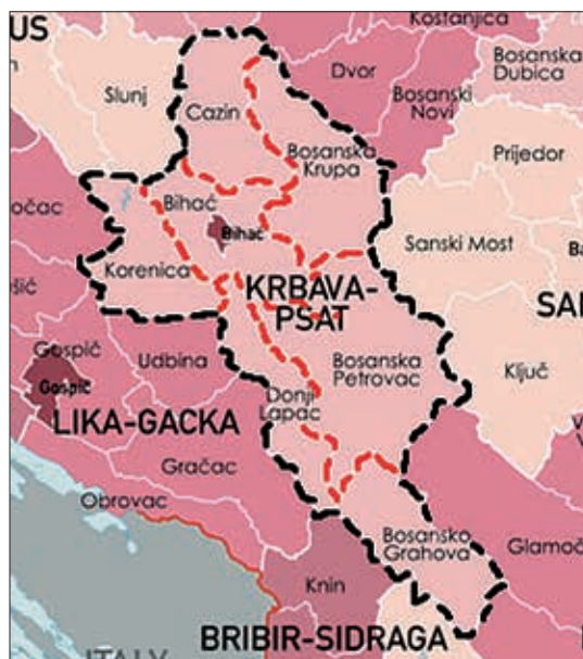
Slika 1. Zemljopisna karta Velike župe Krbava i Psat s kotarevima

Sjedište župe u razdoblju od 23. srpnja do 23. rujna 1944. iz Bihaća je privremeno bilo premješteno u Banja Luku. 989 Zbog općeg sigurnosnog stanja 13. prosinca 1944. g. na području župi je uvedeno iznimno stanje kada je poslove građanske uprave preuzeo vojni zapovjednik obalnog odsjeka Lika, a od 27. ožujka 1945. g. glavar građanske uprave. 990