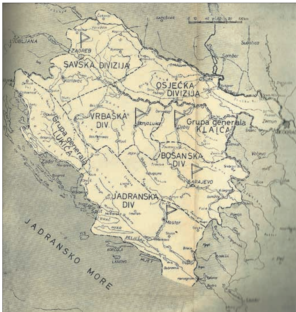
Slika 4. Karta NDH sa vojno-teritorijalnim pregledom (Karta preuzeta iz knjige: Milan N. Zorić, Drvar u ustanku četrdeset prve, Vojno-izdavački zavod, Beograd 1963., 5)