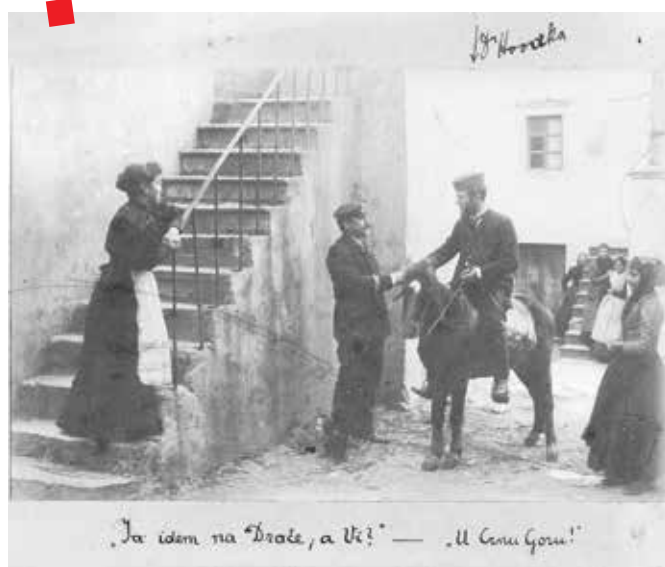
„Ja idem na ‘Droče, a Vi?’ — ‘U Čenu Goru!’“