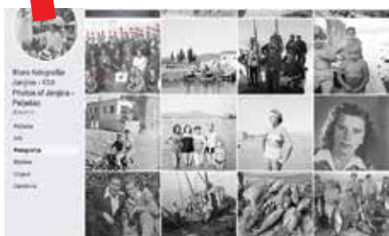
Facebook stranica „Stare fotografije Janjine“