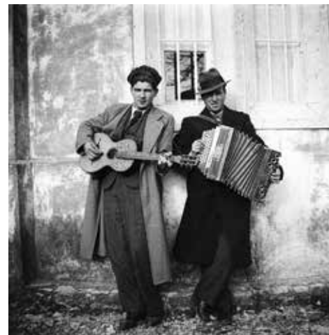
Iz albuma negativa Veljka Dežulovića Rusa (1935./1936.)

Struktura njegovog web projekta (i zbog ograničenosti Facebook profila) ima svojih slabosti, preklapa se i nije se uvijek lako snaći u njoj. Isto tako, Lozini je u prvom planu sadržaj fotografije pa preslike nude malo i nedovoljno kontekstualnih podataka o izvorniku fotografije (format, vrsta negativa/pozitiva...) i fotografima, koji najčešće ostaju nepoznati. Ipak, potrebno je naglasiti da Lozina nije profesionalac i da je web projekt isključivo djelo njegova entuzijazma. Sve je te fotografije, bilo negativne bilo pozitivne, sam Lozina tijekom ljeta pronalazio i uz veliki angažman nagovaranja i osiguranja privole vlasnika digitalizirao i javno