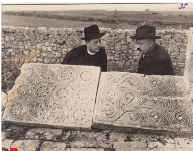
Fotografija dr. Oskara pl. Hovorke Zderas iz 1896.

Korčula-Lastovo. Projekt je utoliko fascinantniji, što je isključivo rezultat rada i volje jednog čovjeka. No, već odavno su dosezi tog djela sveobuhvatni, profesionalni i institucionalni. I davno su nadrasli lokalnu sredinu, koja je s ovim web projektom barem virtualno sačuvala i zaokružila svoj identitet. A ta zadaća u današnjem vremenu depopulacije i oskudnog institucionalnog potencijala nije nimalo jednostavna. Sve u svemu, fotografija je i na ovom primjeru još jednom posvjedočila svoje nenadmašne mogućnosti u približavanju i vizualizaciji prošlosti. ■