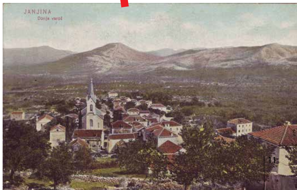
Razglednica Janjine (oko 1905.)

način šire i dopunjuju znanja i spoznaje na korist širem krugu potencijalnih korisnika. Za razliku od web stranice koja se prestala dopunjavati, Facebook profil se do danas značajno proširio s brojnim novim preslikama i dalje se dopunjuje. Fotografije iz 1890-ih Lozina je strukturirao prema raznim temama (razglednice, vjenčanja, djeca, kupanje, vojnici, sprovodi, društva, u El Shattu, iseljenici...), ali i prema pojedinim janjinarskim obiteljima i okolnim naseljima (Sreser, Drače, Popova Luka). Zasebno su grupirane snimke pojedinih običaja („fumada“, „vagiđanje“ – ljubakanje, „maškari“...), a s nizom web albuma skreće se pozornost na poznate Janjinare, poput prvog hrvatskog pilota Ivana Bjelovučića, spisatelja dr. Nikole Zvonimira Bjelovučića i političara don Iva Prodana. Posebno vrijedi izdvojiti digitalizirani album staklenih negativa dr. Oskara pl. Hovorke Zderasa te negative dr. Veljka Dežulovića Rusa, snimljene u Janjini od 1935. do 1938., ali i podcrtati činjenicu da je Lozina nemali broj fotografija spasio upravo pred uništenjem i na lokalnoj razini osvijestio iznimnu vrijednost tog arhivskog izvora.