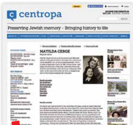
Gradivo NBS na portalu Centropa

Otvoren pristup kolekcijama NBS podjednako je važan i s korisničke strane i sa strane knjižničara. On osigurava fizičku zaštitu originala, a s druge strane pojednostavljuje rad samih knjižničara. Kao posebno važna činjenica ističe se i povećanje vidljivosti građe, koja se tako stavlja u širi tematski kontekst što pridonosi i boljem razumjevanju i vrednovanju, a knjižničari tako otvaraju vrata novim mogućnostima suradnje s drugim institucijama u pogledu sadržaja, prava pristupa, metapodataka i slično. S druge strane, ovakav način postavljanja građe u otvoren pristup omogućava uštedu vremena korisnicima koji lako i brzo, „iz fotelje“ mogu doći do željene građe. Prikazani kontinuitet sudjelovanja u europskim projektima, kao i raznovrsnost prikazane građe u otvorenom pristupu, pokazuju snažnu odlučnost NBS da omogući korisnicima upoznavanje s kulturnom baštinom koja se čuva u njezinim fondovima kao i da se njeguju postojeća i razviju nova partnerstva u te svrhe.