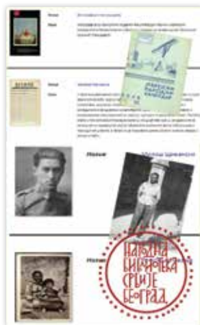
Digitalne zbirke NBS u projektu Migracije kroz znanost i umjetnost