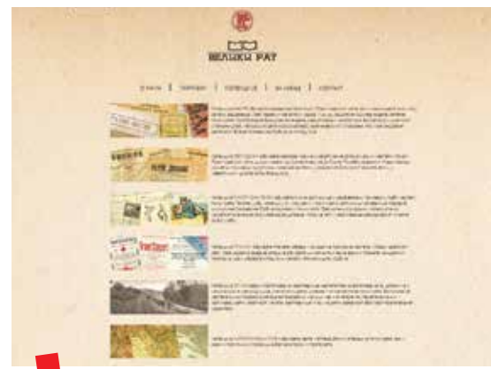
Zbirke na portalu Veliki rat

Tijekom 2018. je počela suradnja s Wikimedijom te je dogovoreno da se u sklopu njihova GLAM projekta neke stare fotografije iz posebnih zbirki NBS postave u Wiki repozitorij i na taj način učine vidljivijim korisnicima. To su uglavnom fotografije starih fotografiskih studija i fotografa s kraja 19. st. koje su oslobođene autorskih prava. Cilj repozitorija je da korisnicima koji pišu i uređuju članke na raspolaganju budu kvalitetne i dobre, a samim tim i vjerodostojne fotografije jer iza njih stoji određena ustanova. Za početak je predviđeno da se u repozitorij postavi oko 40 fotografija s planom daljnjeg povećanja tog broja.