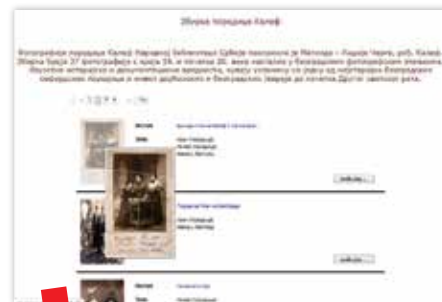
Zbirka fotografija obitelji Kaleb u Digitalnoj biblioteci NBS

Odeljenje posebnih fondova NBS 2017. godine otvorilo je profil na Facebooku u povodu 70. godišnjice osnivanja. Tijekom protekle dvije godine ova je društvena mreža korištena za prikazivanje različitih sadržaja i programa iz svojih aktivnosti. Najveći dio sadržaja je posvećen prezentaciji materijala koji se nalazi u nekoj od 8 zbirki Posebnih fondova, a prilikom odabira materijala prioritet se daje onoj građi koja nije već dostupna u Digitalnoj NBS.