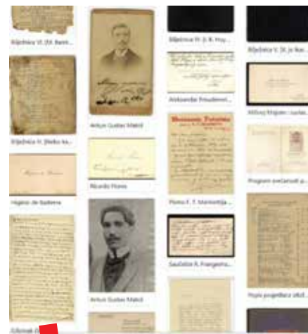
DiZbi arhiv – Ostavština A. G. Matoša iz Odsjeka za povijest hrvatske književnosti

godini završiti proslavom, koja će se održati 8. studenog u Knjižnici HAZU. Uz kratki presjek rada DiZbi-ja, kojeg će dati suradnici DiZbi tima, izlaganja će održati i predstavnici institucija s kojima je DiZbi tijekom godina surađivao na različitim projektima, a nakon izlaganja diskusija će se nastaviti uz okrugli stol s temom „Politike za digitalnu kulturu: prilagodba ili odustajanje?“. ■