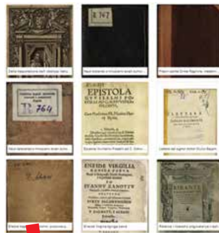
DiZbi knjižnica – stare i rijetke knjige

Digitalni muzej sastoji se od fotografija umjetničkih radova, većinom iz fundusa galerijskih i muzejskih zbirki, ali i drugih jedinica. Postotak slika na DiZbiju za sada je prilično malen u