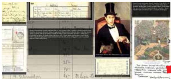
Virtualna izložba Salon Ullrich - prva zagrebačka privatna galerija

Posebnu vrijednost ovakvog projekta predstavlja mogućnost povezivanja građe iz različitih zbirki pojedinih organizacijskih jedinica, ali i međusobno povezivanje zbirki Akademijinih jedinica, čime se pruža potpunija informacija te omogućava interdisciplinarnim istraživačima daleko širi uvid u Akademijine fondove.