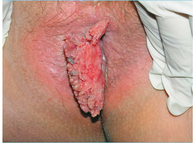
SLIKA 3. CONDYLOMATA ACUMINATA PERIANALNO U 32. TJEDNU TRUDNOĆE

FIGURE 2. ANOGENITAL CONDYLOMATA ACUMINATA IN A 4 YEAR OLD GIRL