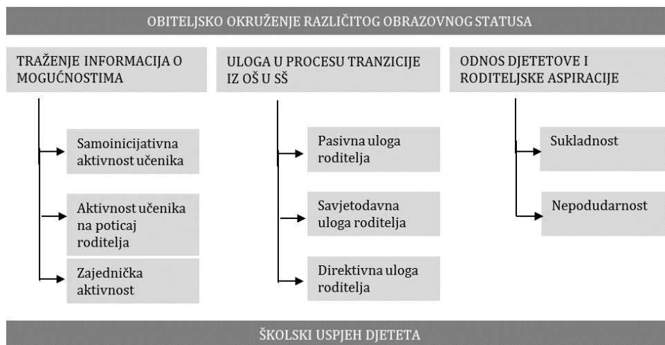
Slika 1. Analitički okvir kvalitativne istraživačke dionice

Analitički okvir razvijen temeljem tematske analize učeničkih odgovora o roditeljskim obrazovnim aspiracijama i odabiru srednje škole prikazan je na slici 1.