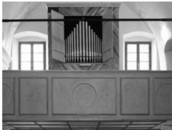
Orgulje Nikole Lupinija Zadranina iz 1640.g. u crkvi Sv. Duha u Šibeniku

Prvobitna namjena instrumenta je LITURGIJSKA. Često imamo slučaj da u crkvama sviraju priučeni orguljaši koji možda nisu imali priliku za profesionalno školovanje, ali su uložili mnogo volje i truda da se sami ili uz nečiju pomoć osposobe za sviranje na misama. Neki od njih znat će svirati povijesne orgulje, drugi ne će. Ako župnici u razgovoru s njima ustanove poteškoću u sviranju povijesnoga instrumenta, bilo bi