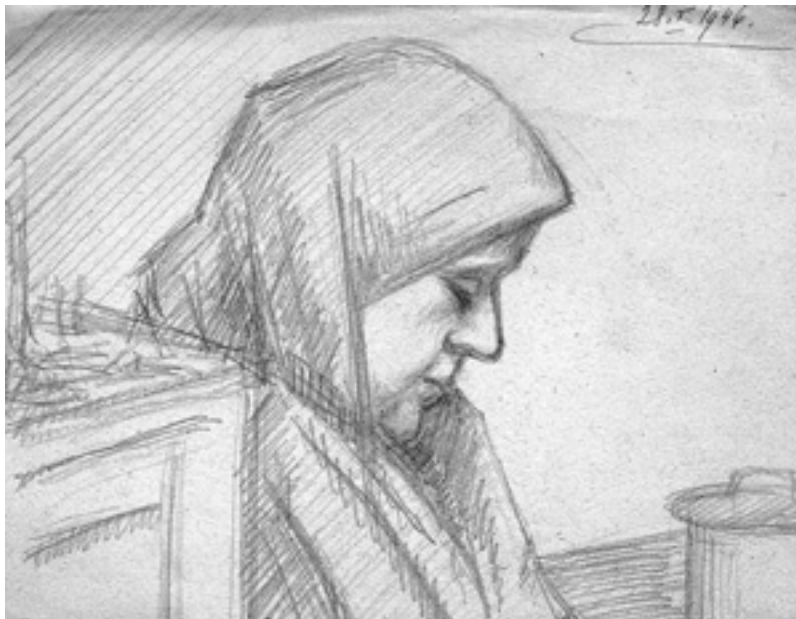
Slika 9. Crtež njegove majke, Muchtin, 1946.

U crtežu ispod vidimo pejzaž, također nastao prema promatranju, Muchtin sad prostor gradi šrafurom linija kojima postiže vrlo zanimljiv ritam, igru svjetla i sjene. Crtež je kao i priroda živ i titrav.