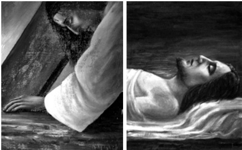
Slika 13. i 14. Dijelovi križnoga puta, Isus pada pod križem i Isusa polažu u grob, 1942. nekad se nalazio u crkvi na Vežici no preseljen je u crkvu Majke Božje Goričke

U kasnijoj fazi boje postaju pastelnije, vjerojatno pod utjecajem Carminea Butcovicha Visintinija, koji slika fresku u apsidi crkve na Vežici 1945. 7