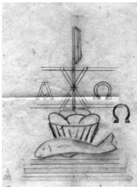
Slika 20. Skica za reljef za vratašća svetohraništa