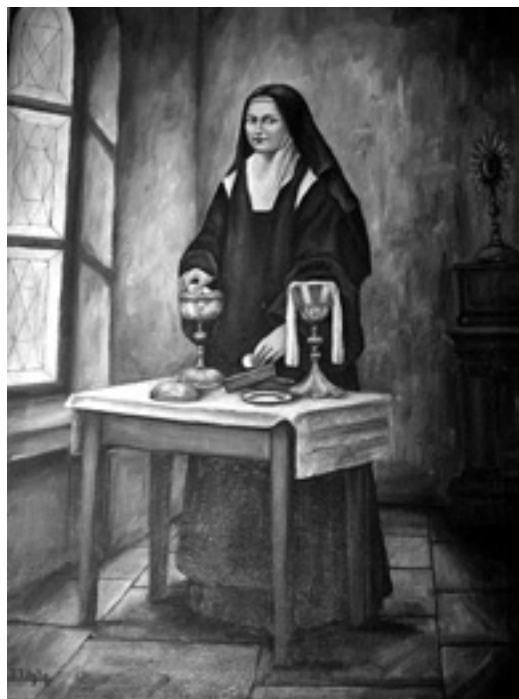
Slika 11. Sv. Terezija, Muchtin

Iako nemamo konkretnih skica za određene slike, vidljivo je da Muchtin u slikama primjenjuje naučeno u crtežu. Likovi zadržavaju čvrstu kompoziciju i dobre proporcije. Prostor i perspektiva u rasporedu likova odišu svježinom, ali problem se javlja kod njegove modelacije bojom, posebice u ranijim radovima. Boja na tim prvim radovima vrlo je sirova i plošna. Ne vidi se slikarski rukopis, a radovi kao da pripadaju nedorečenoj naivi.