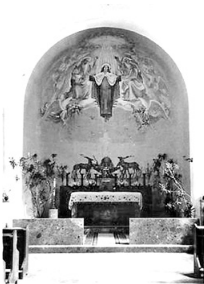
Slika 18. Fotografija oltara crkve sv. Terezije od Djeteta Isusa, Muchtin.

Uz njegove prijenosne radove ovdje valja istaknuti zidnu sliku Dva i dva jelena na izvoru vode koja se nalazila na oltaru u podnožju apsida. Na žalost ta je slika prefarbana. Muchtin je za tu sliku dao skicu, a izveo ju je Carmine Butcovich Visintini.