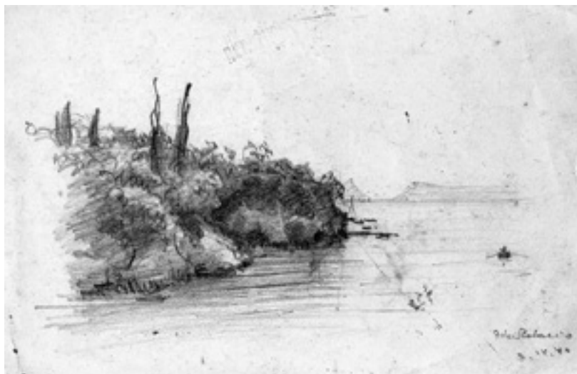
Slika 10. Pejzaž, Muchtin, 1940.

U crtežu ispod vidimo pejzaž, također nastao prema promatranju, Muchtin sad prostor gradi šrafurom linija kojima postiže vrlo zanimljiv ritam, igru svjetla i sjene. Crtež je kao i priroda živ i titrav.