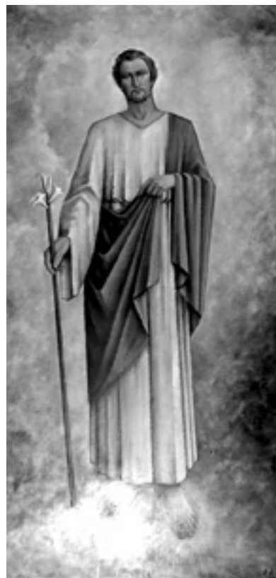
Slika 16. Sv. Josi, Mughtin, 1961.

Slike koje radi za crkvu pomno formatira ne bi li one bile primjerene mjestu na kojem će biti postavljene. Na isti način razmišlja i o njihovoj kompoziciji i rasporedu. Mughtin na ove dvije slike koristi vertikalnu kompoziciju, čime pogledu na glavni oltar i pobočne oltare daje još veći dojam simetričnosti. Likovi su prikazani vrlo jasno, mirno i staloženo u prirodnom stojećem položaju tijela. Draperija prati anatomiju likova. Mughtin koristi pastelne, tople, zemljane tonove, a boju nanosi u slojevima čime površine postaju bogatije, dok cijela atmosfera na slici postaje mirnija i mističnija. Na liku Marije prepoznaje se utjecaj secesije. Mughtin koristi i ikonografske simbole; zmiju ispod nogu Marije, plavu boju njezina plašta i bijelu čistu haljinu, oko glave joj se nalazi zvjezdana kruna koja je u restauraciji nažalost izgubljena. Josip pak nosi cvijet ljiljana kao simbol Božjeg odabira, prikazuje ga kao mladića što govori o njegovoj ravnopravnoj ulozi u Svetoj obitelji. 12