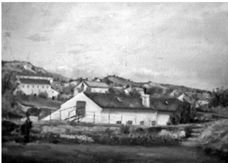
Slika 17. Pejzaž, Muchtin

Osim slika koje Muchtin slika za potrebe sakralnih prostora nađena je i slika pejzaža u kojoj se također prepoznaje Muchtinov osjećaj za prostor. Boja je ovdje puno prirodnija i nanosi su slobodniji pa možemo očitati i njegov likovni rukopis, osjećaje pripadnosti i mirnoće autora unutar pejzaža koji slika. Uz ovaj rad u Muchtinovu arhivu nađene su crno-bijele fotografije, slika mrtve prirode, jabuka u zdjeli i ruža u vazi. Ove teme Muchtin ne prikazuje odvojeno od Boga jer u njih je satkana slika Stvoritelja; za to je dovoljan samo jedan pogled na pejzaž (drveće ili nebo).