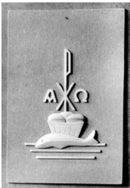
Slika 19. Reljef na vratima svetohraništa

Jedino kiparsko djelo koje vežemo za Muchtina je maleni reljef na vratima svetohraništa u crkvi na Vežici. On je dao ideju za reljef, ali izvedba nije njegova. Muchtin ga je projektirao prema odrednicama koje daje u skripti Oprema crkve . 15 Cijelo je svetohranište zamijenilo drveno 1960. godine, a vrata su napravljena 1961. 16 On je važan dio oltarnog prostora, a sačinjen je kastavskim kamenom i brončanim vratima. Reljef izražava ono što je u svetohraništu. Muchtin koristi Kristove ambleme: ribu kao jedan od prvih simbola kršćanstva i Isusov monogram, kruh kao osnovnu čovjekovu potrebu za život, tj. Kristov kruh koji je potreban za vječni život, simbole alfe i omega koji govore o Kristovoj svevremenosti (Ja sam početak i svršetak).