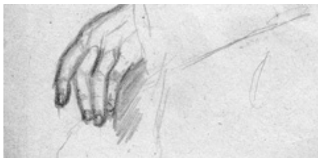
Slika 1.,2.,3.,4., Muchtinove studije ruku i nogu