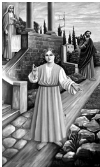
Slika 12. Sv. Obitelj, Muchtin