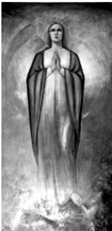
Slika 15. Sv. Marija, Mughtin, 1963.