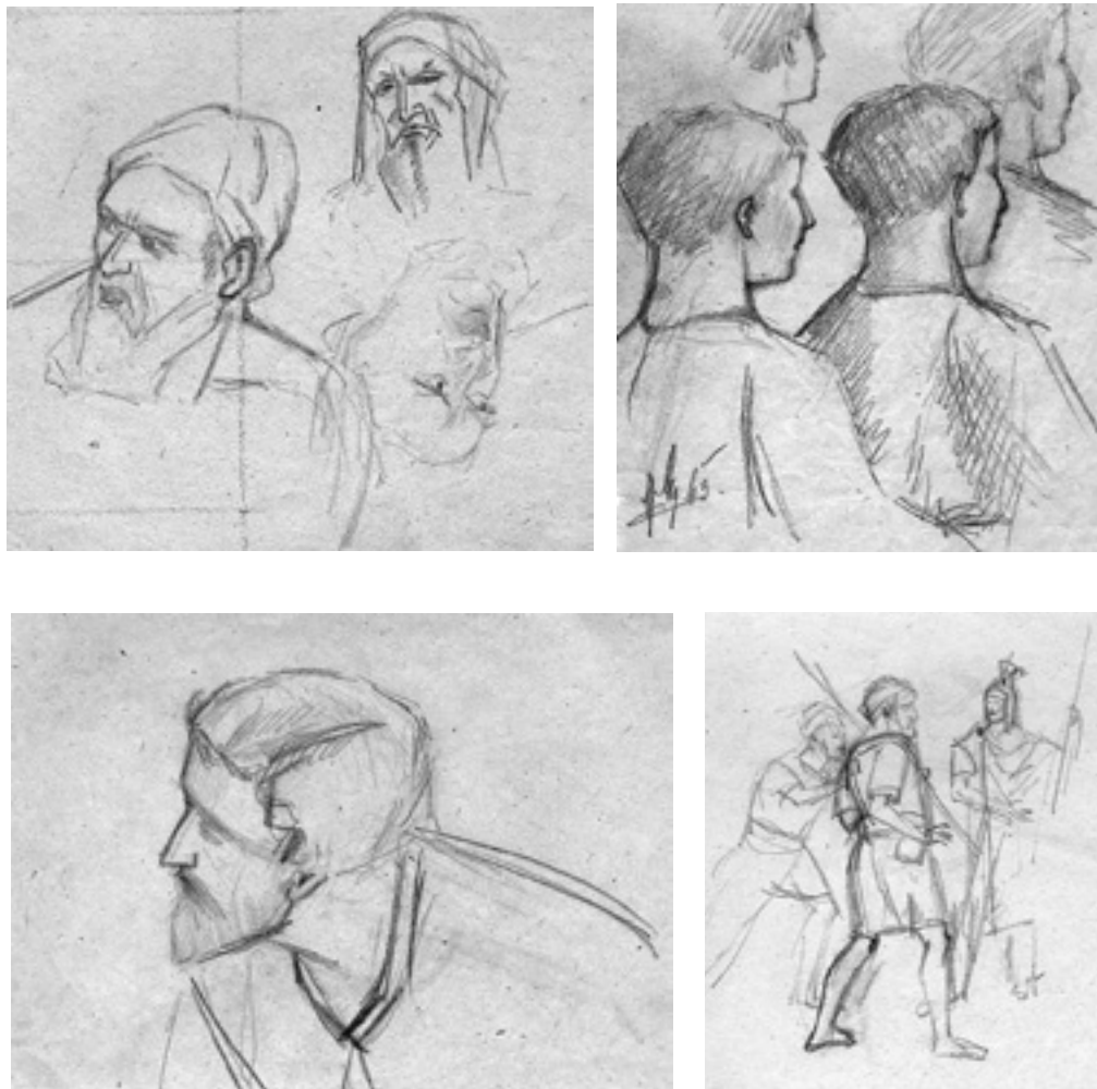
Slika 5.,6.,7.,8 Mughtinove studije lica i položaja tijela za Križni put

Jedan od zanimljivijih crteža je crtež njegove majke koji Adam očito radi po promatranju. Likovni su elementi vrlo dobro raspoređeni kao i proporcije lica na kojem je naglasak cijelog crteža. Iako se nalazi u geometriziranom prostoru, linije kojima crta njezino lice meke su i stvaraju dojam nježnosti i autorova osjećaja za osobu na slici, njegovu majku.